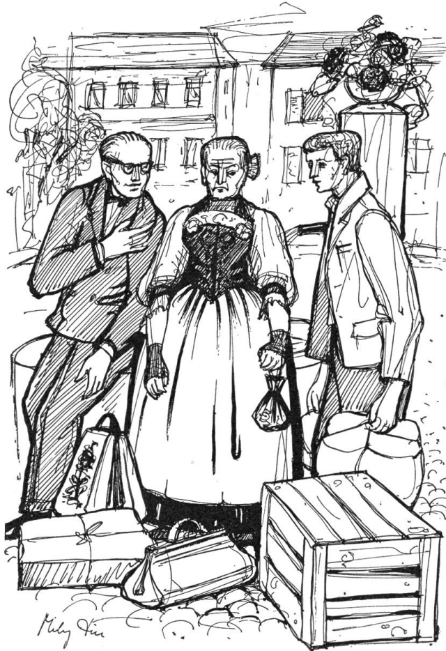
Einsam stand die Gruppe auf dem weiten Platz

gleich alles so wörtlich nehmen. Aber sie könnte nach Hamburg fahren, oder nach Brindisi, oder auf einem Meerdampfer oder einer Schaluppe, das ist einerlei, diese Pillen sind maximal, fabelhaft und todsicher, merken Sie sich die Marke, Frau Genossenvogt, bitte lesen Sie hier.“ Die Frau schaute nicht auf das gläserne Röhrchen, nicht auf den redegewandten Herrn, in unerschütterlicher Ruhe sah sie an ihm vorbei und würdigte ihn keines Wortes. „Hör einmal, Steffen“, fragte Klaus, „sag mir, bekommt man an der Universität eine solche Maschinengewehrröhre, kostet das viel? Gibts da spezielle Kurse für Schnellredner? Hast Du eigentlich Medizin studiert, daß Du Dich mit den Pillen so gut auskennst?“ — „Wodenkst Du hin“, lehnte Steffen mit beleidigter Miene ab, „Medizin, kommt für mich gar nicht in Frage, alten Leuten zuhören, wie sie ihr Bauchgrimmen beschreiben, wie sie ihr Bobo und Wehweh in die Länge ziehen, nein, dazu fehlt mir die Geduld,