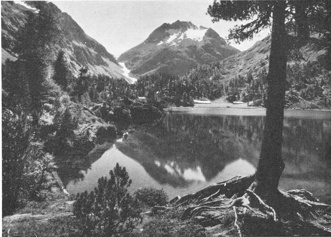
Der Carlocco-See bei Maloja mit dem Piz dei Rossi

Bei dem eifrigen Graben und Suchen kam der Abend über die Fluh. Klaus hatte eine ganze Reihe solcher Steine frei gelegt. Er war hungrig, ging in die Hütte und kochte sich eine Suppe. Vor dem Feuer sitzend und den Flammen zuschauend, fiel ihm ein, daß doch früher einmal daheim erzählt worden sei, da oben am Berg sei ein unheimliches verlassenes Grab. Klaus sinnierte, wer das wohl erzählt haben könnte.