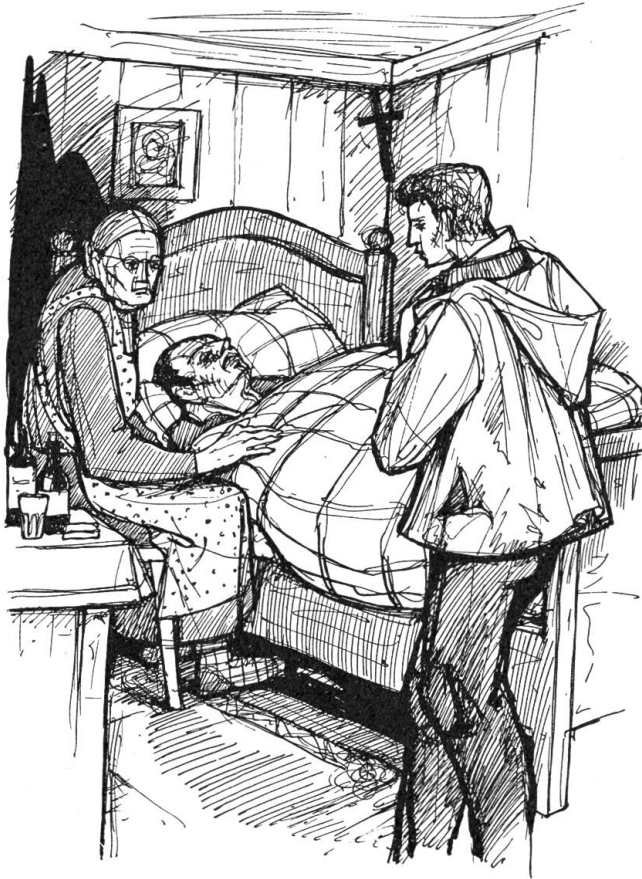
„Endlich kommst Du Klaus, endlich!“

Klaus geht jetzt nicht fort.“ Die Mutter wollte hinaus gehen. Aber Xaver rief sie zurück. „Bleib, Mutter, Du mußt dabei sein. Und meine Frau muß es auch wissen. Ruft s'Annili hinein. Alle müssen es wissen, sonst kann ich nicht mehr gesund werden.“ Klaus bekam direkt Angst vor diesem zerquälten Gesicht, diesen Augen, die sich weit zurücklegten und ein bläuliches Weiß sehen ließen. — Die junge Frau kam mit Annili zurück, sie blieben beide an der nahen Türe stehen. Die Mutter zog die Vorhänge und schloß die Türe. — Dann begann der Kranke zu reden, stoßweise, in kurzen mühsamen Sätzen: „Klaus, Du gehörst hierher auf das Heimen. Ich hab Dich betrogen. Das Testament war falsch. — Wir haben den Vater betrogen. Er hat das nicht unterschreiben wollen. Ich will gesund werden. Ich habe Angst vor dem Teufel.“ Klaus wurde bleich. Die Mutter sank auf ihrem Stuhl zusammen. — Totenstille herrschte in dem Raum. Nur Annilis lautes Weinen war zu hören