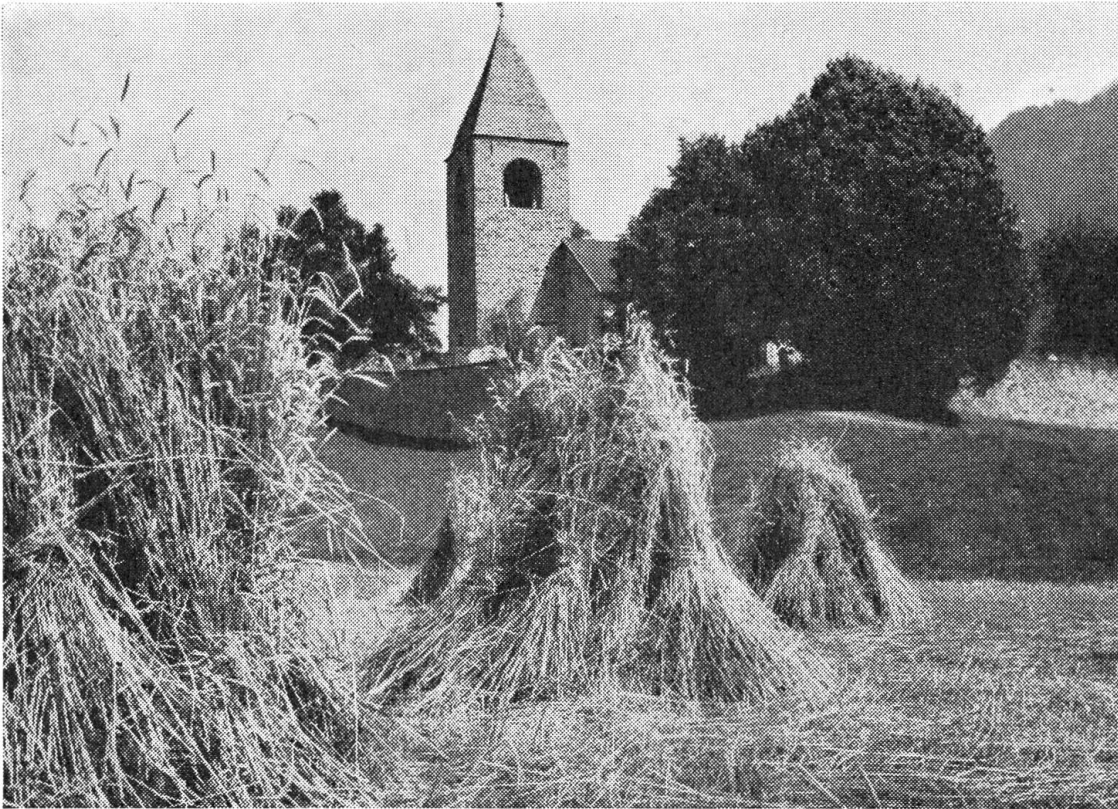
Die Kirche St. Cassian bei Sils inmitten reifer Aehren

Unter den Genossenbürgern bildeten sich zwei Parteien. Die erfahrenen und gesetzten