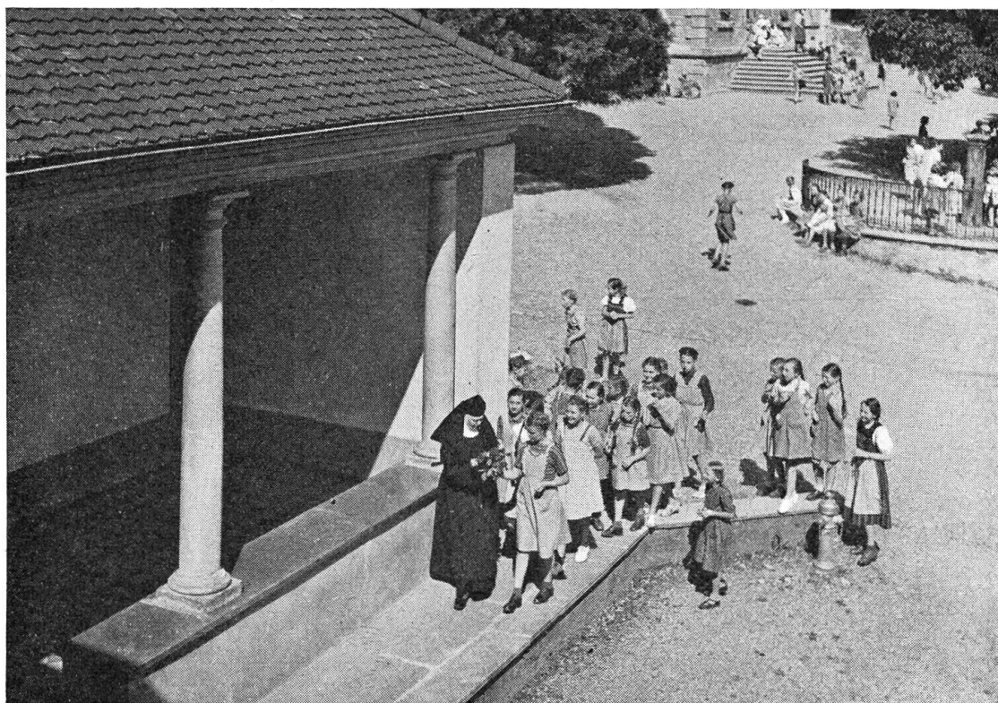
Nach Schulschluß vor dem Frauenkloster in Stans

mit blonden Haaren. „Und die blauen Augen muß ich ihm dann noch aufmalen“, sagte es lachend. Dorli aber bekam einen Schrecken, daß die Versammlung der Mädchen schon so früh zuende gegangen sei. „Da könnt ihr jetzt sehen“, sagte Klaus, „wie schreckhaft meine zukünftige Frau ist. Ihr müßt dann schon schön sachtsam mit ihr umgehen, sonst bleibt ihr plötzlich einmal der Herzschlag weg.“ „Sag nichts, Klaus“, gab Dorli lachend zurück, „wenn