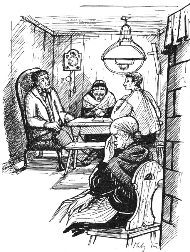
„Der Wille meines Vaters ist mir heilig!“

Nach dem feierlichen dritten Gedächtnis in der Kirche, vernahm Klaus von seiner Mutter, daß der Vater in den letzten Tagen ein Testament diktiert habe. Sie hät-