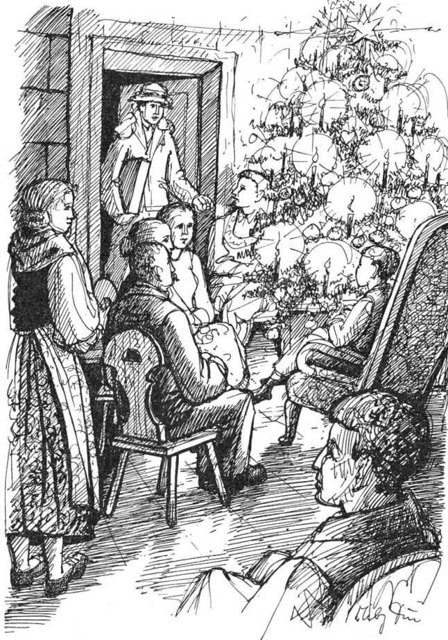
So kam dann eben ein Schneemann in die Stube