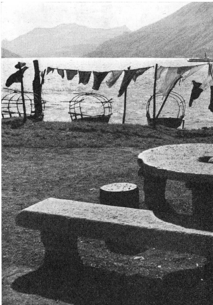
Am Langensee

rotwangig, erhitzt vom so schnellen Laufen, wie eine Sonne leuchtend. Klaus schaute wie gebannt auf das Mädchen, das flink herauf kragelte und vor ihm mit schnellem Atem stehen blieb. Klaus sagte: „Hat Dich auch der Gwunder endlich hierher getrieben?“ „Sagst Du dem Gwunder Klaus?“ frug es atemlos und dann schnell: „Sag mir Klaus, wie lange geht ein gutes Jahr?“ „Ein gutes Jahr ist kürzer als ein