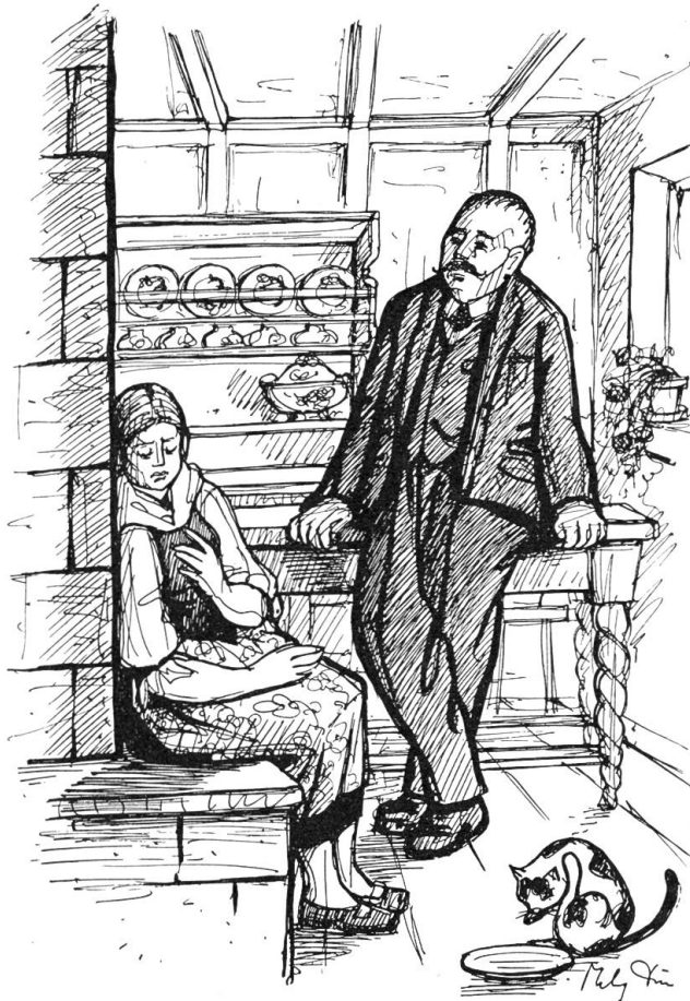
Das war ein wichtiger Schlag für das arme Mädchen

mit mir nie davon gesprochen. Du hast ihn nur ein einziges Mal da gehabt. Aber Dein Vater ist nicht blind.“ Dorli neigte sein Köpfchen und betrachtete mit starren Augen seine Hände, die müde auf der Schürze lagen. Der Vater begann hin und her zu gehen und fuhr fort: „Ich weiß nicht, wie weit diese Freundschaft mit Klaus schon ist. Darum will ich mit Dir reden, bevor es zu spät ist. Der Klaus muß ab dem Heimen.“ Dorli sagte: „Ich weiß es.“ Der Vater sprach wieder: „Klaus hat die Spreiti gekauft, davon kann er allein nicht leben. Er muß also tagelöhnern oder aushilfsweise Knecht sein. Das ist keine Zukunft. Meine Kinder sind sich an gute und finanziell gesicherte Verhältnisse gewohnt. Du könntest Dich nie in solche arme, ungewisse Verhältnisse eingewöhnen. Es ist also meine Pflicht, Dich vor dem Elend und Unglück zu bewahren. Ich verbiete Dir, mit dem Klaus zusammen zu kommen. Ich verbiete Dir, ihm zu schreiben. So entschieden, so bleibts! Ich sage Dir das jetzt. Hör auf mit diesem Klaus, besser jetzt, als wenn es zu spät ist.“ — Dorli schaute auf und sagte laut: „Vater, es ist schon zu spät!“ Erschrocken blieb der Vater stehen und schaute mit großen Augen auf sein Meitschi. „Was sagst Du?“ Dorli gab mit einem offenen strahlenden Gesicht den festen Blick zurück und sagte mit voller, heller Stimme: „Ich habe dem Klaus geschworen, daß ich ihm immer treu bleiben will.“ Der Vater schaute zu Boden. „Aha,