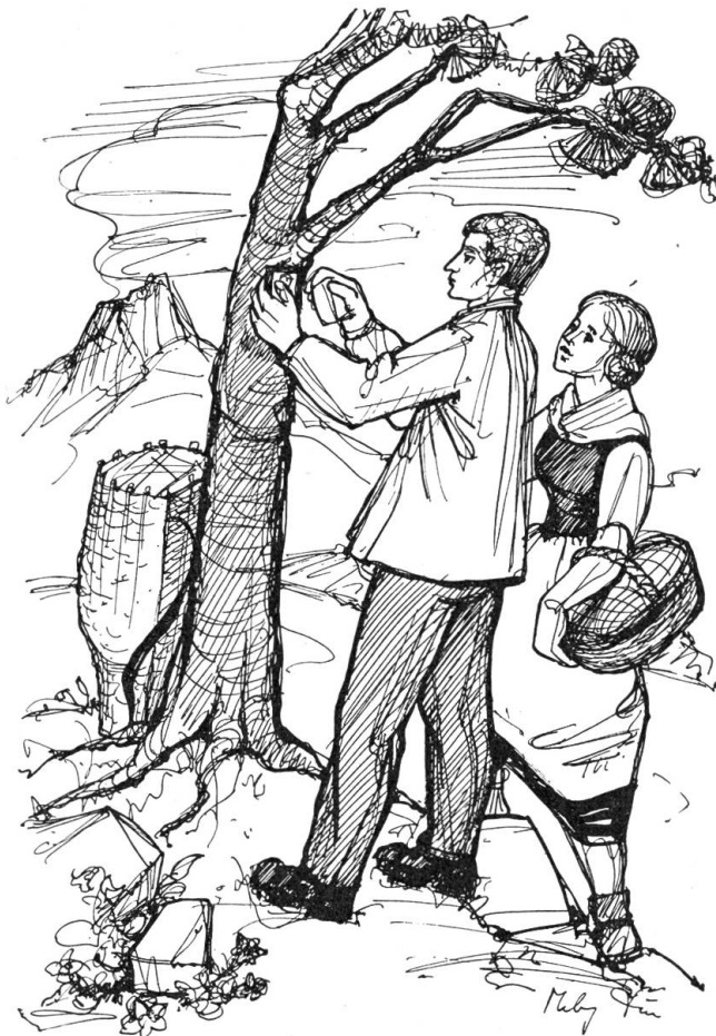
Ohne daß er ein Geräusch gehört hätte, stand Dorli hinter ihm

Der Donnerstag, der lang ersehnte Augenblick kam. Klaus war schon früher als verabredet bei der Wettertanne. Er stellte seine Traglast an einen Baumstamm nebenan, zog aus der Tasche ein sorgfältig eingewickeltes Rähmchen, mit einem Bild des Bruder Klaus, suchte einen faustgroßen Stein und begann nun das gerahmte Bild mit Nägeln an diesen Baum zu heften.