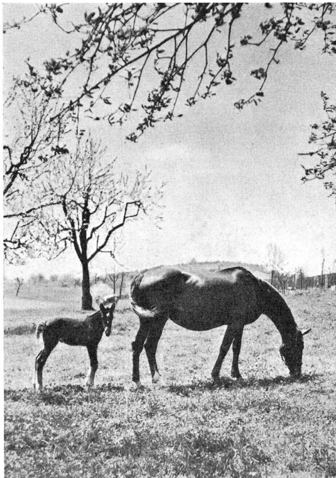
Abendfriebe im Freiburgerland

und von den Neuigkeiten. — Sobald der Mann allein war, sagte Klaus zu ihm: „Hört, Andrees, ich möchte gerne etwas mit Euch besprechen, wo uns niemand hört.“ Andrees dachte nach, horchte nach allen Seiten, überlegte und sagte: „Gut, gehen wir in den Wald hinauf.“ Schweigend schritten sie hintereinander her durch das letzte Herbstgras und verschwanden in den Bäumen. Dort oben, an einen verfal-