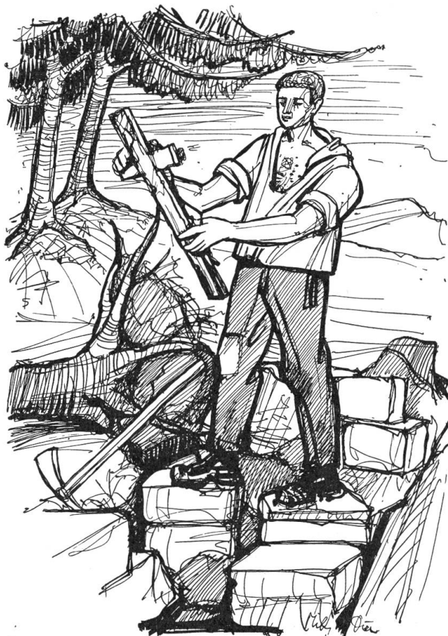
Er fand ein altertümliches Kreuz

Mann mit einer Rüstung stand vor ihm mit einem großen weißen Kreuz auf der Brust. Diese Gestalt streckte eine blitzende Hand nach ihm aus, mit einem spielenden Licht, das geisterhaft das Gesicht im Helm beschien und sich in den großen schwarzen Augen spiegelte. Die Gestalt begann zu sprechen mit einer hohlen Stimme: „Ich habe einen Ort gesucht, um Gott allein zu dienen. — Nun liegt mein Leib seit langer Zeit im Wald verscharrt. Er sehnt sich nach geweihter Erde, nach einem christlichen Grab. — Du wirst ihm Ruhe geben. — Du wirst Deinen Lohn erhal-