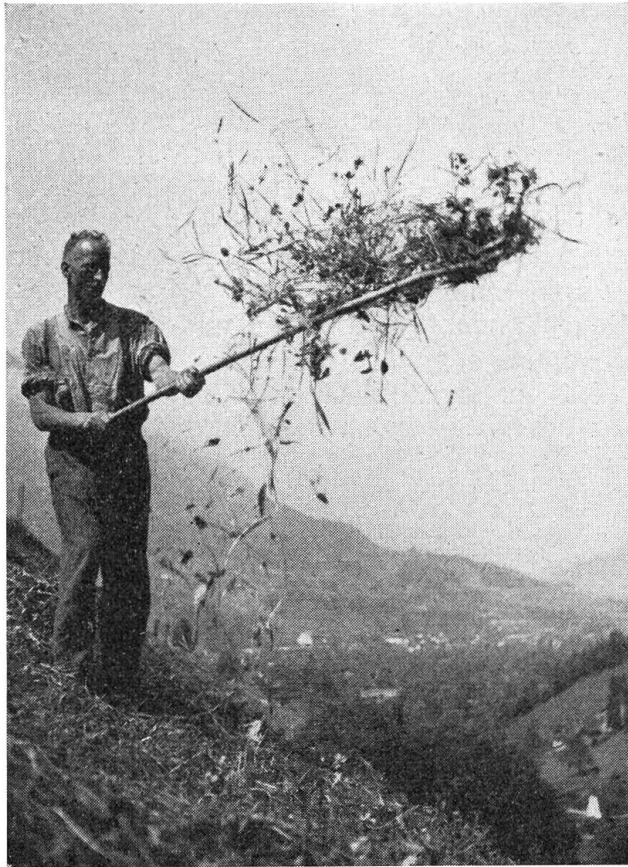
Bergheu im Morgenwind

Klaus schaute ebenfalls ganz verwundert auf seinen Arm, dann aber winkte er ab: „Ist nicht der Rede wert, hat ein wenig durchgeblutet, macht nichts“, und setzte sich schnell auf die Bank hinter dem Tisch. Aber Dorli, flink wie ein Wiesel, sprang ihm nach, knöpfte ihn auf und schob den ver-