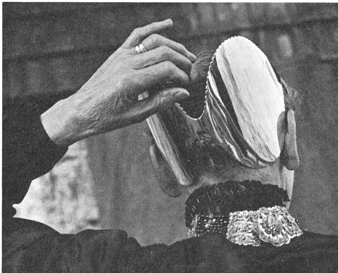
Nidwaldner-Frau zum Kirchgang gerüstet