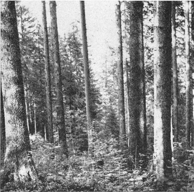
Einer unserer schönsten Gebirgsfichtenbestände

Der Besucher, der mit seinem Auto unsere Gegend bereist, wird Nidwalden als typischen Laubholzkanton taxieren. Erst wenn er sich die Mühe nimmt, die Steilstufe zu überwinden und die weiten Seitentäler mit ih-