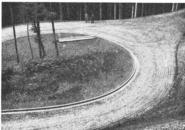
Moderner Waldstraßenbau

Nachdem wir nun verfolgt haben, wie das Holz von seinem Standort im Walde auf den Verkaufsplatz im Tal oder an der Waldstraße gelangt, wollen wir das Schicksal des Holz-