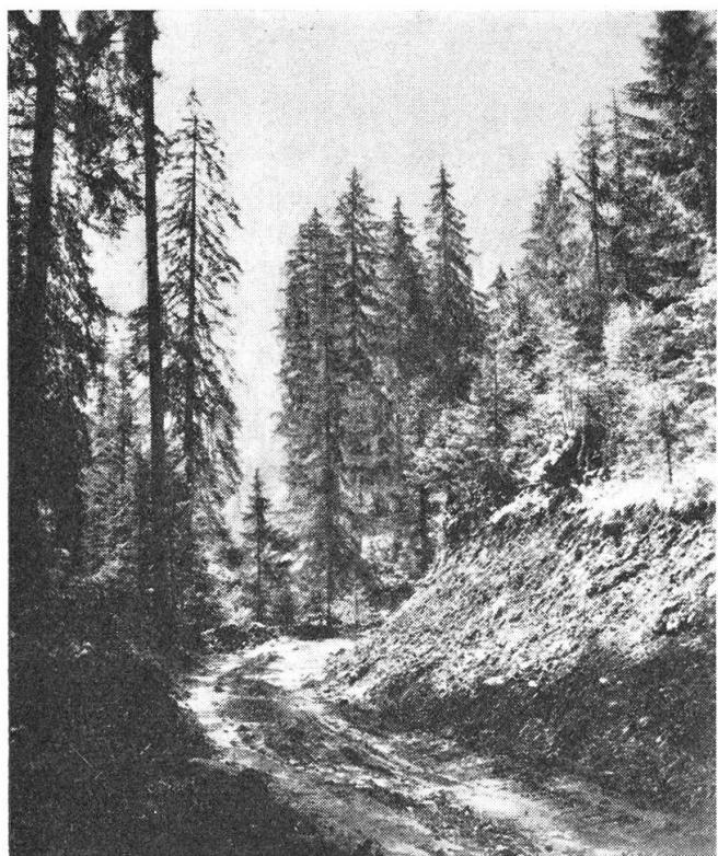
Waldstraßenbau ermöglicht eine rationelle Nutzung auch im Gebirgswald