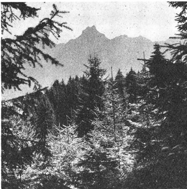
Aufforstung im Gebirgswald

Der Wald ist heute vor allem auf jene Gebiete zurückgedrängt, die zufolge ihrer Steilheit, ihrer Schattenlage oder wegen dem schlechten, nassen oder steinigem Boden eine landwirtschaftliche Nutzung nicht zuließ, oder unwirtschaftlich und unrentabel wäre. Viele der Waldgebiete würden ohne Baumbestockung zu unproduktivem Boden. Wir dürfen deshalb die Produktionsfähigkeit dieser Ge-