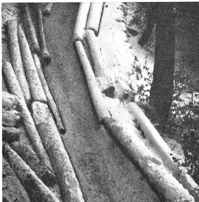
Früher üblicher Transport in einer „Holzverleggi“

Holzernte und des Transportes hat sich in den typischen Holzerfamilien vom Vater auf den Sohn, in den Holzerguppen vom erfahrenen Meister auf seine jüngeren Gehilfen vererbt und übertragen. Wir wollen alles daransetzen, daß uns dieser hoch entwickelte Berufsstand erhalten bleibt, daß sein guter Ruf zu Recht bestehen wird und immer wieder junge, kräftige, arbeitswillige Burschen sich diesem harten, aber stolzen Berufe in der freien Natur, in unserem schönen Walde, zuwenden werden.