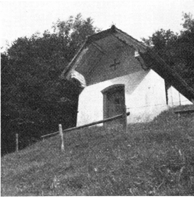
Hier steht die „Verlassenste Mutter-Gottes“ in der kleinen Kapelle im Heimwesen „Hinter-Rengg“ ob Hergiswil.

gründe zum Pilatus hinüber. Oberförster Kaiser hat mir erzählt und ein wildverwegener Jäger hat es bestätigt, daß in den Lopperfelsen viele Jahre ein Bock gehaust hatte. Die Jäger wußten von ihm, und gar viele wollten das arme Tier erjagen. Aber der alte Schlaumeier kannte Weg und Schliche besser als der gerissenste Jäger, und fand stets wieder zu seinem Schlupfwinkel zurück. Als er so alt war, daß er einen ganz grauen Grind hatte, ereilte auch ihn das Schicksal. Der Gemsbock wurde angeschossen, entkam und wurde später ganz verlüdert aufgefunden. Es ist als großes jagdliches Kuriosum zu werten, daß Gemsen auf einem Berg von so geringer Meereshöhe ihren ganzjährigen Einstand haben. Nun wissen wir auch, weshalb die Hergiswiler eine stolze Gemse in ihrem Wappen führen.