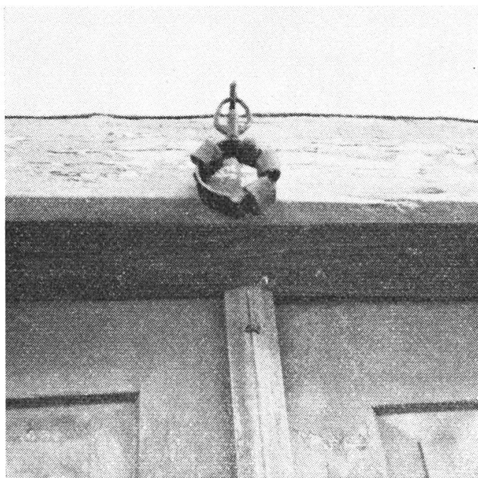
Die Handschelle an der Kapelle in der Vorder-Rengg

Wer vom Lopper erzählt, darf das muntere Weidwerk an dieses Berges Hängen nicht vergessen. Auf der Loppersüdseite haben die Rehe ihren Einstand. Dort finden sie Atzung und haben freien Weg zur Flucht hinunter zum See. Schon öfters wurde ein Reh gesichtet, das sich über den See schwimmend in den Hinterberg flüchtete. In den trutzigen Tossen auf der Nordseite hausen die Gemsen. Das obere und das untere Band die von der Rengg her über die steilen Felsen führen, ist das Gebiet der scheuen Grattiere. Nur eines dieser Bänder ist für Jäger durchgehend passierbar, jenes das sich bis zur alten Lezi an der Rengg hinzieht. Das Klettern in den Bändern ist wegen Steinschlag für Jäger und für die Passanten auf der Straße ungemein gefährlich, deshalb ist heute die Jagd am Nordhang des Loppers verboten. Von diesen Bändern wechseln die Gemsen in die „Mittagteiffi“. Auf der Flucht springen sie entweder durch die „Bierkeller-Dole“, früher sogar bis zur Straße hinunter, oder sie wechseln auf den Grat in die Obwaldner Jagd-