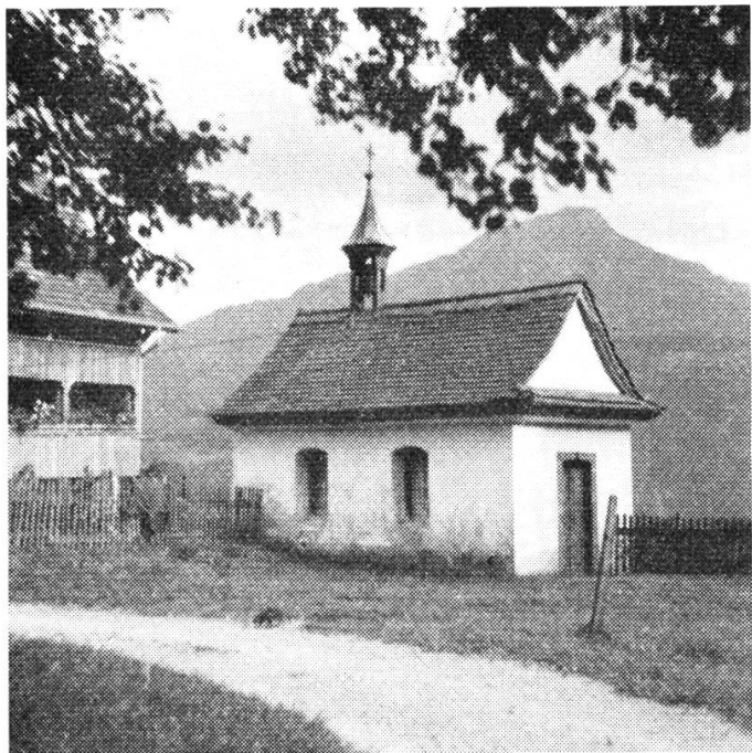
Die Rengg-Kapelle auf der Alpnacherseite