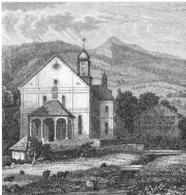
Kirche und Dorf-Bach von Sachseln nach einem alten Stich

Am 7. September abends gegen 6 Uhr muß es im Riederberg unglaublich gewettert und gehagelt haben. Die Biße und der Wetterluft lagen einander in den Haaren und wo die zusammenreßen, geht es nicht gestittet her. Es schüttete auch im Sachslerdorf, aber an eine Ueberschwemmung dachte niemand, bis das unheimliche Losen jedermann aufmerken ließ. Da war der Chilebach schon voll bis zum Rand. Mannshoch und wie das Wetterleich so schnell, schossen Wasser und Schutt daher. Die neue Bachschale krachte schon im Balmli auseinander und im Rotacher waren die unterfressenen Wuhren schon fortgeschwemmt. Zum großen Glück hielten die zwölf Talsperren, die der Bauunternehmer v. Flüe im Steinibach und auf Kurigen erstellt hatte, stand. Bis drei Meter hoch lagerten sich Schutt und Steine in diesen Sperren ab. Zuerst waren viel zu wenig Leute da, um zu helfen. Die Edisrieder und die im Berg hatten ihrer eigenen Not zu wehren. Die Kreuz-