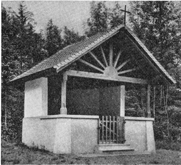
Kapelle bei der alten Kirche Giswil

nie ein gutes Zeichen.“ — Und wahrhaftig, am Magdalenenstag anno 1887, ist der Eybach überlaufen. Unter dem Horn, im Einzugsgebiet des Bachs, gab es ein furchtbares Hagelwetter, dazu regnete es in Strömen, es war ein richtiger Wolkenbruch. Die Lungerer hörten das unheimliche Tosen im Berg und wußten wo Land's. Trotz den bestehenden Verbauungen gab es eine schreckliche Ueberschwemmung. Zuerst wirbelte der Luftdruck ganze Wolken von Staub und Gischt empor. Dann kamen große Steine ganz trocken daher und im nächsten Augenblick war die Bachschale hochauf mit Schutt und Steinen gefüllt. Die Güter zu beiden Seiten, im schönsten Sommerflor, wurden mit Schlamm und Geröll zugedeckt. Haus hohe Felsblöcke wurden, als wären es Nußschalen, von der rasenden Wut des Wassers hinuntergetragen. Ein solcher maß 107 Kubikmeter. Ein Riesenbrocken blieb ein Stück ob der Kirche mitten im brodelnden Wasser stehen. Dadurch bekam der Bach einen anderen Lauf. Er teilte sich — ein Arm mit einem ganzen Strom von Schmutz, Steinen und Bäumen floß direkt der Kirche zu. Oben ein Stall und unten das Beinhaus wurden weggefegt wie Zündholzschachteln, der Friedhof übermannshoch mit Schutt, Trümmern und Schlamm bedeckt. Der andere Arm wälzte sich ebenso breit dem Dorfe entgegen. Die prächtigen Matten wurden versart. Das schöne heimelige Lungererdorf