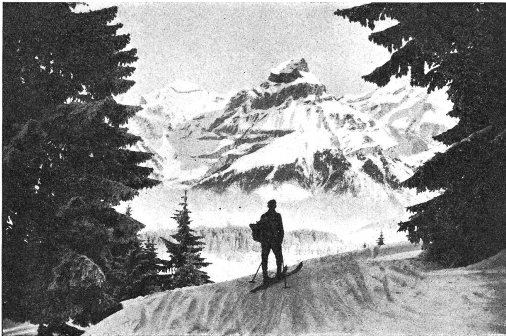
Der Hahnen, das Wahrzeichen von Engelberg

Inzwischen hatte die Tagsatzung einen neuen Entwurf zum Bundesvertrag mit 45 Paragraphen ausgearbeitet, stellte ihn den Kantonen zu und erbat Antwort auf den 11. Juli 1814. Erst am Vorabend dieses Termins versammelte sich die Nidwaldner Landsgemeinde zur Stellungnahme. Die Genossenpartei unter Obervogt Zelger