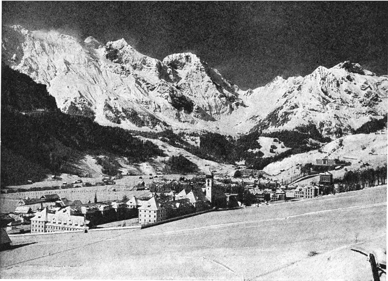
Engelberg der größte Winterkurort der Zentralschweiz

Benehmen bey diesen uneidgenössischen Schritten zu beweisen und da nicht nur Rath und Hilfe zu suchen, sondern uns auch für die Zukunft zu sichern.» Und Anfang Mai beschloss die Talgemeinde Engelberg die Lostrennung von Nidwalden. Die herrschende Partei Nidwaldens zeigte sich nicht überrascht, ja es schien, dass sie diesen Beschluss begrüßte. Man verlangte lediglich die Rückgabe der Militäreffekten, die den Engelberger Auszögern abgegeben wurden und schrieb dazu, dass man «Engelberg freien Willen lasse, seinen politischen Zustand zu ordnen, wie es ihm für jetzt und in Zukunft konvenieren möge».