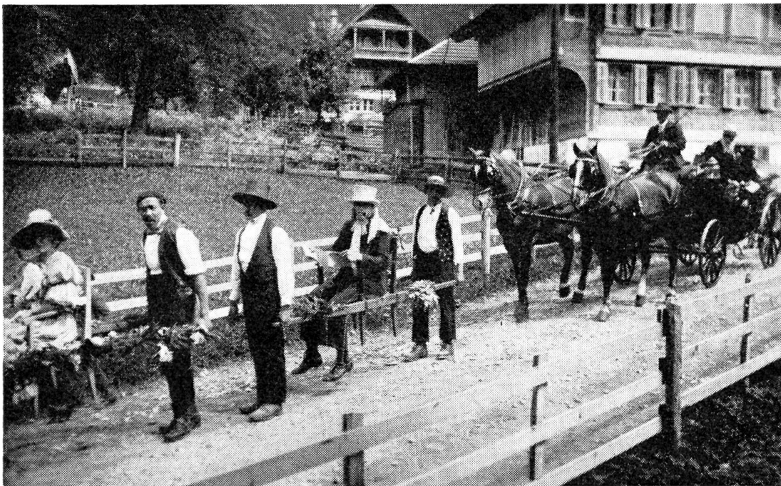
Träger und Kutscher in Lungern

Jetzt begann die Zeit der Kutscher oder Roßner. In Giswil und Lungern wurden