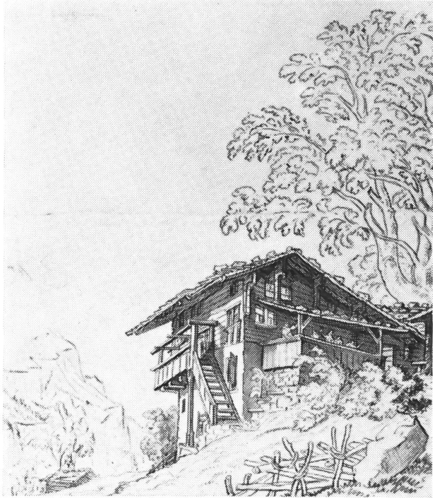
Zollhaus auf dem Brünig