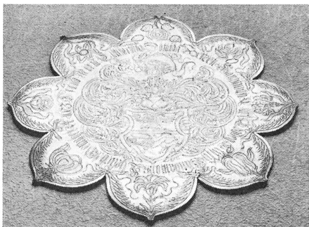
Diese prächtig gravierte Zinn-Platte wurde im Brandschutt des Gasthauses zum Hirzen, das im Besitz der Familie Obersteg war, gefunden. Der Hirzen stand bis 1713 neben dem Dorfbach vor der heutigen Kantonalbank.

In den Dörfern kamen die Tanzlauben auf. Dies waren offene, gedeckte Holzbauten. In Buochs stand sie oben im Dorf über dem Dorfbach, auch in Beggried und