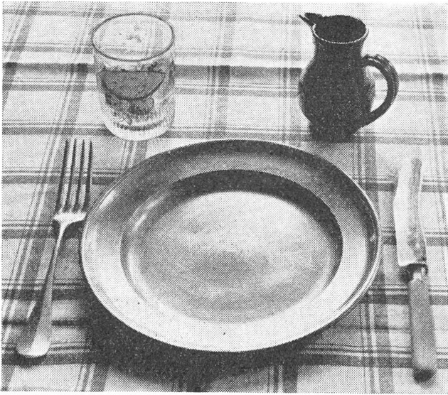
Daß die Klosterfrauen nicht sehr genußsüchtig waren zeigt das bescheiden-kleine Krüglein das ihnen an Festtagen mit Wein gefüllt aufgestellt wurde.

allein in sinem Hus, oder wenn er zu einem gueten fründ ze dorff gienge».