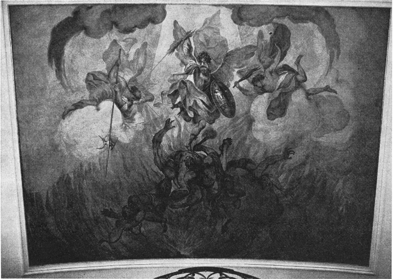
Unter dem süßlichen Engeltriumph kam auf der Originalschicht ein handfester Höllensturz der Verdammten zum Vorschein.

che auffallend, die Darstellung dessen, was folgt, wenn man nicht in den Himmel kommen kann oder ihn nicht erstrebt: ein aussagekräftiger Höllensturz. Gerade dieses letzte Bild war die Entdeckung während der Restauration, weil es von Deschwanden mit einem lieblicheren Hinweis auf das Jüngste Gericht übermalt war (während die andern Deckenbilder zum grössern Teil mit kräftigeren Farben nachgemalt waren).