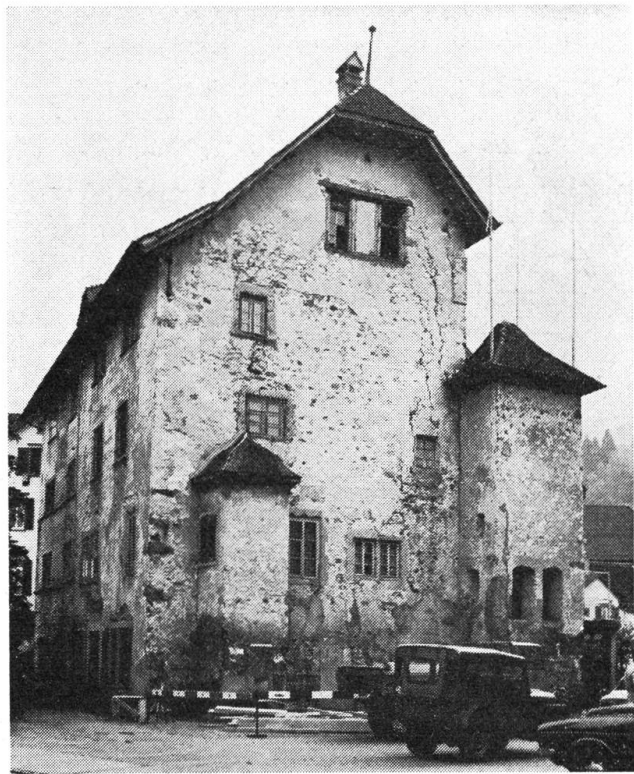
Altersschwach und verfallen sah das Höfli aus, als es vom Efeu befreit war.

Nach dem Kauf der Liegenschaft (mit Haus, Gaden und über 5000 m 2 Umschwung), musste die Höfli-Stiftung vorerst den im Verlauf der Jahrhunderte in vielen Stilarten gewachsenen Baukomplex archäologisch untersuchen lassen. Anschliessend musste in pietätvoller Planung das Gesicht gesucht werden, welches das Haus vor bald dreihundert Jahren zur Zeit von Landammann Keyser dessen vornehmen Besuchern präsentierte. Dann kam das langwierige Subventionierungsverfahren. Gleichzeitig wurden innerhalb und ausserhalb des Kantons die Geldmittel gesammelt, welche die Bezahlung des Kaufpreises und die Inangriffnahme der Bauarbeiten ermöglichten. Vor gut anderthalb Jahren konnte endlich mit der Aussenrestauration des Höfli-Hauses begonnen