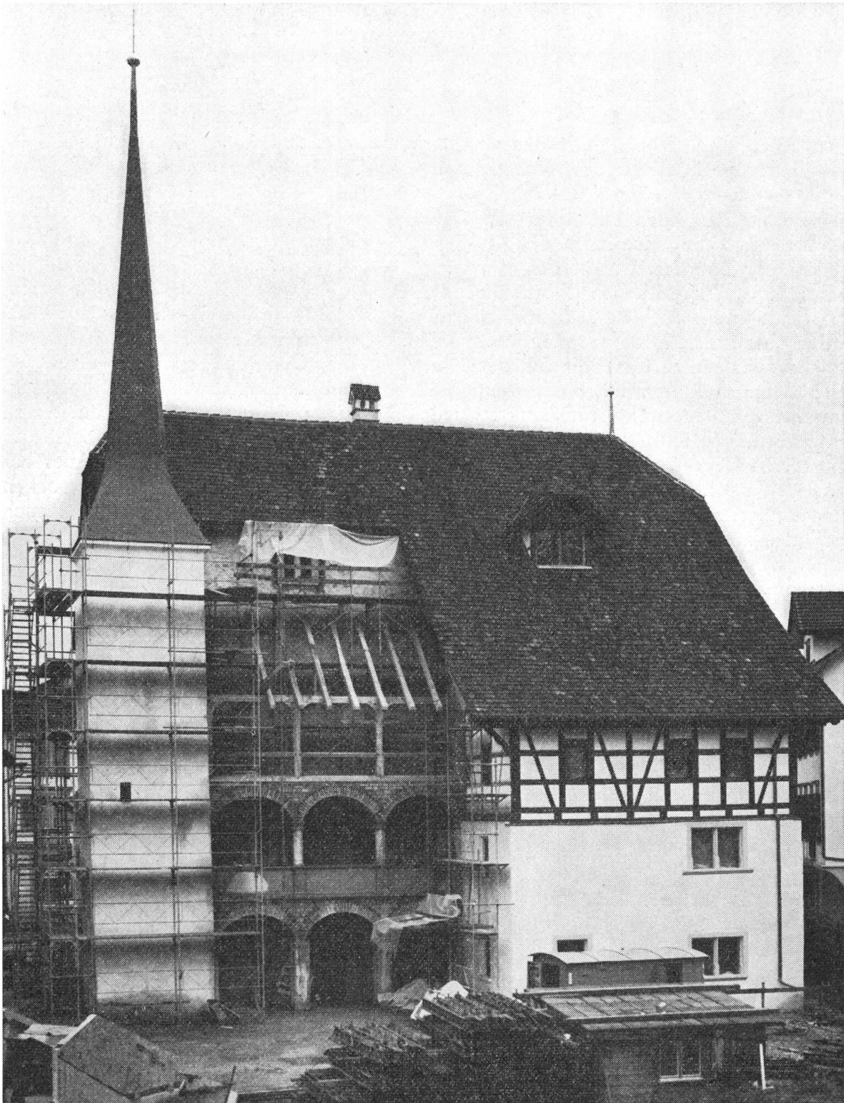
Bald wird diese fast unbekannte Südwestseite der Rosenberg eine Attraktion sein.

unsere kleinen Verhältnisse gewagte Unternehmen zu einem guten Ende führen zu können. Mit der Unterstützung aller muss es gelingen, aus dem Höfli eine lebendige