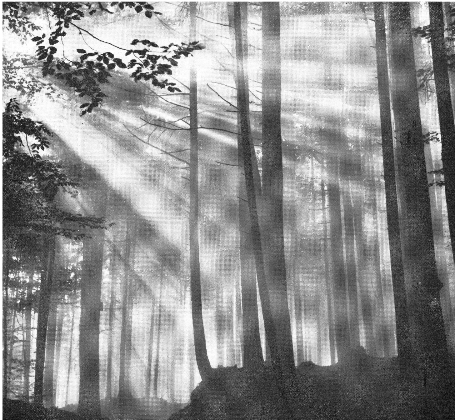
Die Strahlen der letzten Sonne im Herbstwald.