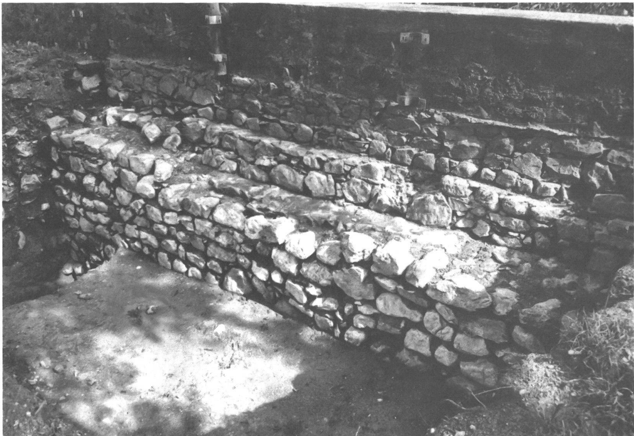
Teil der umfassenden Ringmauer aus dem 11. Jahrhundert mit verschiedenen späteren Aufbauten, gegen das Sarner Dorf hin aufgenommen.