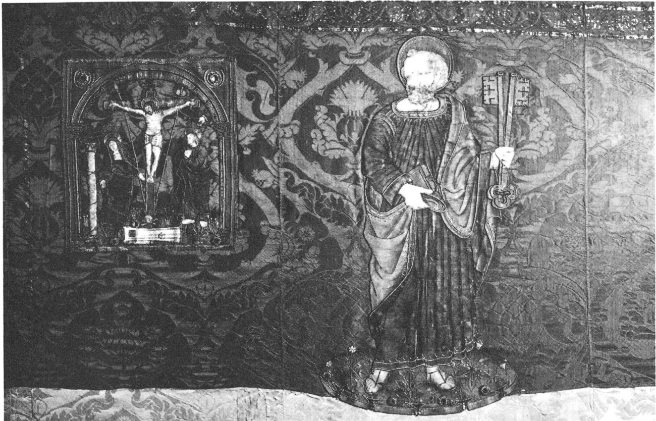
Juliusbanner von Unterwalden