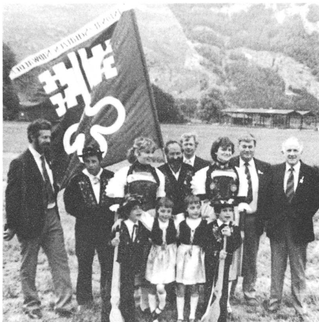
Dies war die Nidwaldner Delegation des Kantonalverbandes am offiziellen Tag in Chur.