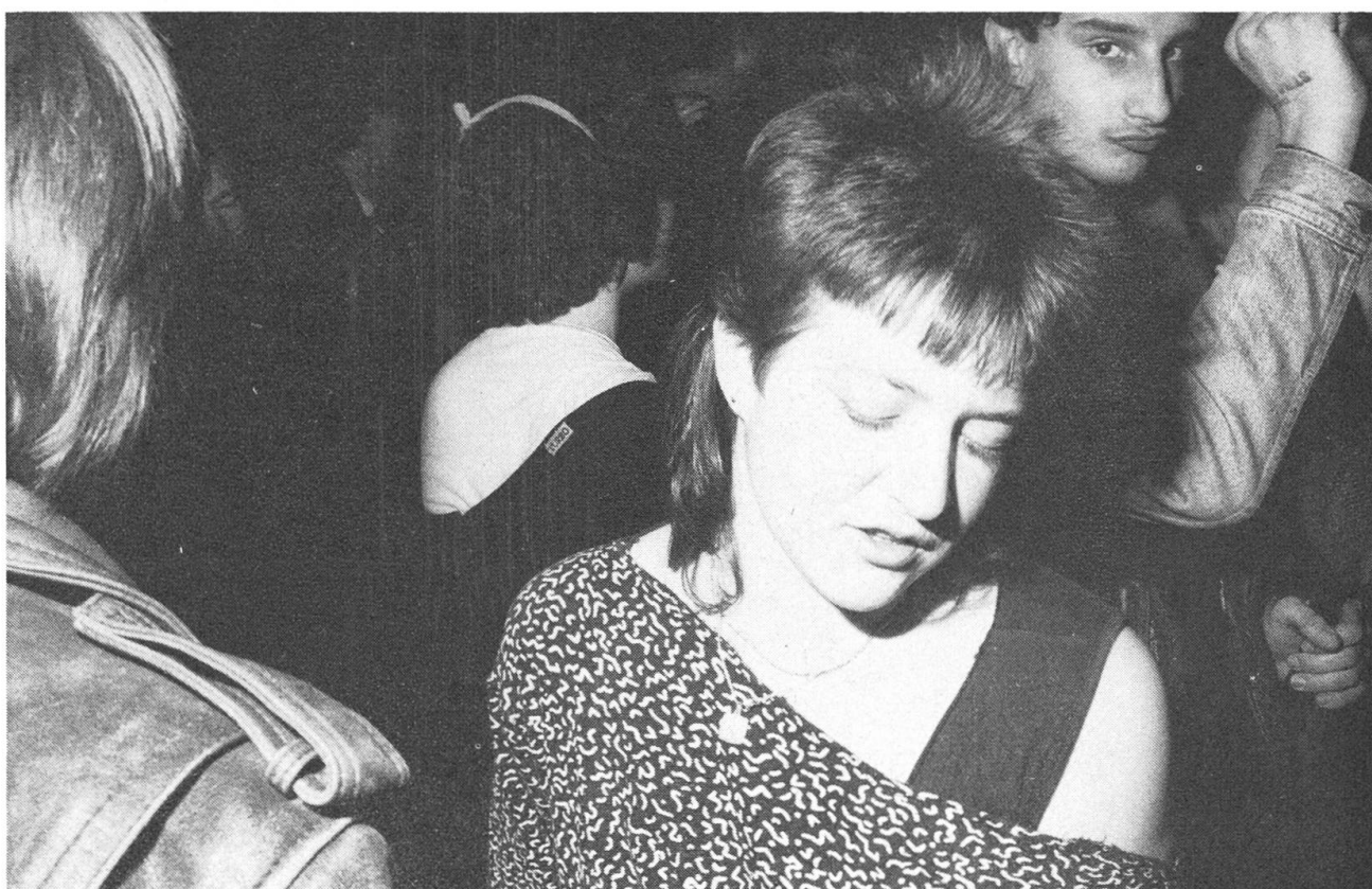
Niederrickenbach Disco, Beckenried