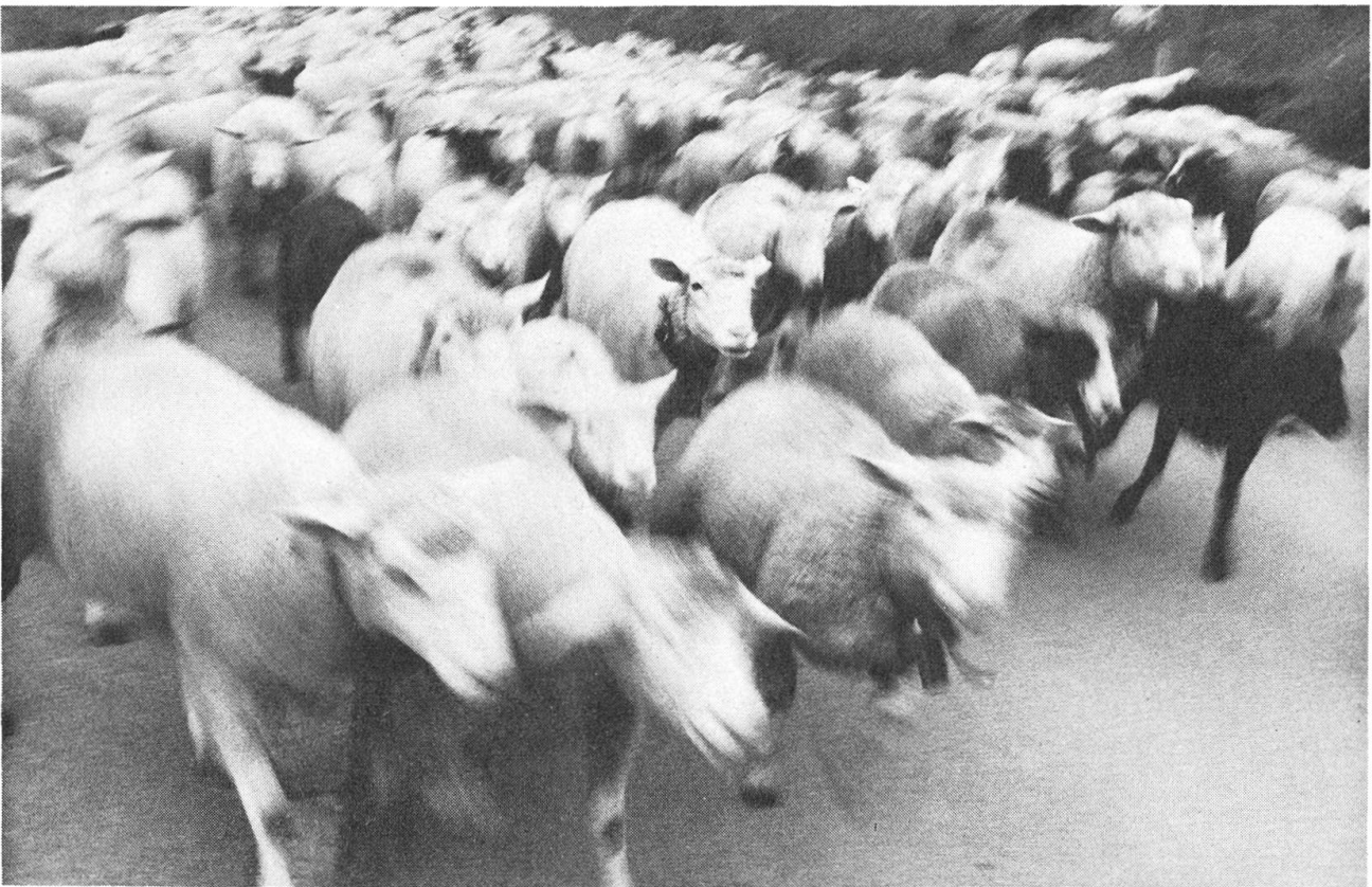
Bittgang, Buochs Alpaufzug, Oberarni