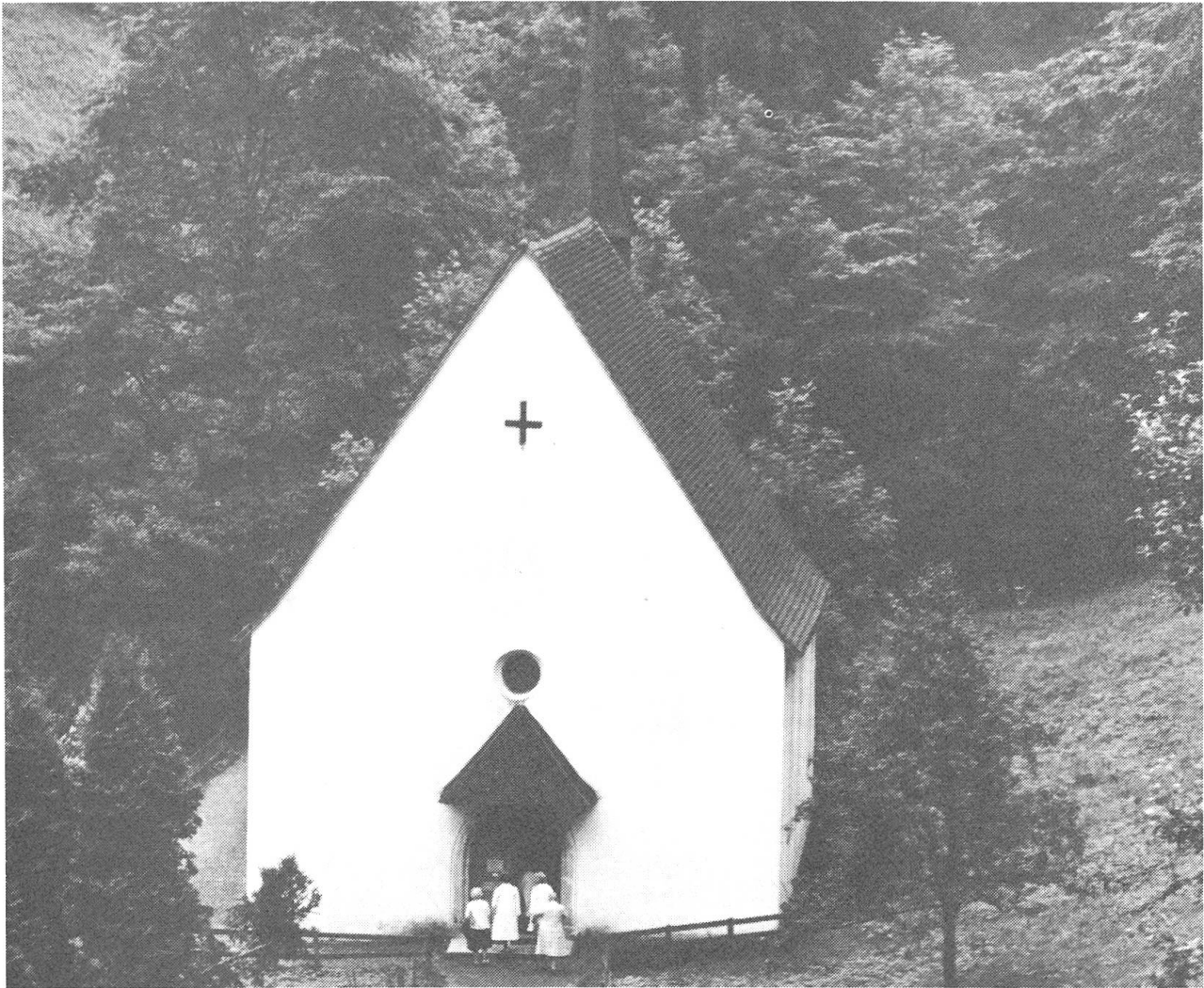
Die untere Ranftkapelle, die 1501 begonnen wurde. Sie wurde aus den Spenden frommer Pilger, den Zuwendungen des Bischofs von Sitten und Kardinals Matthäus Schinnerer gebaut.

von Sachseln in langen Reihen hinaufziehen zum Altar auf dem Flüeli und dann hier herunter in den weltabgeschiedenen Ranft: