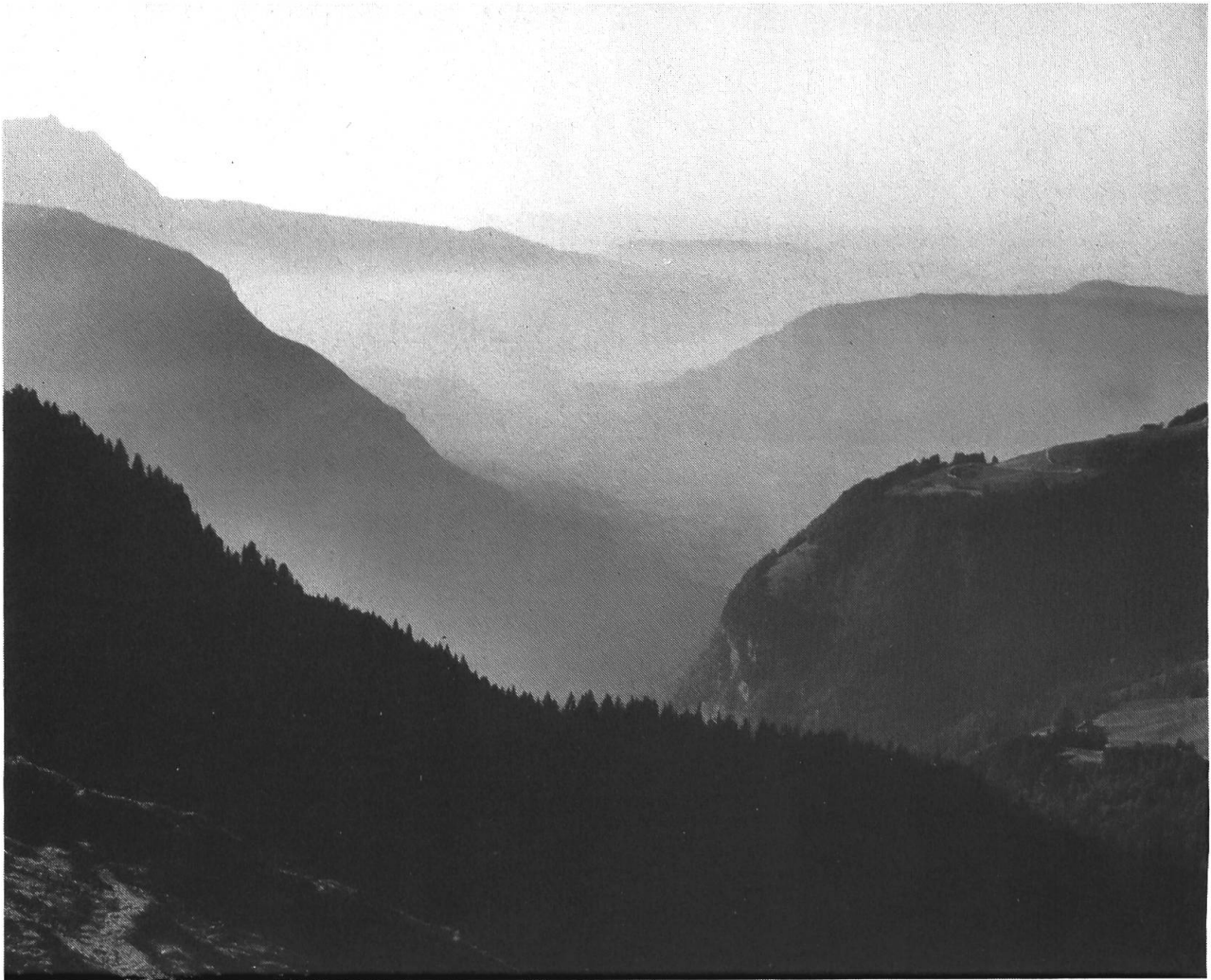
Still durch einen solchen Morgen zu wandeln muss uns auf gute Gedanken bringen.

deiner kleinen Kapelle Gottesdienst halten; und du, Bruder Klaus, sollst mir dabei als Ministrant die Gaben darbieten! Gaben, die wie Brot sind und Heimat und die gefalteten Hände der Bergler.