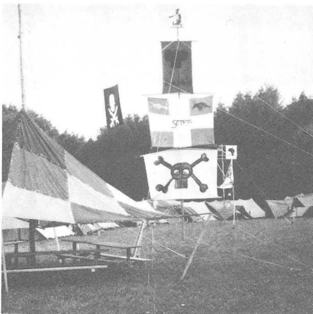
Fahnenturm im Pfadilager in Stans im Sommer 1986.

Viele junge Leute wandern aus der bürgerlichen Kirche aus, weil sie weder das Besinnliche noch das Politische in der Kirche vorfinden.