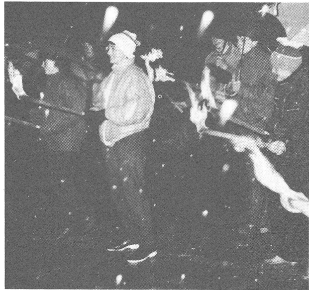
Fakelzug zum Jugendgottesdienst in der St. Jostkapelle.

Jugend und Zukunft — Jugend und Kirche «Der Jugend gehört die Zukunft». Eine Aussage, die uns Erwachsenen so leicht über die Lippen fliesst. Vielleicht schwingt in dieser Aussage ein bisschen Wehmut über unsere vergangene Jugendzeit mit. Oder spüren wir