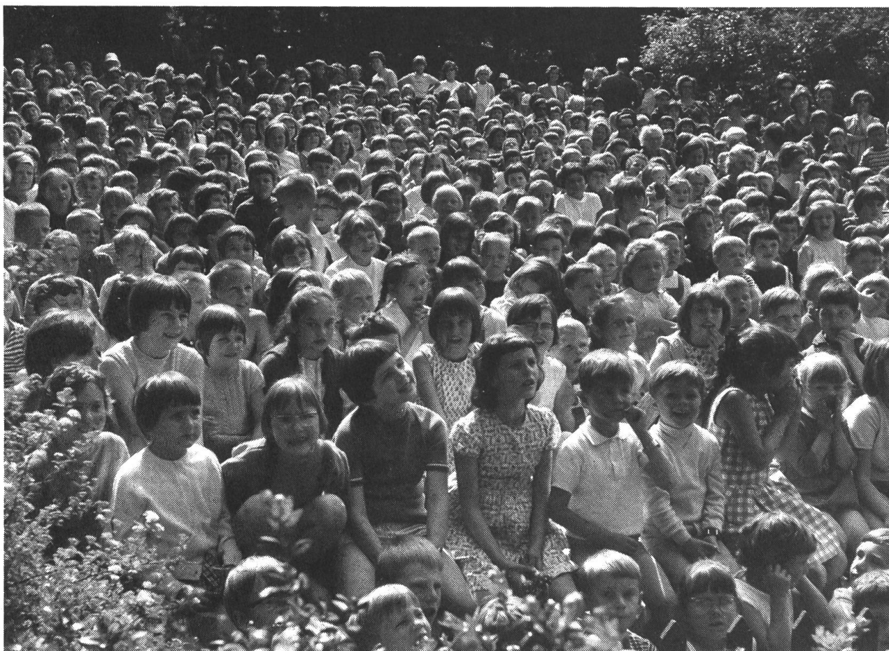
So viele Jungen warten auf das Wort, das sie ergreift.

Der Weg besteht darin, auf das je Eigene zuzugehen und das Gemeinsame im Anderen entdecken.