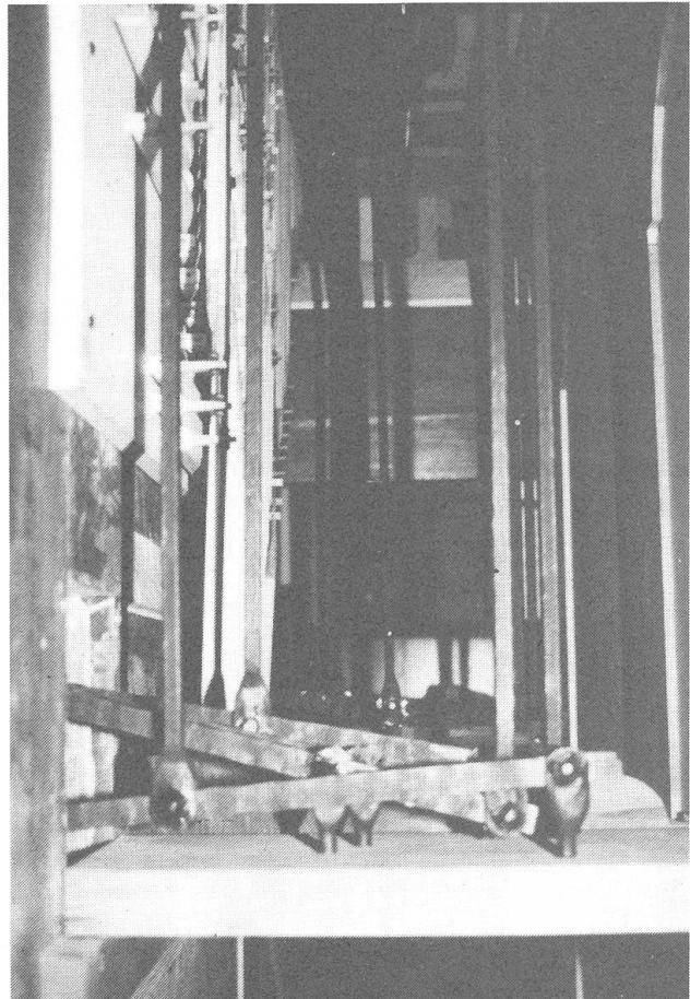
Blick ins Innere der Orgel mit der wiederhergestellten, schmiedeisernen Registratur.

«Im vergangenen Jahr 1969 konnte die Renovation des Singhauses über der Sakristei in der Pfarrkirche Stans abgeschlossen werden.