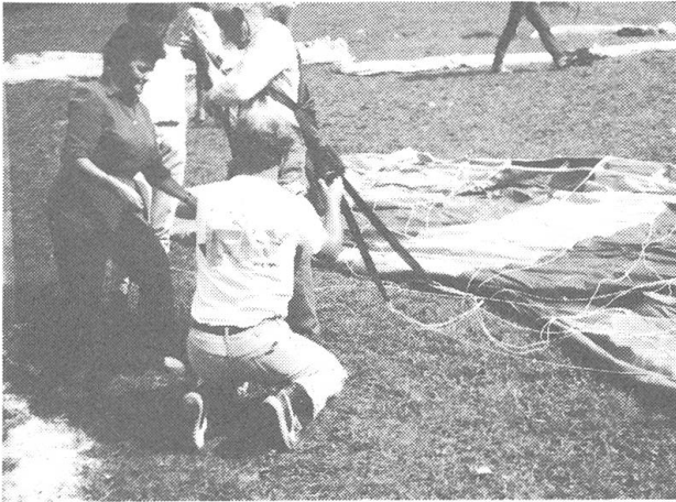
Gut instruiert und sorgfältig angeschnallt ist das «halbe Leben» auch bei diesem begeisternden Flug.

oberst an der Böschung auf einem Plateau. Hinter ihnen liegt der Gleitschirm fein säuberlich ausgebreitet im Gras. Kontrolle der Gurten, das richtige Ergreifen der Leinen, prüfen wie der Wind steht. Und los gehts. Ein kräftiger Zug an den Leinen, kurze, schnelle Schritte, die Matratze bläht sich, und steigt über den Piloten. Mit Tempo springt der Flieger über die Kuppe, der Schirm beginnt zu tragen, die Beine lösen sich von der Erde, der Flug beginnt.