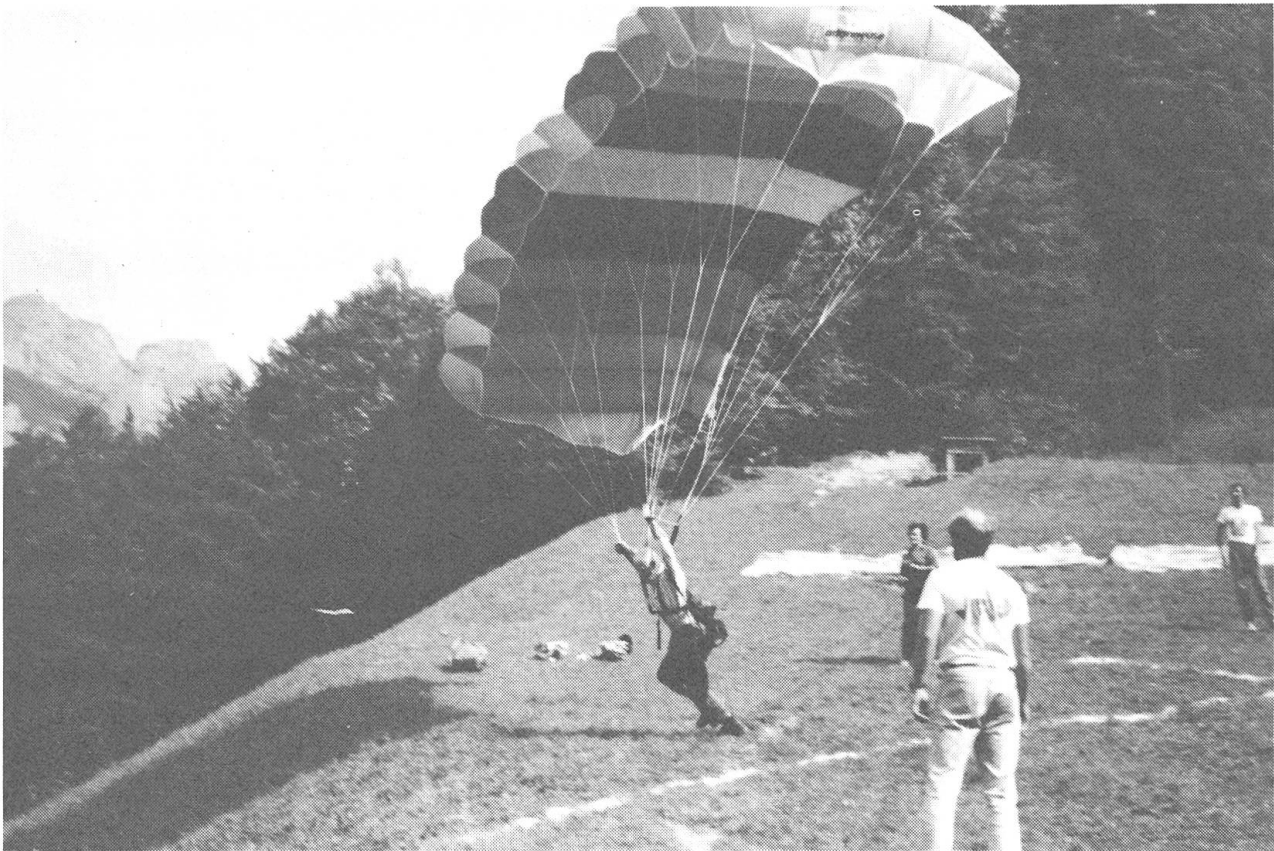
Der Fallschirm mit seinen Luftkammern sieht wirklich wie eine Matratze aus. Der Instruktor erteilt die letzten Anweisungen.

Wichtig um Flugschüler auszubilden ist die Wahl des Übungsgeländes. Der Trainingshang beim Skilift Winkel in Engelberg bietet für Erstflüge das optimale Gelände. Die auszubildenden Gleitschirmpiloten stehen zu-