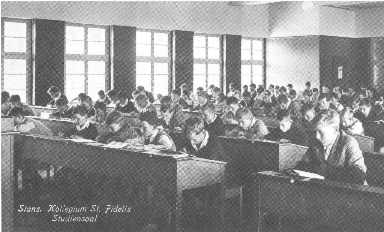
Welch brave Studentlein und keiner schaut auf, trotzdem der Fotograf im Saal steht.