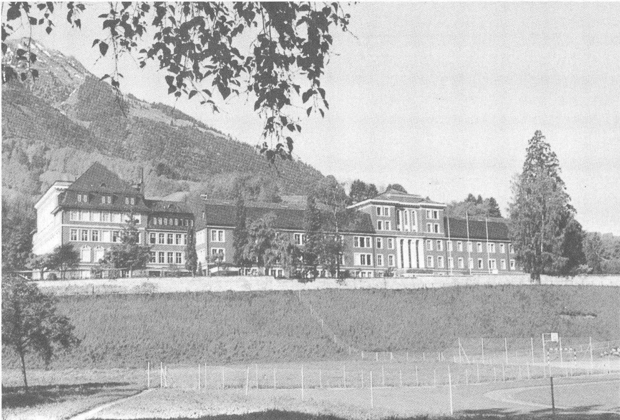
So präsentierte sich das «rote» Haus nach dem Umbau mit den neuen Wohngemeinschaften.