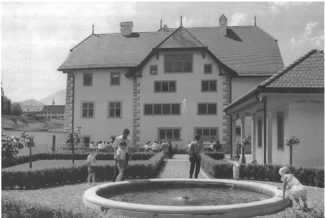
Winkelriedhaus von Osten. Der Mittelteil der Fassade unter dem gewalmten Giebel deckt den Urbau ab, ein Fachwerkhaus, das um 1456/57 errichtet wurde. Der Barockgarten wurde nach vergleichbaren Vorbildern rekonstruiert.