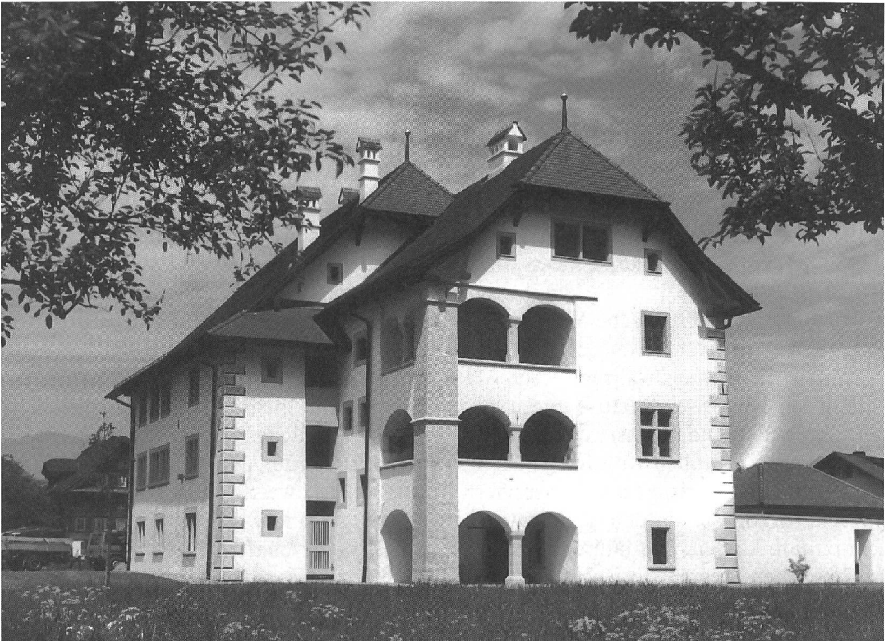
Winkelriedhaus von der Südseite her gesehen mit zwei übereinanderliegenden Loggien, die den Einfluss der italienischen Renaissance zeigen und im Anbau aus dem Jahr 1578/79 stammen.

die Gegenwartskünste, das zeitgenössische Schaffen vorstellen. So wirkt unser Museum für Kunst wie das Salz in der Suppe: dem einen ist's bekömmlich, dem andern zu scharf – keinem soll's gleichgültig sein! Mit einem Minimum an Aufwand wurde das Salzmagazin provisorisch hergerichtet. Das Parterre mit der hübschen Treppe, die schöne Halle im ersten Obergeschoss mit den Bogennischen, der alten Balkendecke und dem wärschaften Holzboden haben bereits viele Kunstfreunde begeistert. Notwendig sind eine Dachsanierung und der Einbau einer Heizung. Auch möchten wir im zweiten Obergeschoss zusätzliche Ausstellungsflächen gewinnen.