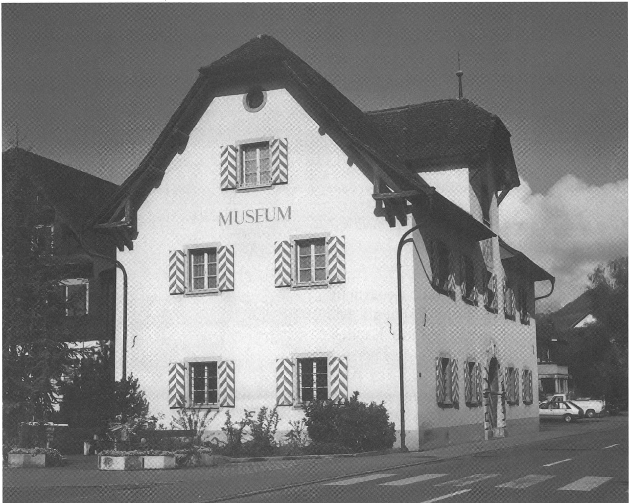
Das ehemalige Salzmagazin wurde als Lagerhaus für Korn und Salz um 1700 an der Stansstaderstrasse errichtet und hat sein äusseres Erscheinungsbild kaum verändert. Es beherbergt heute wechselnde Ausstellungen zu Kunst vorwiegend des 20. Jahrhunderts.

Die Festung wurde im Zweiten Weltkrieg angelegt und hatte die Einfallachse nach