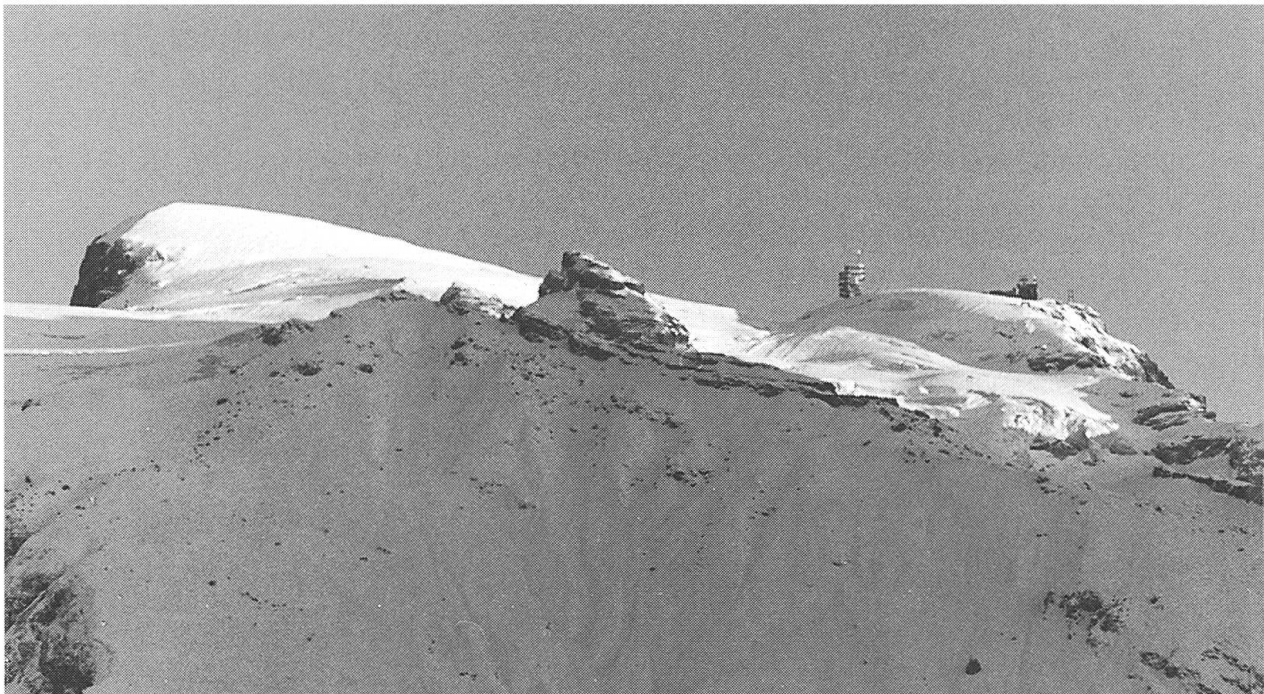
Abendstimmung am Titlis