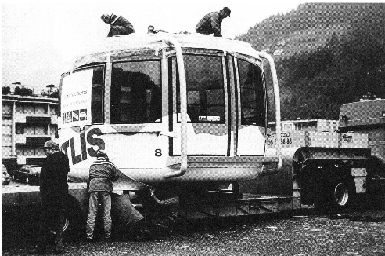
Am 3. November 1992 trafen die knapp 4 Tonnen schweren Drehkabinen in Engelberg ein, wo sie mit dem grössten Heli zum Stand geflogen wurden.