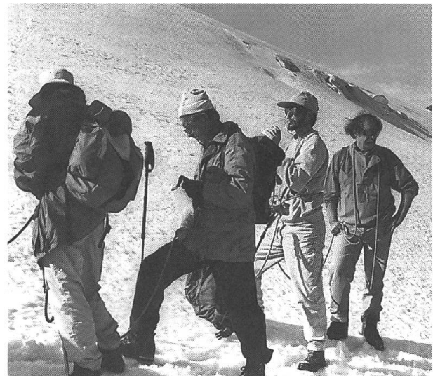
Letzte Rast vor dem Gipfelsturm

«Gratuliere, super...» Alle waren sich auf dem Titlisgipfel an diesem Samstag vormittag einig: Das frühe Aufstehen hatte sich gelohnt. Es war eine herrliche Sache, und auch wenn ein leichter Dunstschleier die Aussicht ein wenig trübte, man genoss sichtlich das impo-