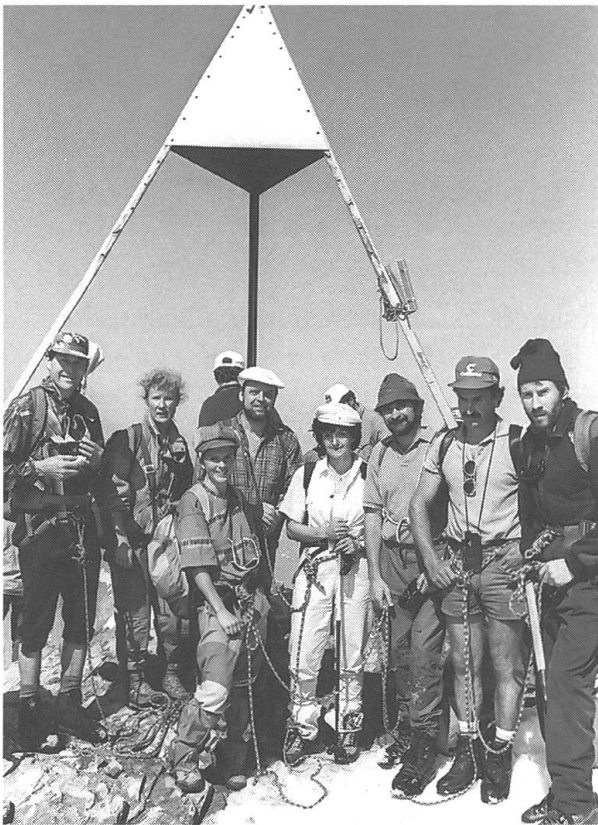
Der Titlis ist auch so etwas wie der Wolfenschiesser Hausberg. Kein Wunder also, dass auch Wolfenschiesser an der Jubiläumstour mit von der Partie waren.