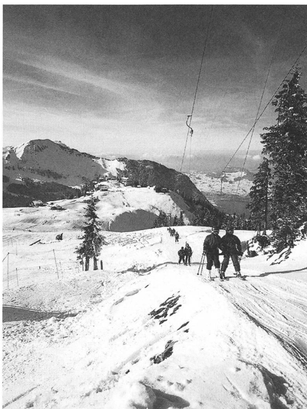
Juhui, juhee, auf Klewen im Schnee!

Junior und Klewenstock» liest, konnten sich damals viele das wahre Ausmass dieser Übernahme gar nicht vorstellen. In Tat und Wahrheit heisst dies nichts anderes, als dass man auf der Klewenalp die Zeichen der Zeit erkannte und nun «am selben Seil in die gleiche Richtung zieht».