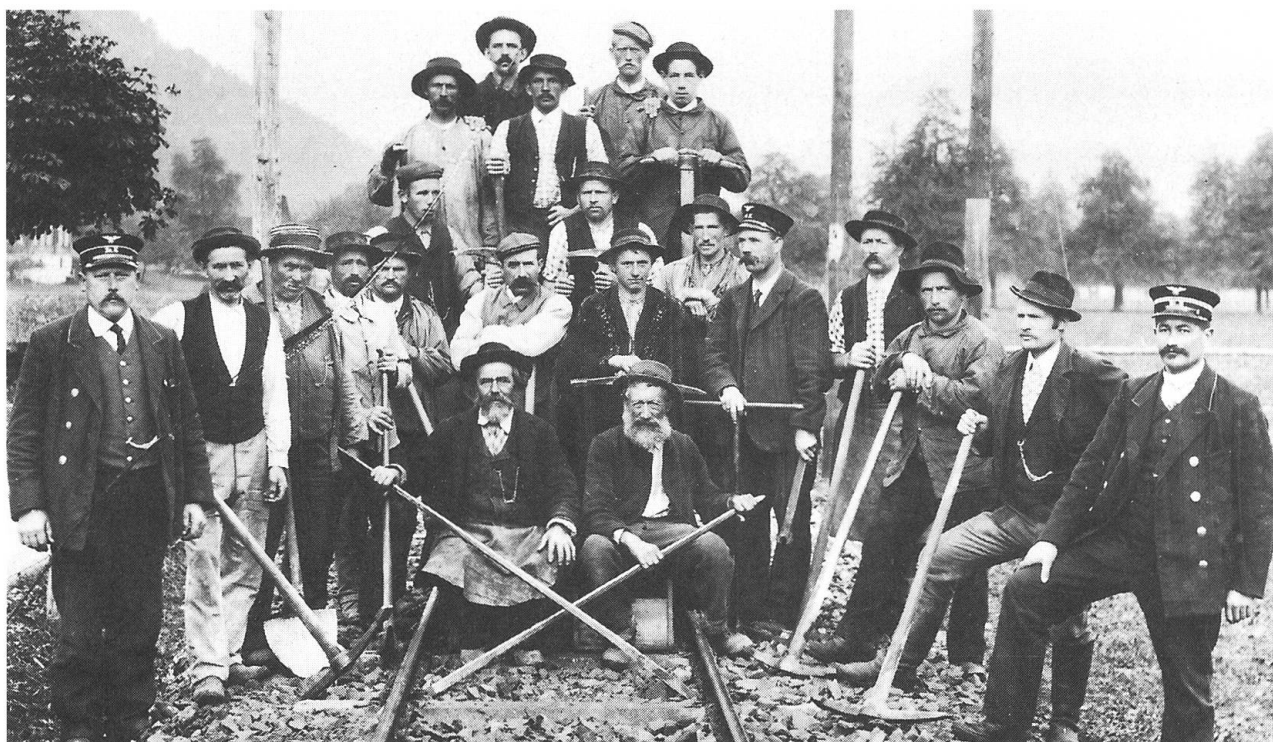
Die «Gramper-Gruppe», als diese harte Arbeit noch ausschliesslich von Hand gemacht werden musste. (Aus dem Buch: Schlüssel zum Tor der Welt)