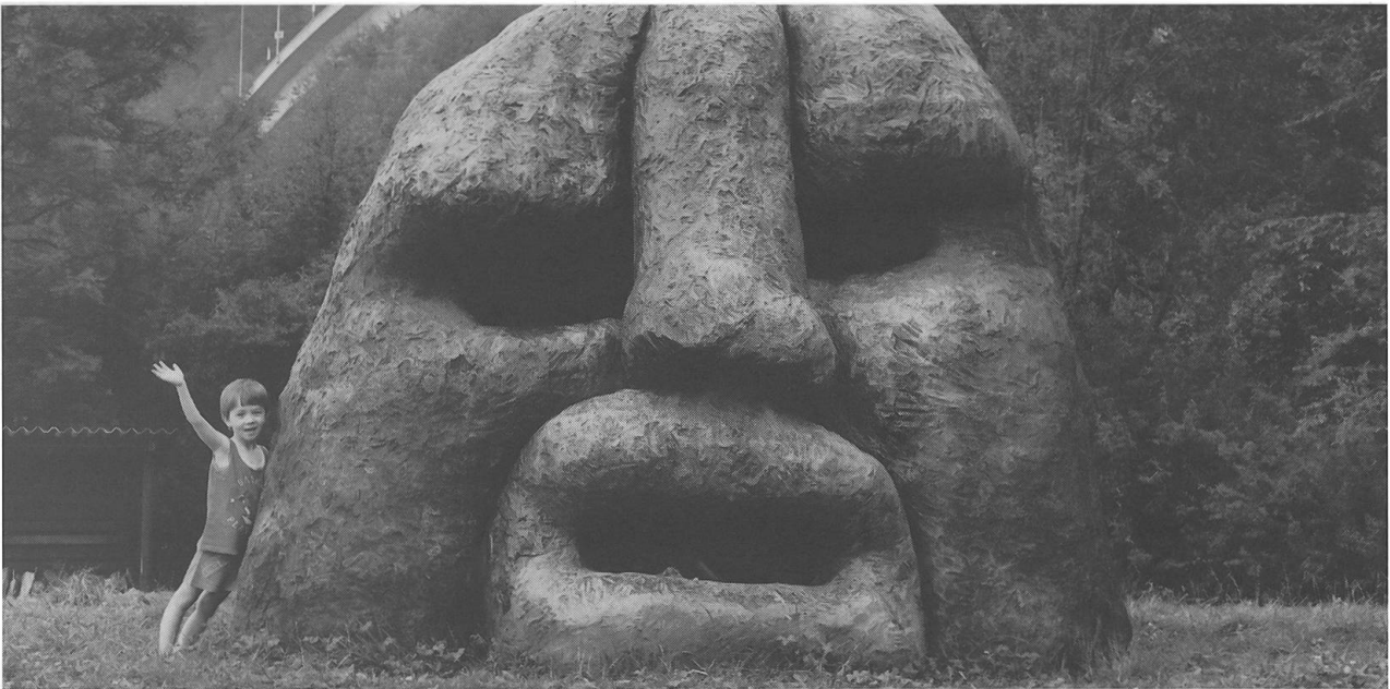
«Ubinas» ist ein aktiver Vulkan in Peru. Der riesige Bronze-Kopf in Rütene Beckenried, trägt seinen Namen. Wie durch eine gewaltige Kraft gestossen, durchbricht dieser die Erdoberfläche. Sein Blick ist über den See nach Westen gegen Sonnenuntergang gerichtet. Er steht hier als Metapher für Geburt, für Potenz und Kraft, die im Menschen und in der Erde ruhen. Gleichzeitig ist er in seinem Zurücksinken in die Erde auch Zeichen für Auflösung, Rückkehr, Tod. «Ubinas» von Rolf Blättler-Amici (*1941), Höhe 330 cm, Breite 300 cm, Tiefe 180 cm.