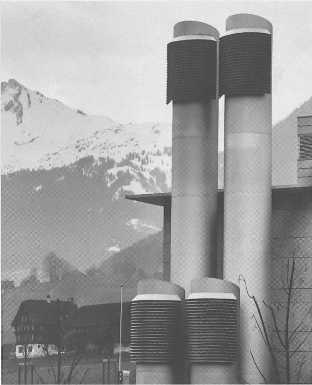
Die grossen Trompeten am Kantonsspital in Stans zeigen seit 1997, dass man absolut Notwendiges wohlgestaltet darstellen kann.