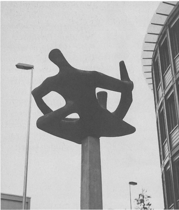
Bei der Post Stans steht seit 1972 die Plastik «Gedankenflug», die Hans von Matt (1899–1985) entworfen hat. Am 7. Mai dieses Jahres hätte dieser vielseitige Künstler, Literat, Botaniker und Geschichtsschreiber des Unüberwindlichen Grossen Rates, seinen 100. Geburtstag feiern können.