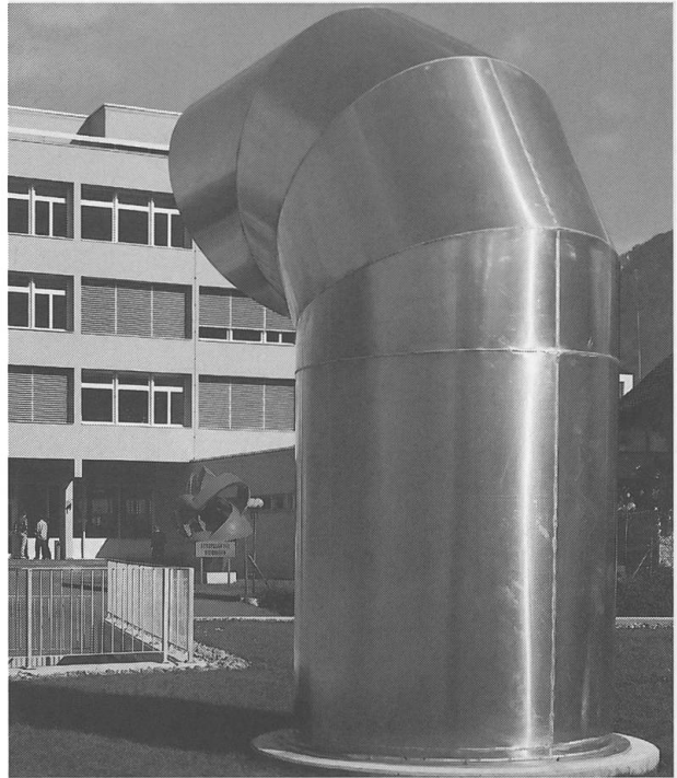
Zwischen Tiefgarage/Berufsschulhaus steht seit 1998 dieses Zuluftrohr, das ein «Denk-ein-mal» für unsere Umwelt sein könnte. Nützlichkeit kann auch hübsch gestaltet werden.