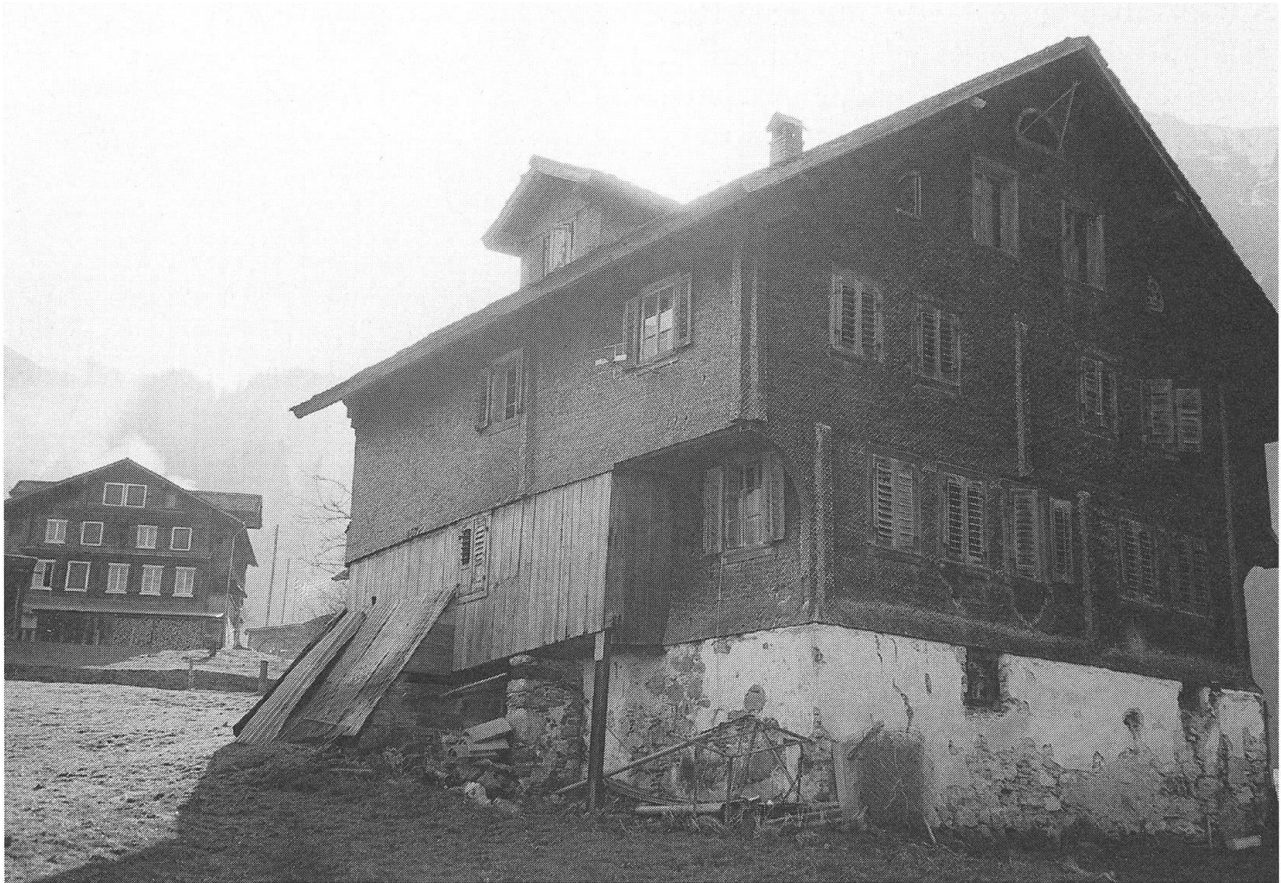
Bauernhaus Unterfell. Zustand vor der Restaurierung.

ter vergrössert, die Vorderseite des Hauses mit Rundschindeln beschlagen. Heute gehört die Liegenschaft der Familie Durrer-Waldis.