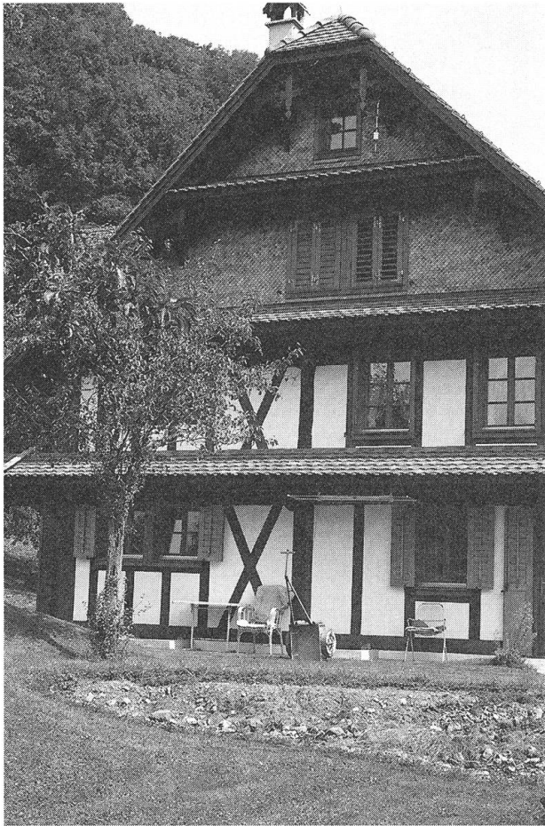
Bauernhaus Lochmatt (Josef Niederberger, Holzbau, Büren).

1900 stammt. Ebenso aus der Bauzeit, die vornehmen Nussbaumtüren mit barocken Beschlägen.