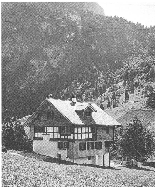
Bauernhaus Unterfell: Zustand nach der Restaurierung (Alois Britschgi, Holzbau AG, Sachseln).

Die unverfälschte Erhaltung und Restaurierung des Bauernhauses Unterfell in Oberrickenbach ist von grosser Bedeutung, als es sich hier um ein völlig intaktes, durch keinerlei spätere Eingriffe verändertes Bauwerk aus dem Jahr 1793 handelt, das auch im Innern über die gesamte originale Ausstattung aus der Bauzeit verfügt. Das Haus trägt alle charakteristischen Züge des spätbarocken Steilgiebeldachhauses und weist in der Kombination von Block- und Riegelkonstruktion eine im Kanton Nidwalden wenig verbreitete Mischbauweise auf. Das Haus verfügt im Keller noch über die alte Feuerstelle, die der Käseherstellung diente.