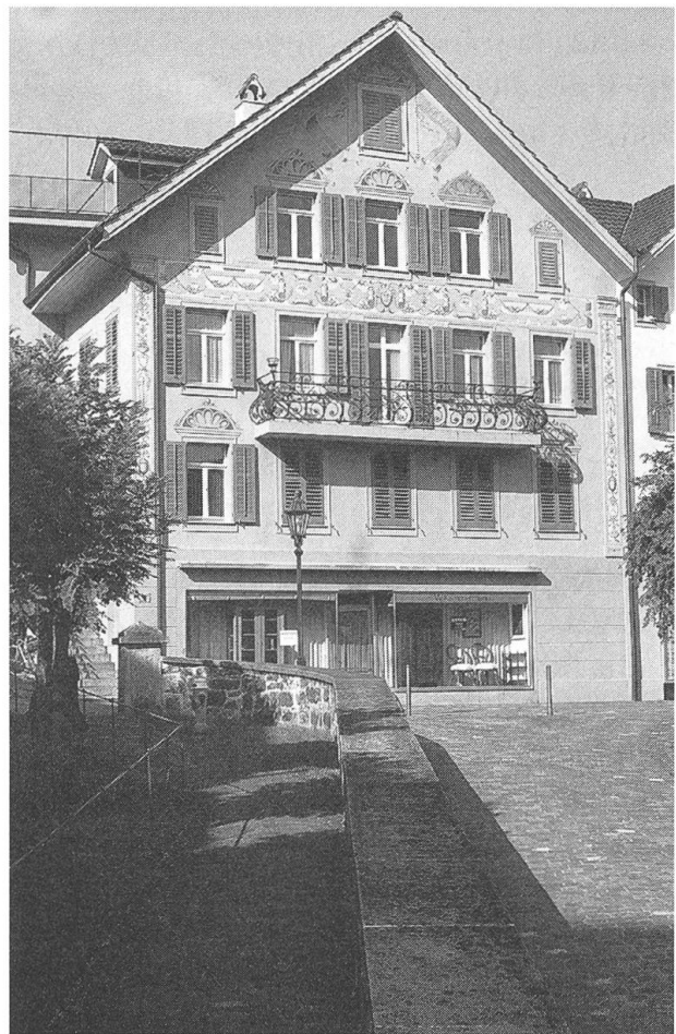
Haus Nägeligasse 3: Aussenansicht mit der erneuerten Fassadenmalerei (Jörg Feierabend, Architekt, Stans)

Um 1720 wurde der Vorgängerbau errichtet, der bis in das ausgehende 19. Jahrhundert als Gasthaus «Oberer Adler» diente. 1725 sind Josef Waser und 1733 vermutlich Viktor Ferdinand Hermann als Besitzer der Liegenschaft nachgewiesen. 1848 erwarb Caspar von Matt das zweite Obergeschoss. Am 31. Mai 1892 brannte das damals im Besitz der Familie Waser befindliche Gebäude nieder und wurde in der Folge über den erhaltenen Resten neu errichtet. 1897 war die Schuhhandlung des