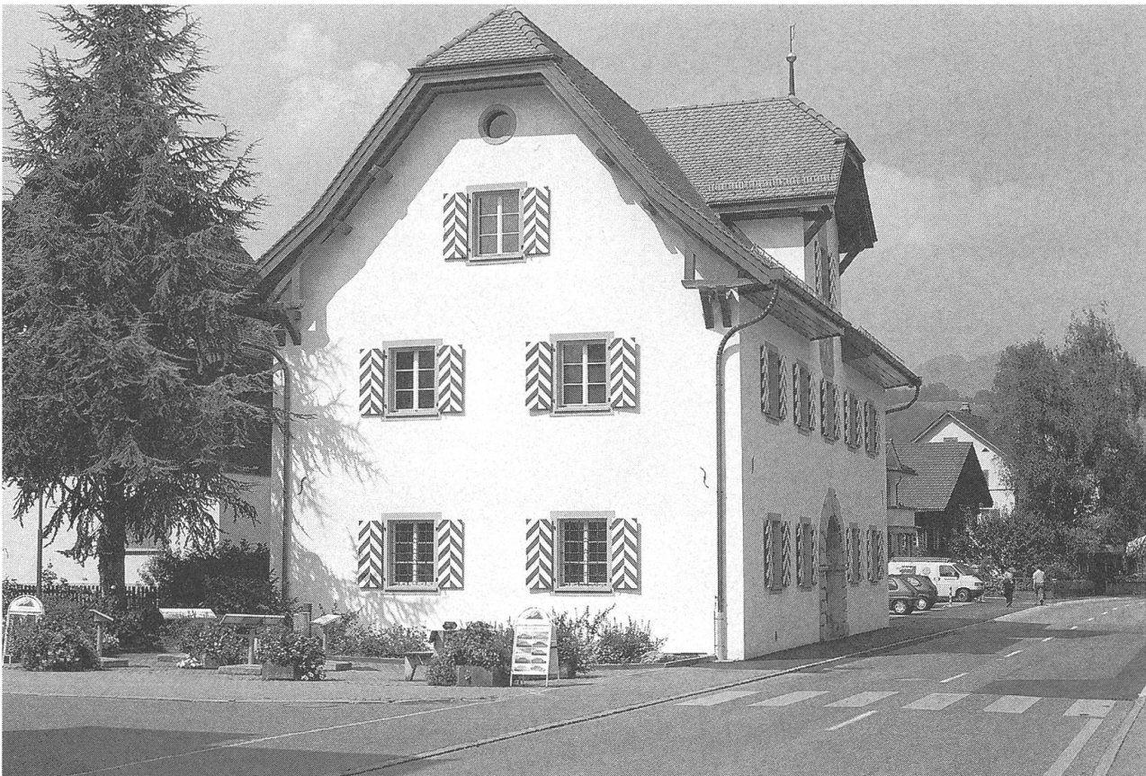
Ehemaliges Salzmagazin, heute Museum für Kunst. Aussenansicht von Nordosten.

Am 23. September 1699 beschloss der Landrat den Bau eines Salz- und Kornmagazins: Der freistehende und verputzte Steinbau wurde 1700/1701 aufgrund finanzieller Probleme und verspäteter Materiallieferungen unter Schwierigkeiten errichtet. Im Giebelfeld des nördlichen Zwerchhauses ist das Wappen des Bauherrn mit der Inschrift «HER HR NICOLAUS KEISER GEWESENER OBER-