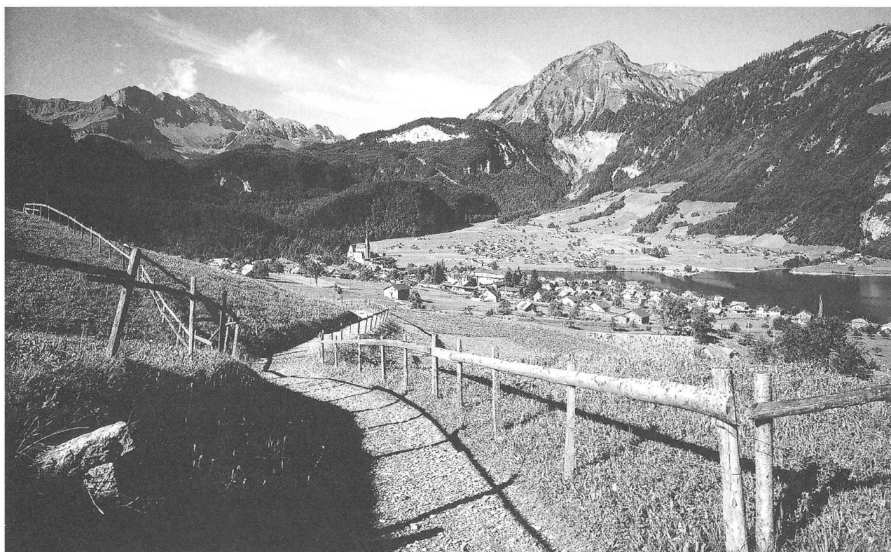
Föhnstimmung über Lungern.