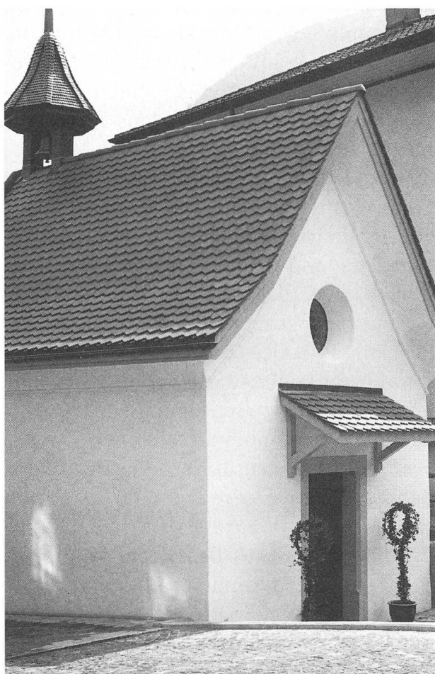
Ehemaliges Beinhaus, heute Kapelle Maria zum Guten Rat. Aussenansicht von Nordosten (Hans Reinhard, dipl. Architekt ETH/SIA, Stans).

Die eigentlichen Restaurierungsmassnahmen umfassten die vollständige Instandstellung des Daches mit neuer Ziegelbe-