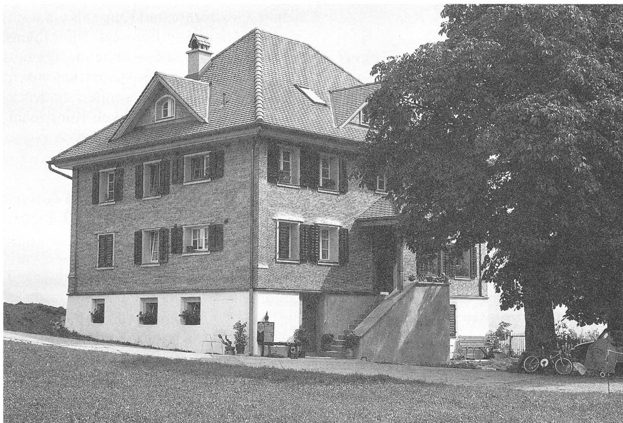
Vorder Rotzberg: Herrenhaus-Heimet. Aussenansicht von Südwesten.

Nicht nur die Schadhaftheit des Bauwerks, sondern auch der Umstand, dass für die weitere Nutzung das Haus in zwei unabhängig voneinander erschliessbare Wohnungen unterteilt werden musste, führte zu einer umfassenden Gesamtrestaurierung des Hauses. Trotz diesen Anforderungen gelang es die innere Raumstruktur im vorderen Teil des Hauses ganz und im hinteren weitgehend in ursprünglichem Zustand zu erhalten. Notwendige Veränderungen ergaben sich im Bereich der Küche und der Nasszellen. Ebenso wurde der Dachstock zu Wohnzwecken ausgebaut. Das bislang nicht isolierte und