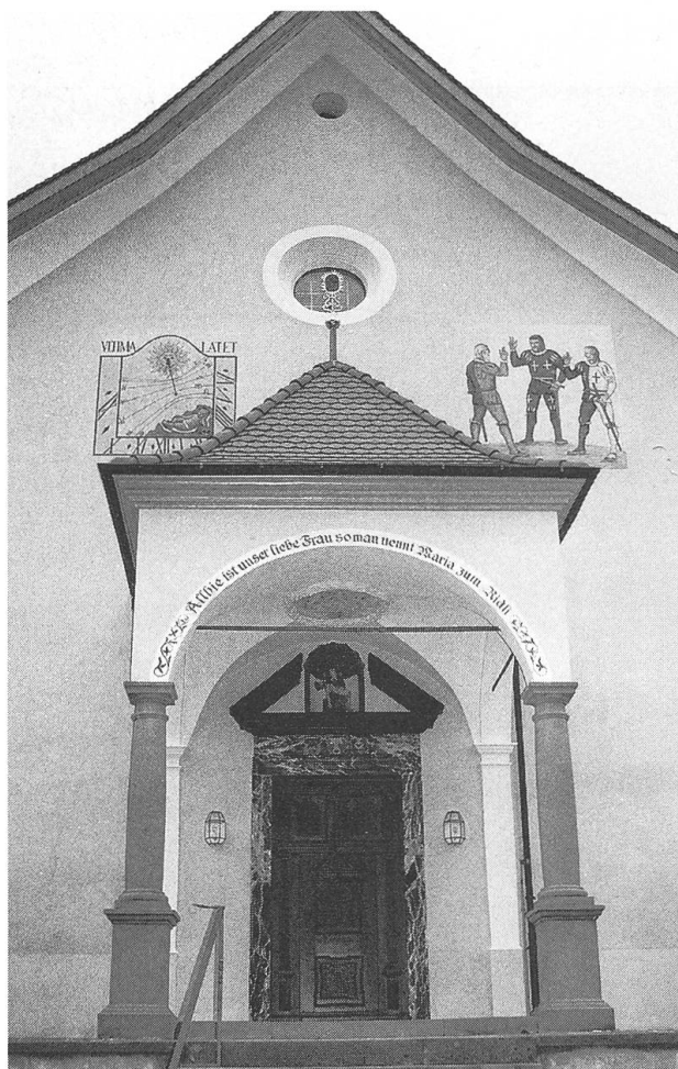
Ridlikapelle: Hauptportal mit erneuerter Malerei.

Die Anfänge der Beckenrieder Wallfahrtsstätte zur Maria vom Ridli sind nicht aktenkundig. Erstmals ist das Ridli 1605 als «gnadenreiche Statt und Mirackel» für Menschen in Seenot und bei Bergwasser-gefahren bezeugt. 1615 soll die bereits bestehende Kapelle vergrössert werden, was auf einen Vorgängerbau vielleicht aus dem 16. Jahrhundert schliessen lässt. Ob die Kirche kurz nach 1615 neu erbaut oder nur vergrössert wurde, ist ebenso ungewiss wie ihr Standort. 1691 beschliessen die Kirchgenossen von Beckenried erneut eine Vergrösserung der Kapelle. Diskussionen um den neuen Standort der Kapelle endeten erst 1700 unter Vermittlung des Landammanns Lussy und des Stadthalters Achermann. Am 4. Januar 1700 befiehlt der Wochenrat den Uertnern (Burger), den Bau auf Hans Heinrich Ganders Rain in Angriff zu nehmen. Am 20. Oktober 1701 wurden die neue Kapelle und die drei Altäre durch den Konstanzer Weihbischof Konrad Ferdinand Gaist eingeweiht: die Kapelle und der Hochaltar zu Ehren der Gottesmutter Maria, die beiden Seitenaltäre zu Ehren des heiligen Antonius Abbas, des heiligen Wendelin und des heiligen Josef. Am 21. November des gleichen Jahres fand die feierliche Translation des Gnadenbilds von der alten in die neue Kapelle statt. Die Kapelle beherbergt neben Rickenbach die grösste Sammlung von Votivtafeln, deren ältestes 1703 datiert ist.