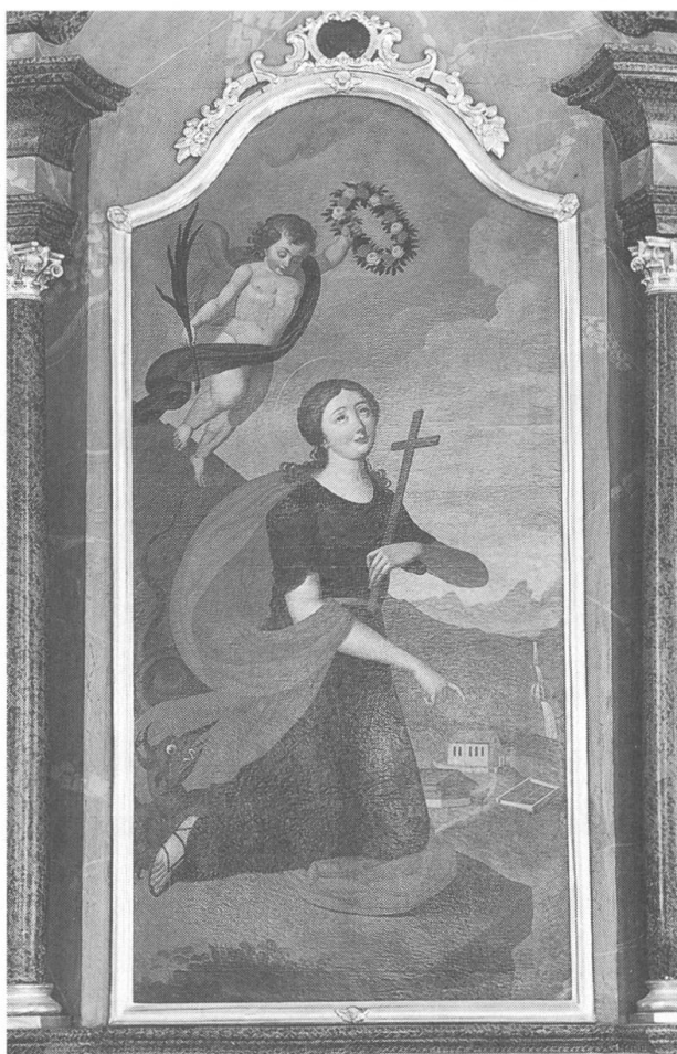
Das Seitenaltarbild der Kirche von Oberrickenbach mit der hl. Margareta, die das Kreuz in der Hand hält und beschützend auf das Dorf zeigt.

Augen der Gläubigen nicht aus einem ganz gewöhnlichen Stück Holz bestehen. Als Adam im Sterben lag, so wird berichtet, lief sein Sohn Seth über Berge und Täler und schrie laut zu Gott. Dieser schickte ihm einen Engel mit einem Zweig vom Paradiesbaum, dem Baum der Erkenntnis und des Todes, mit dem Auftrag, ihn zu pflanzen, denn seine Frucht würde