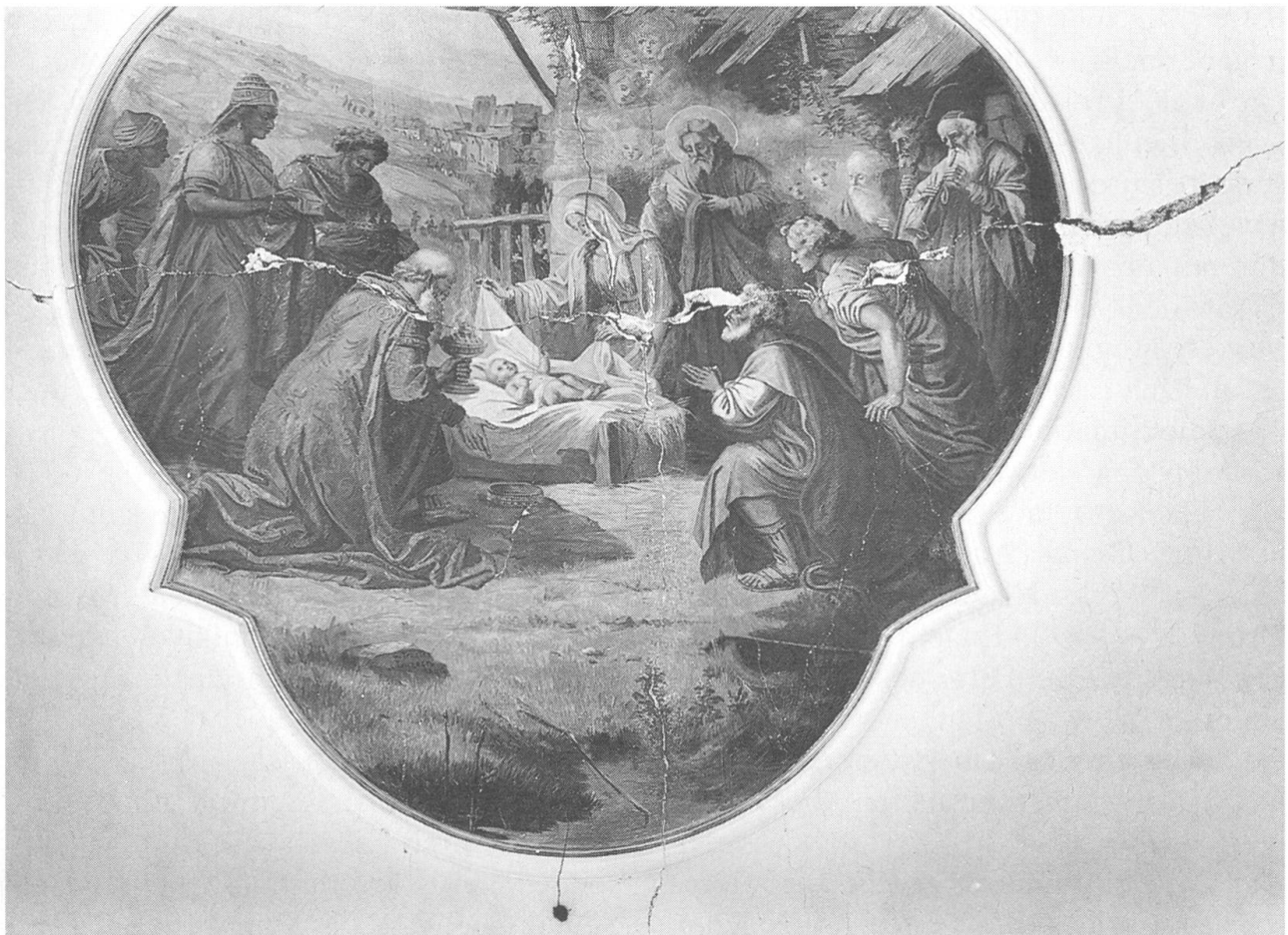
Längs- und Querrisse durch die Weihnachtsdarstellung an der Decke der Klosterkirche St. Andreas in Sarnen nach dem Erdbeben von 1964.

dem Hauptaltar Stücke des Deckengewölbes gelöst hatten. Im 19. Jahrhundert hebt die oben erwähnte «Nidwaldner Chronik» zwei Erdbeben besonders hervor. Am 25. Juli 1855, um 1 Uhr mittags, erschütterten heftige Stöße den ganzen Kanton. Ich nehme an, dass es ein Sonntag war, denn in Ennetmoos versammelten sich die Gläubigen zum Nachmittagsgottesdienst, als ein Getöse anhub, die Betstühle wankten, die Fenster klirrten, das Altargemälde sich bewegte. Stark waren die Erschütterungen auch auf den Bergen, vor allem auf Kernalp. Sie richteten im Wallis grosse Schäden an, verursachten aber auch in der Jesuitenkirche Luzern, wo die Bilder von den Wänden herunterfielen, Risse im Ge-