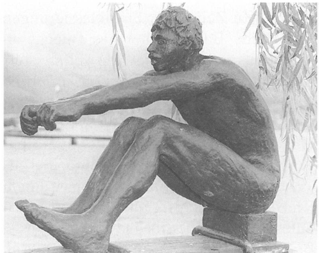
Bronze-Plastik auf dem Bootsplatz des Seeclubs Stansstad