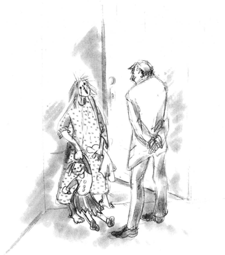
Eine fehlende Mutter, ein weinendes Mädchen und ein besorgter, unsicherer fremder Mann.