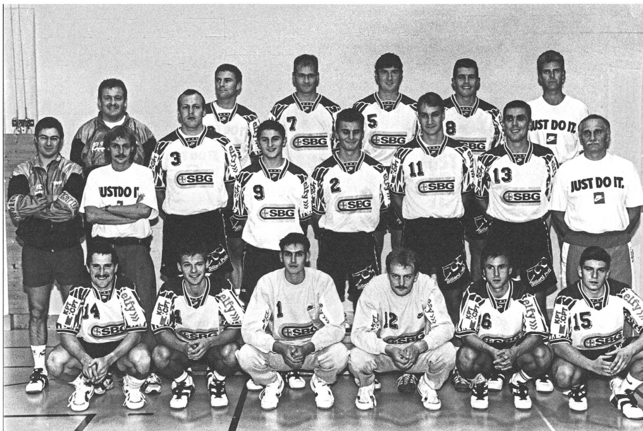
Die 1. Mannschaft NLA in der Saison 95/96.

doch sie in den allermeisten Fällen gegen Clubs, deren Budget dasjenige der Stanser um ein Mehrfaches überstieg. Einzig in Sachen Zuschauer gehörte der BSV Stans immer zu den absoluten Spitzenreitern. Angesichts solcher unterschiedlicher Voraussetzungen erstaunt es nicht, dass der BSV meist in die Knochenmühle der Auf-/Abstiegsrunde verbannt wurde, wo er dann den NLB-Gegnern in Sachen Rhythmus und Cleverness überlegen war.