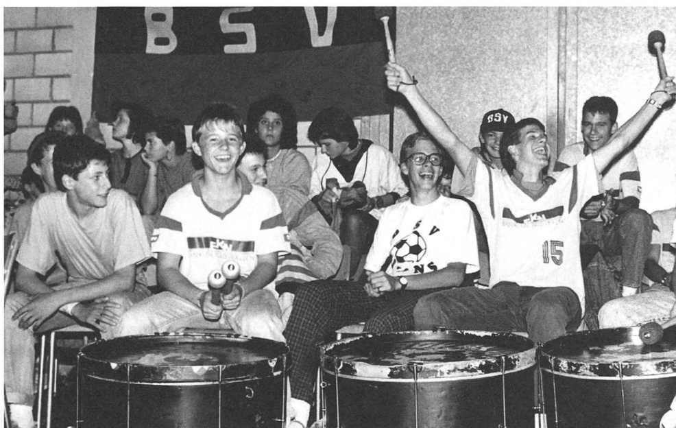
Der BSV wird schweizweit um seine Fangemeinde beneidet, die seit Jahren mit Tricheln und Pauken aufkreuzt.