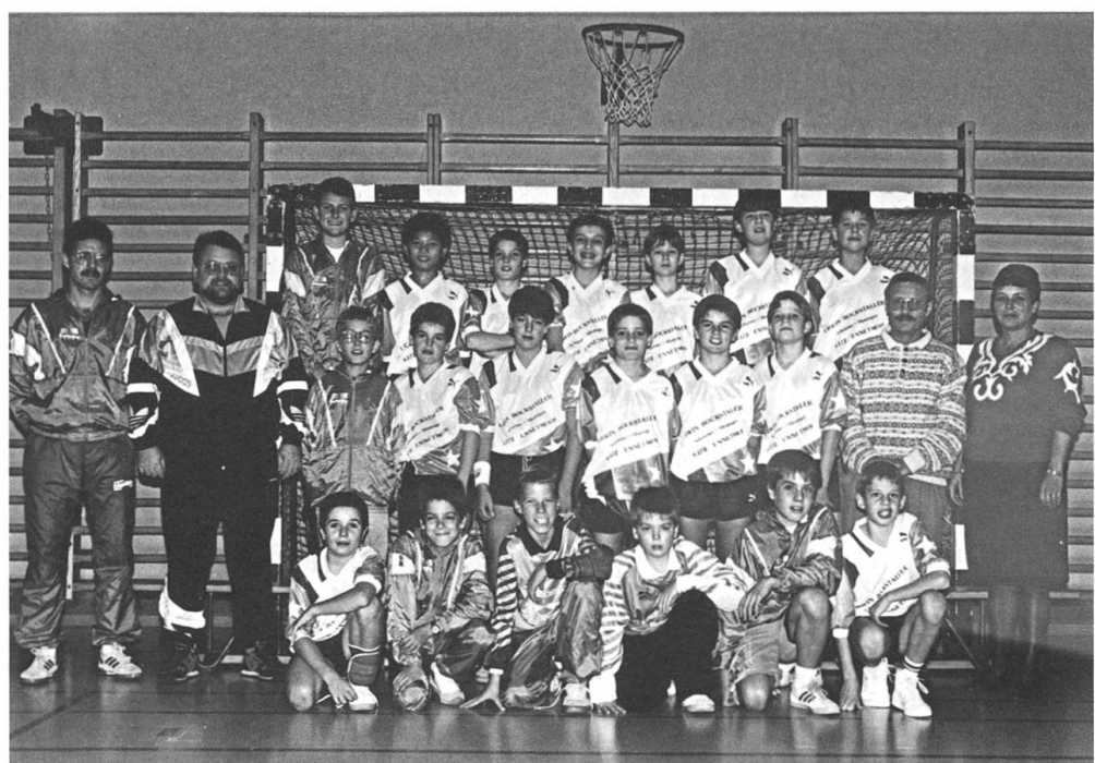
Jugendarbeit ist ein Marken- zeichen des BSV. Hier stell- vertretend für die zahlreichen Junioren- und Juniorinnen- Mannschaften: die Junioren D von 1991/92.

In der Folge etablierten sich die Nidwaldner Handballer für beinahe zehn Jahre in der nationalen Spitze und verteidigten ihre Zugehörigkeit zur NLA zäh. Einfach war dies keineswegs, kämpften