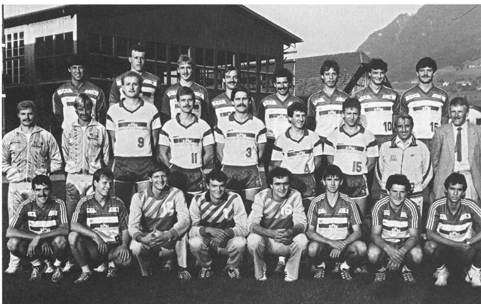
1986 Aufstieg in die Nationalliga B.