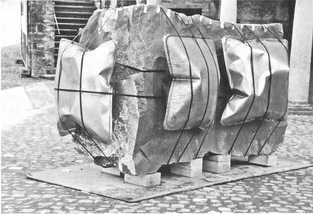
Christoph Scheubers Installation «Autoprotect» auf dem Dorfplatz Stans