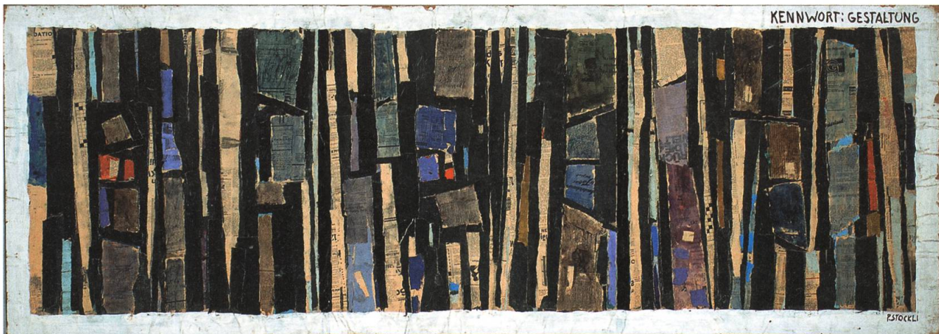
Entwurf zu einem Glasfenster.