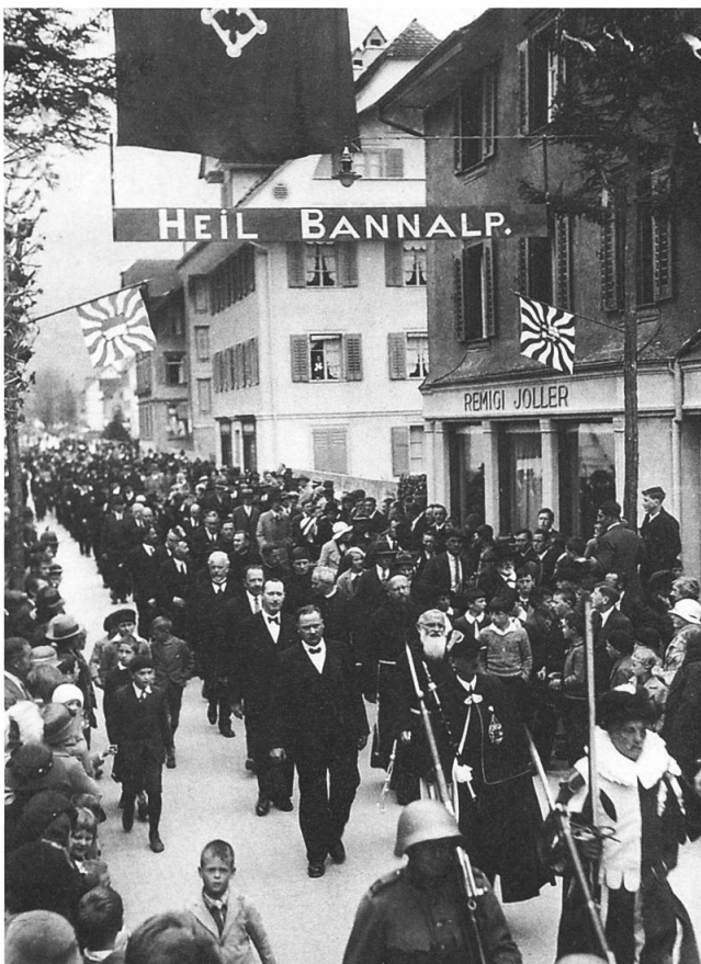
Einzug in Stans nach der Landsgemeinde 1935.