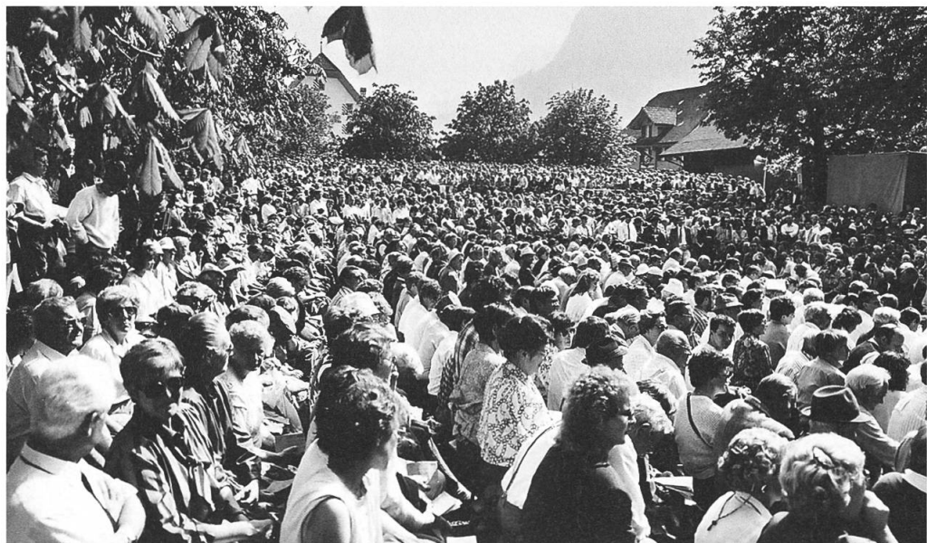
Erste Landsgemeinde mit Frauen 1973.

Ohne grossen Widerhall stellte ein altväterisch Gesinnter den Verwerfungsantrag. «Nun sei genug Heu unten!» Die Landsgemeinde sei ein Vatertag, wer denn überhaupt noch kochen solle?