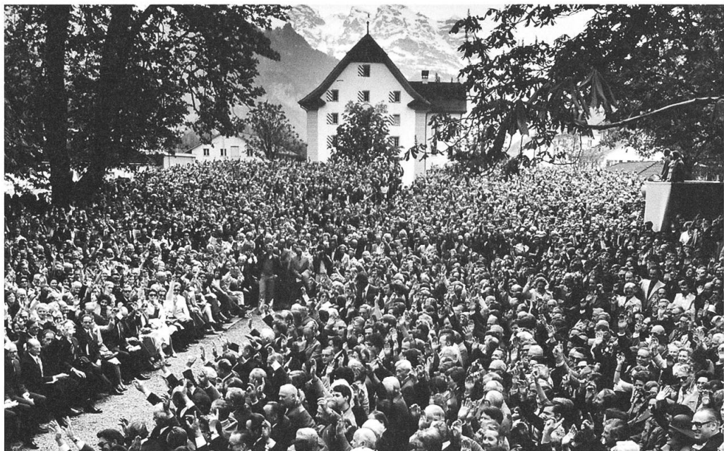
Der übervolle Ring zu Wil an der Aa.

Trotz all dieser Erleichterungen besteht auch heute kein Grund, über die Stimmbeteiligung in Euphorie auszubrechen. Das neue System verbreitet eigentlich nur Trockenheit und Nüchternheit, eine feiertägliche Stimmung kann dabei nicht aufkommen.