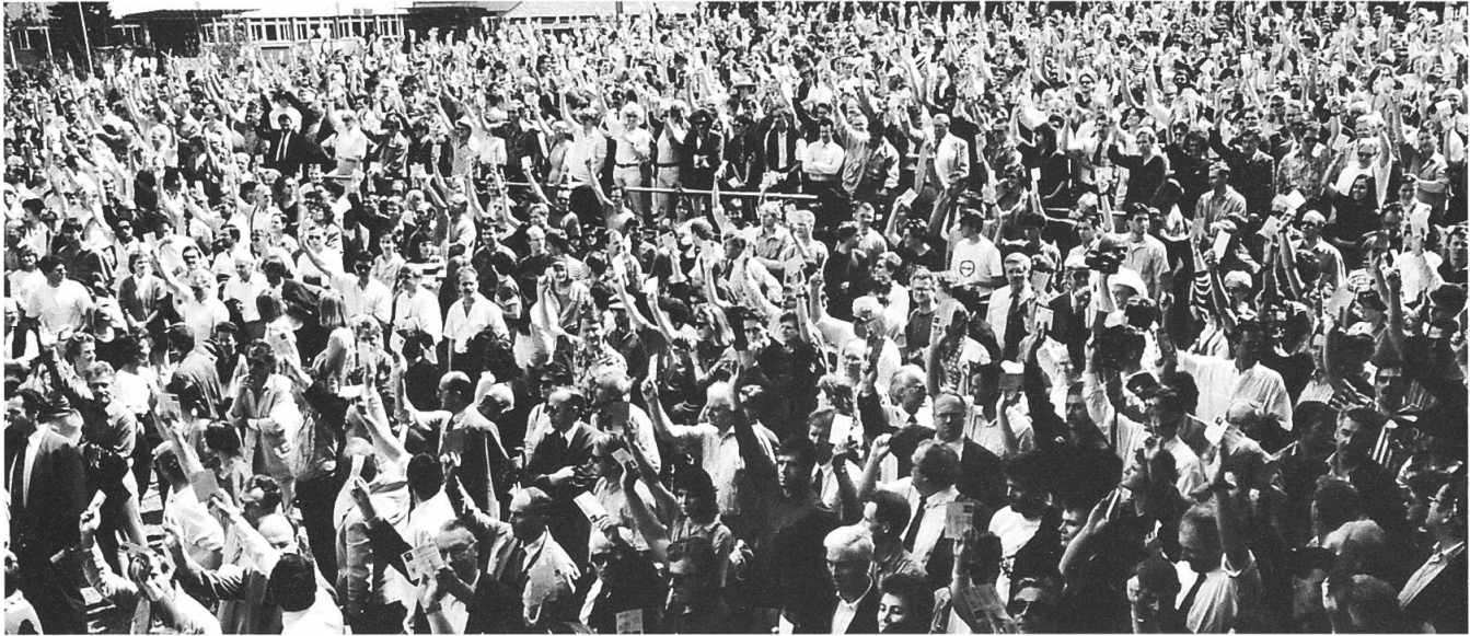
Voller Ring in einer Abstimmung.