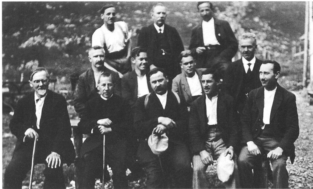
Initianten von 1930 (Bannalpwerk).

Das Initiativkomitee liess sich nicht entmutigen und verfasste eine sechszehnteilige Informationsbroschüre unter dem Titel: «Der Freiheit eine Gasse!» und der damalige Redaktor des «Nidwaldner Volksblattes» Kaplan Konstantin Vokinger legte in einem Leitartikel nochmals die Vorzüge einer Eigenversorgung dar und vergass auch nicht zu erwähnen, wie viel die Stadt Luzern jährlich mit unserem Wasser verdiene und wie wenig sie dafür bezahlen müsse. Broschüre und Leitartikel überzeugten noch viele Bürger, die dieser Sache bisher noch abwartend gegenüberstanden. Die Landsgemeinde vom 30.4.1933 hatte einen ungewöhnlich grossen Zulauf. Gleich zu Beginn, bei der Landammann Wahl versuchte einer aus dem Volke, das übliche Prozedere zu stören, indem er einen Gegenvorschlag machte. Landrat Werner Christen beeilte sich zu sagen, dass dieser Vorschlag nicht etwa vom Initiativkomitee aus komme, sie seien nicht hierher gekommen um zu streiten, sondern um sich nach Schluss der offiziellen Landsgemeinde zum Wort zu melden. Nachdem noch ein Volksredner, zur Regierungsbank gewendet, sagte: «Ihr seid nur unsere Knechte, und wir stellen euch noch einmal für ein Jahr ein. Und dann schauen wir dann wieder!» konnte die Landsgemeinde einen normal ruhigen Verlauf nehmen.