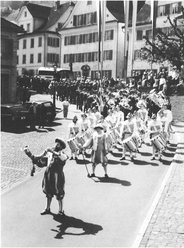
Anmarsch vom Stanser Rathaus zur Landsgemeinde.

Danach lief der Stanser Gemeindegewalt vor dem Gericht her, der Standesläufer – auch er in rotweissem Mantel und schwarzem Zweispietz, beschloss den behördlichen Teil des Zuges. Den Schluss bildete das Volk, soweit es sich nicht schon am Landsgemeindeplatz eingefunden hatte.