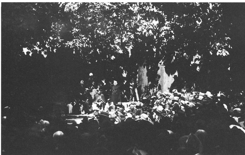
Die denkwürdige Landsgemeinde 1934 als das Bannalpwergesetz angenommen wurde.

Darauf hin kamen die Oberrickenbacher zu ihrer Strasse und die Tanzfreudigen zu mehr Gelegenheiten, ihre Schuhe durchzuwetzen. Aber die Ennetbürger, die eine möglichst gerade Strasse wollten, wurden mit der hohen Strassenkommission nicht einig. Die meinte nämlich, «eine Schwenkung mehr oder weniger schade den Bürgern nicht!» Es kam sogar dazu, dass sich zwei inzwischen zurückgetretene Ratsherren und ein Neuer zu einem Bund vereinigten um zu demonstrieren, es sei die Zustimmung zum Strassenprojekt «am Ennetbürgen» vom 12. Mai 1867 eine Dummheit gewesen ... Gegen diese Eingabe kämpften an der Nachgemeinde vom 8. Mai 1870 auch die Regierungsräte, die drei Jahre vorher noch gegen die Strasse waren. Sie wollten einem