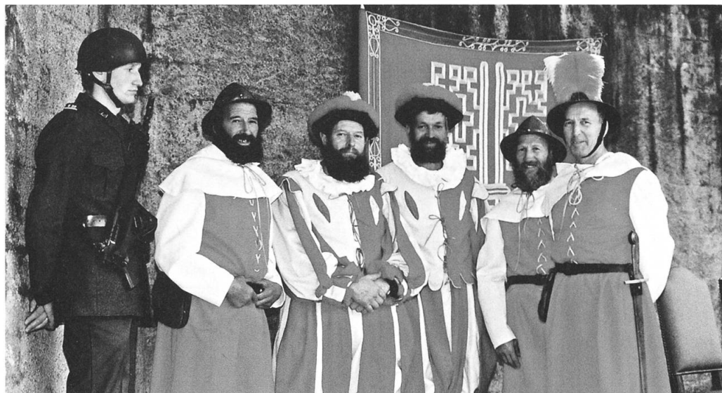
Gruppenbild mit Soldat und Landsknechten.

Auffallend gross war die Anzahl derjenigen, die sich der Stimme enthielten. Zur Feststellung der genauen Verhältnisse musste das Stimmvolk den Ring verlassen. Geerings Parteifreunde wurden auf der Ennerbergstrasse aufgestellt, Odermatts Anhänger sammelten sich auf der Engelbergerstrasse. Es war offensichtlich, dass sich wieder viele der Stimme enthielten und auf dem Vorplatz herumstanden oder sich in einer der beiden Gartenwirtschaften den Durst löschten. Das erstmals durch Drehkreuze ermittelte Resultat fiel recht knapp aus: 2843 Stimmen fielen auf Geering und deren 2442 auf Odermatt. Odermatts Parteigänger waren sich fast sicher, die vielen Stimmenthaltungen hätte es bei einer geheimen Abstimmung nicht gegeben und Odermatt wäre gewählt worden. Eine Ansicht, die viele teilten, die nicht unbedingt Anhänger des DN waren. Der nicht gerade glückliche Verlauf dieser Landsgemeinde verhalf den Abschaffungsbefürwortern vermutlich zu einem recht grossen Zulauf.