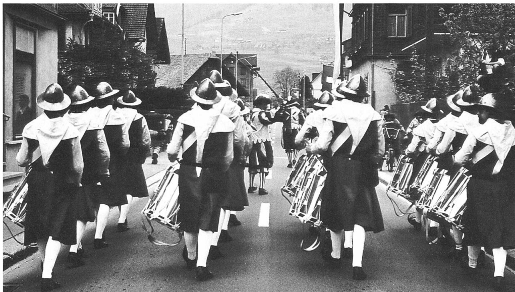
Der Harst der Tambouren in Landsknechtentracht.