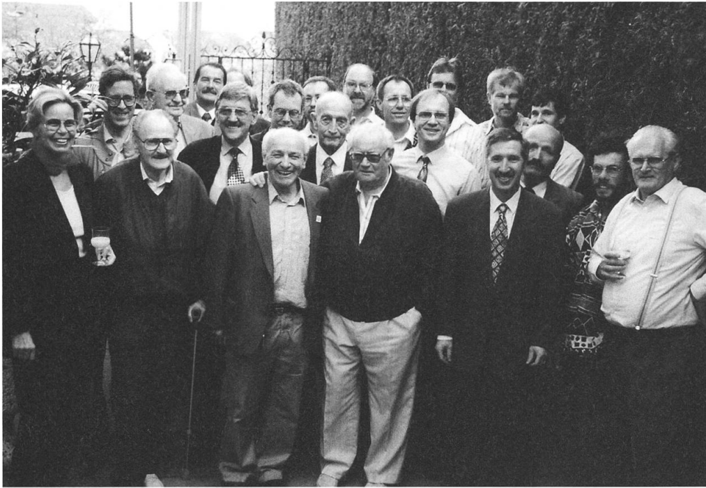
Der Schachklub Hergiswil feierte 1996 sein 50-jähriges Bestehen mit einem Jubiläumsfest und vielen ehemaligen Schachspielern.

erste Feld des Schachbretts ein Korn; auf das zweite Feld zwei Körner; auf das dritte Feld deren vier; auf das vierte acht Körner und so weiter. Der Herrscher war erbost, liess sich aber dann doch bewegen, diesen Wunsch zu erfüllen. Wie gross war sein Erstaunen, als nach einigen Tagen der Vorsteher seiner Kornkammer meldete, im ganzen Reich gäbe es nicht genug Weizen, um den Wunsch des Brahmanen zu erfüllen. In der Tat, um den Brahmanen gerecht zu werden, hätte es 18 Trillionen, 446 Billiarden, 744 Billionen, 73 Milliarden, 709 Millionen, 551 tausend und 615 Körner bedurft!