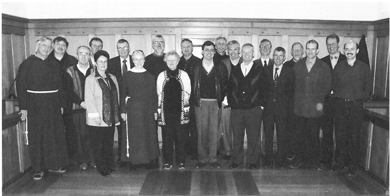
Die Gründungsmitglieder des «Verein Kapuzinerkirche Stans» (VKS) am 16. März 2004 im Inneren Chor der Kirche.

So liess die Initiativgruppe, mittlerweile von weiteren Persönlichkeiten aus Politik, Wirtschaft, Bildung, Kultur und Kirche unterstützt, die Statuten entwerfen und nach positiver Rückmeldung der Baudirektion diese als ideelle Grundlage für das Gründungskomitee zur Errichtung eines Vereins