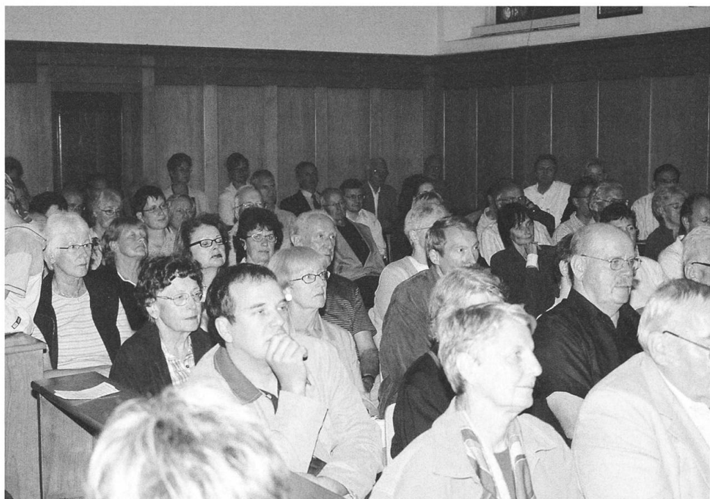
Aufmerksame Zuhörerschaft beim Vortrag im Inneren Chor.

Die vielen finanziellen Unterstützungen seitens der Mitglieder, Gönner und Freunde, der Landeskirche Nidwalden, der Reformierten Kirche Nidwalden, der katholischen Kirch- und Kapellgemeinden, der Schweizerischen Kapuzinerprovinz, des ehemaligen Patronatskomitees «Dank an die