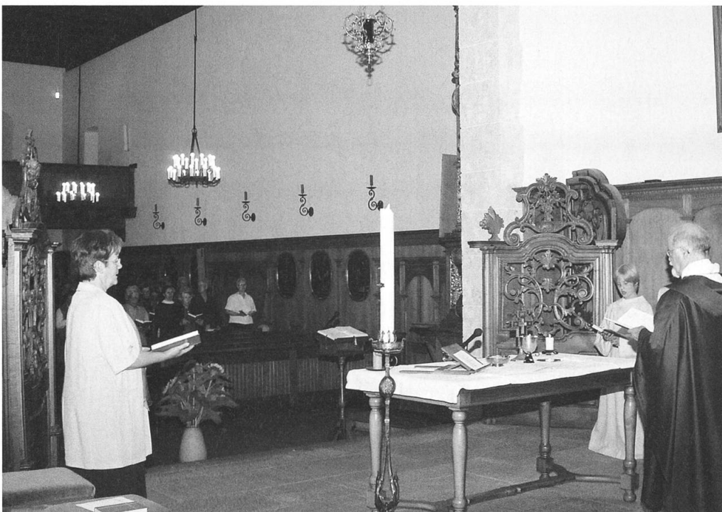
Liturgie im Altarraum.