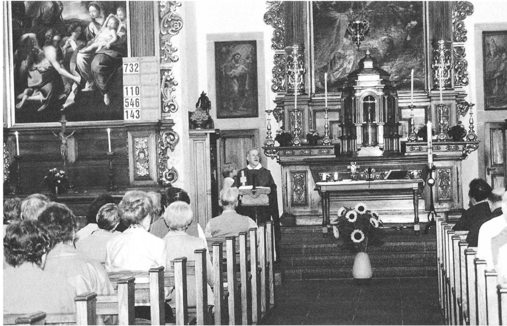
Messe im Kirchenschiff.