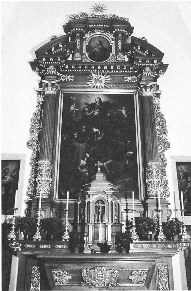
Der Hochaltar «Maria Himmelfahrt».