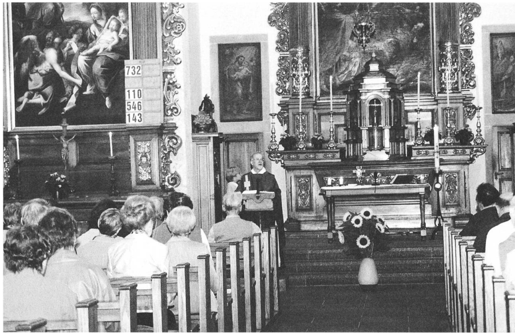
Messe im Kirchenschiff.