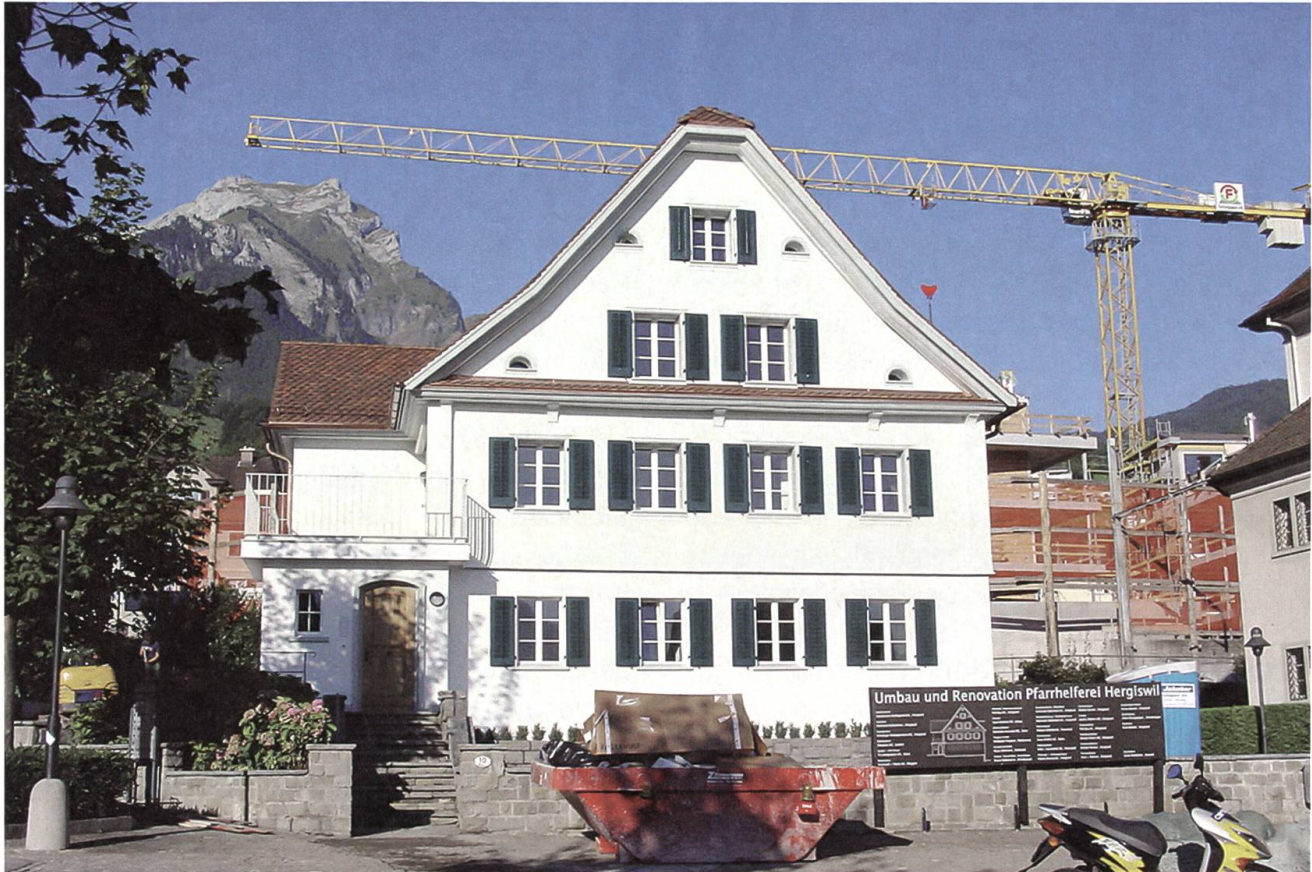
Hergiswil: Pfarrhelferei, Ansicht von Süden.