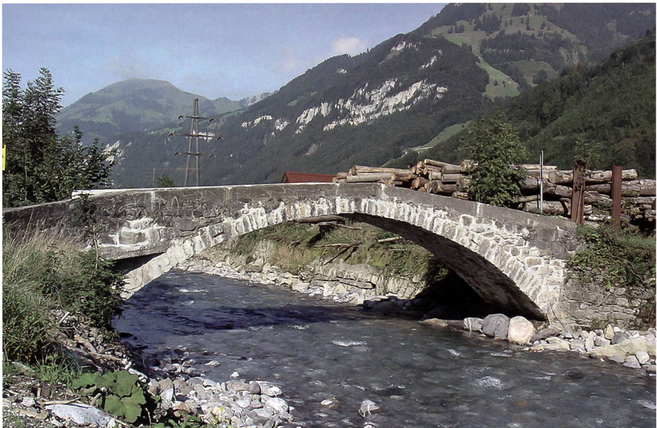
Wolfenschiessen: Schwybogenbrücke, Ansicht von Süden.

Geschichte: Steinerne Brücken zählen nicht nur im Kanton Nidwalden zu den grossen Ausnahmen. Der historische Brückenbau wird in der Schweiz ganz allgemein vom Holzbau beherrscht. Diese Tradition lösten erst die frühen Eisenbetonkonstruktionen unter anderen durch den Genfer Bauingenieur Robert Maillart (1872–1940) ab. Wo steinerne Brücken – wenn es sich nicht um neue Konstruktionen handelt – die Wasser überspannen, zählen diese allein schon aufgrund