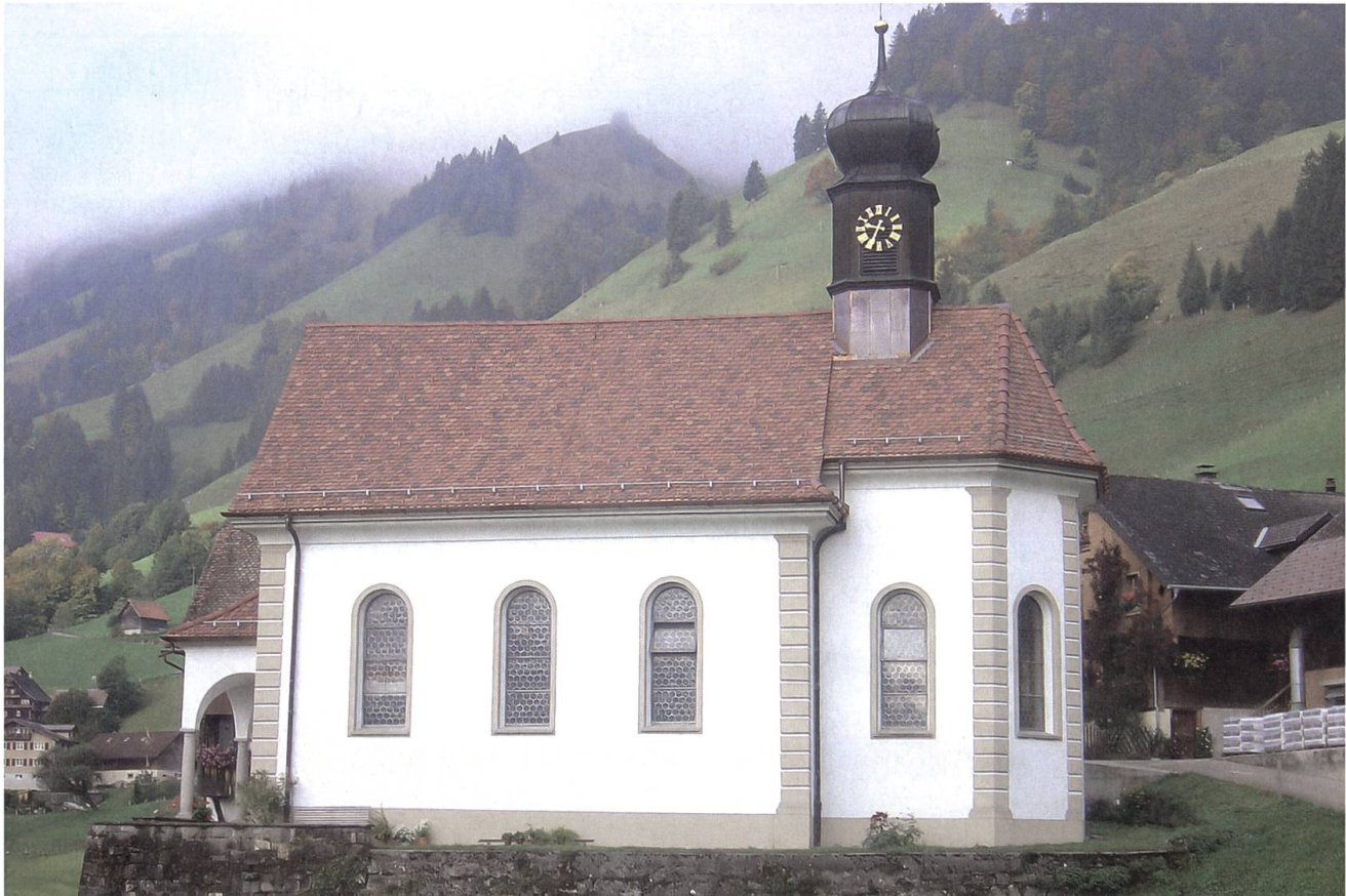
Wiesenberg-Kapelle: Hl. Jungfrau Maria Immaculata.