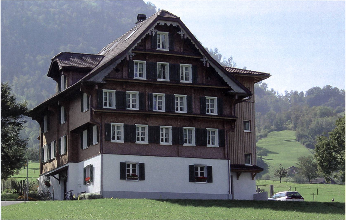
Stans: Wohnhaus Pulverturm, Aussenansicht von Nordosten.