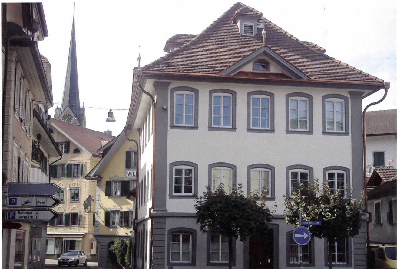
Stans: Wohnhaus Engelbergstrasse 7, Aussenansicht von Osten.

Das Haus besitzt zwei Hauszugänge, einen von der Engelberg-, der andere von der Poststrasse her. Von beiden Eingängen mit reich verzierten Empireholztüren führt ein schmaler Korridor zu einem im Westen gelegenen Treppenhausanbau. Dieser erschliesst die Etagenwohnungen und das Dachgeschoss und besitzt eine hölzerne Treppe mit Antrittspfosten und in Holz interpretiertem Beschlagwerkgeländer.