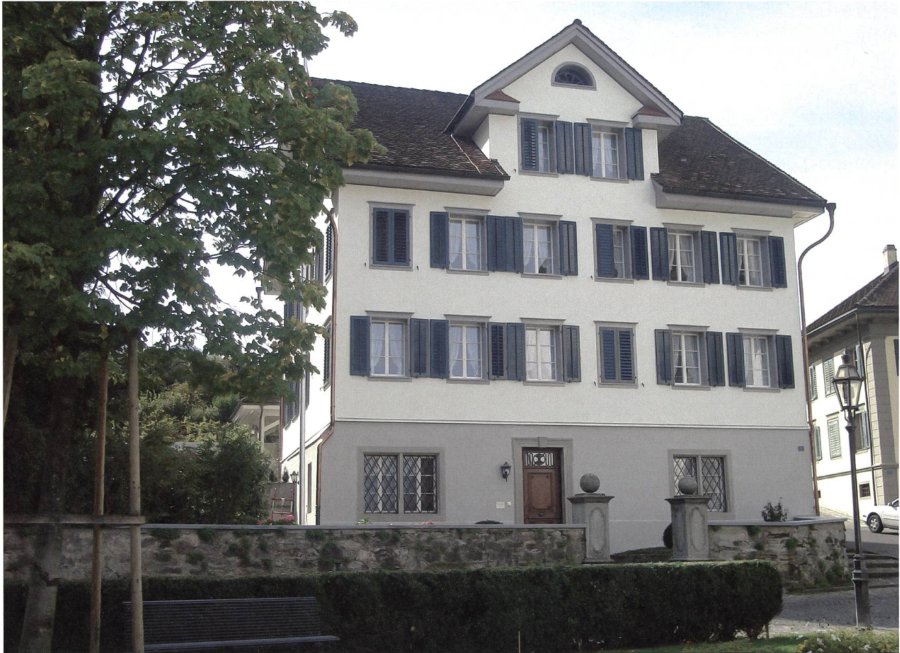
Stans: Pfarrhaus, Aussenansicht von Nordosten.

«steinin Turm abgeschlossen und der Pfarrhof ingemuret» werden soll, könnte sich auf bauliche Veränderungen beziehen. Der Stanser Dorfprospekt von 1650 im Rathaus zeigt den Pfarrhof über dem heute noch bestehenden gemauerten Sockel als zweigeschossigen Holzbau mit zur Nägelgasse hin giebelständigem Satteldach. Inwieweit der Pfarrhof beim Dorfbrand von 1713 ganz oder teilweise verschont geblieben ist, geht aus den überlieferten Dokumenten nicht hervor. Von baulichen Veränderungen im 18. und Anfang des 19. Jahrhunderts, möglicherweise im Zusammenhang mit einem südseitig hinzugefügtem Treppenhaus, zeugen das gohrte Nordportal und die reich profilierte Louis-XVI-Türe. Der wohl umfassendste bauliche Eingriff, der dem Haus seine heutige Volumetrie und Silhouettenwirkung eintrug, fand in den Jahren 1859/60 statt. Damals wurde das Haus in seinem Oberbau völlig verändert. Vom alten Bestand blieb nur das ebenerdige Kellergeschoss mit den spätgotisch profilierten Türöffnungen erhalten.