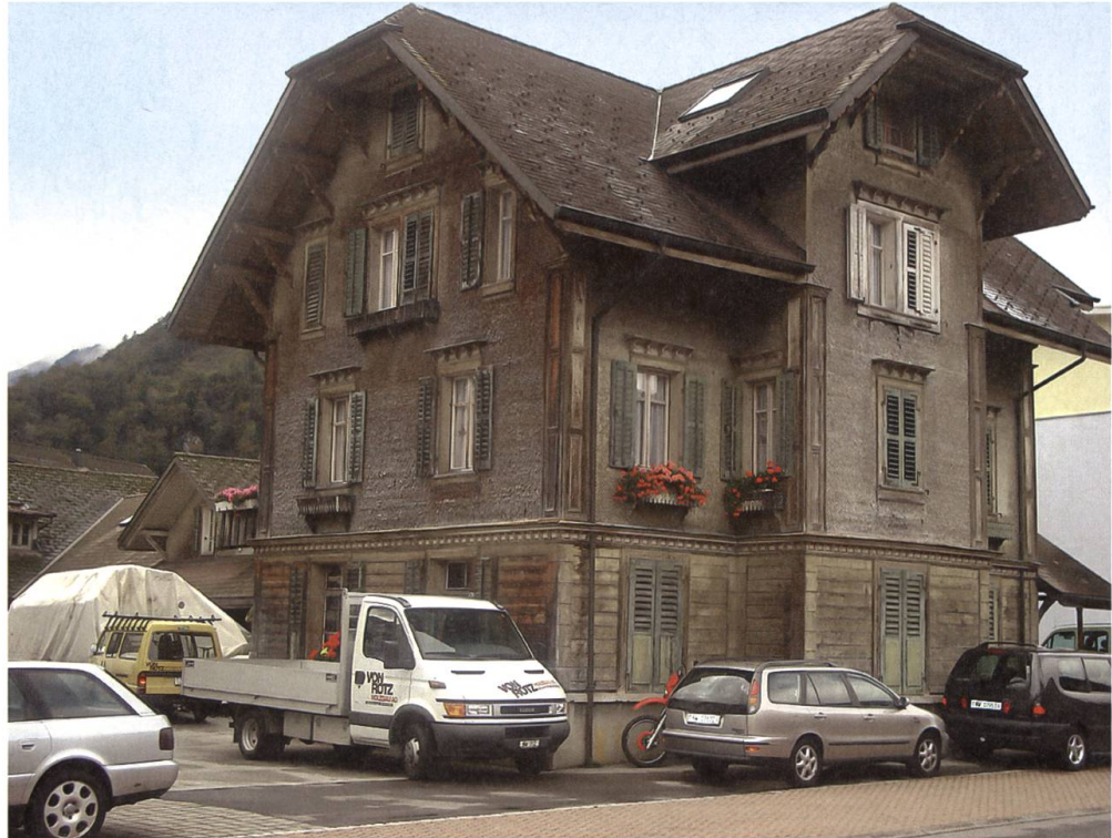
Stansstad: Holzhaus an der Dorfstrasse.