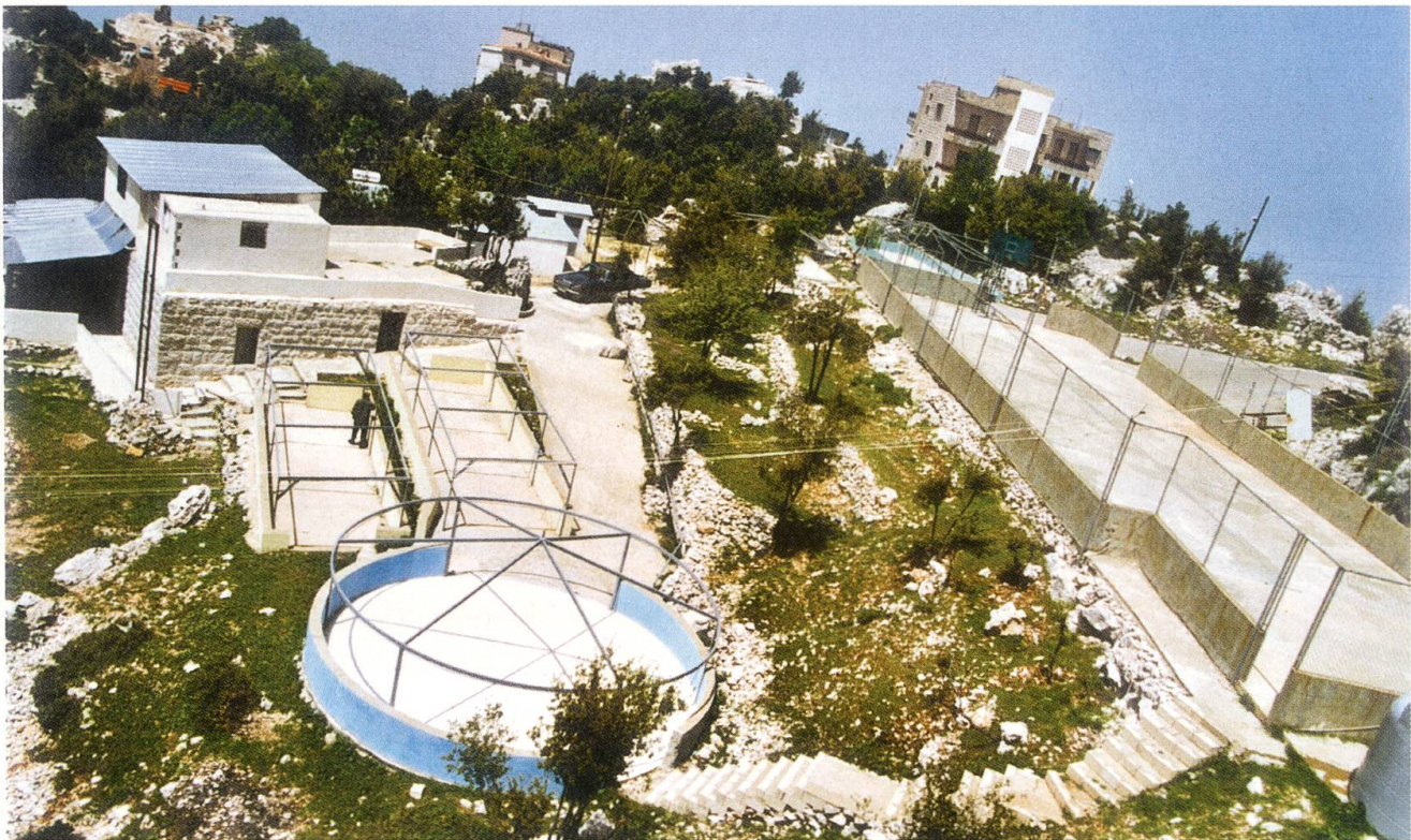
Das 5'000 Quadratmeter grosse Areal vor dem Haus des Friedens. Hier soll ein «Garten des Friedens» entstehen.