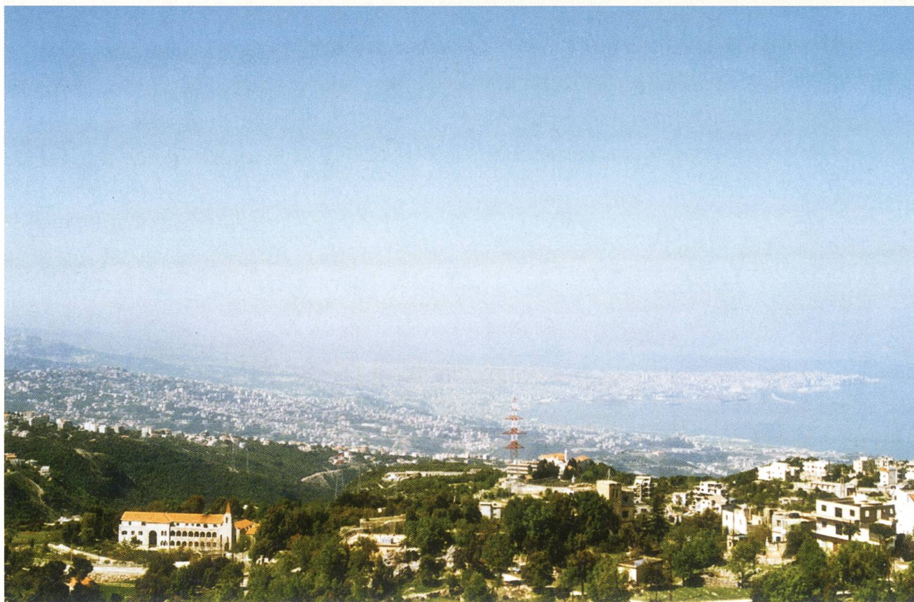
Ausblick von Achkouf auf die Millionenstadt Beirut.

Für alle, die in den Pfarreischulen von Antélias lehren und lernen, ist es ein überwältigendes Erlebnis, wenn sie von Zeit zu Zeit aus den bedrückenden Quartieren ausbrechen und sich an einem friedlichen, naturnahen Ort erholen können. Solche «Ferien» sind wichtige Pausen von den Kriegswirren. Auch das ist dem Verein Solidarität Libanon-Schweiz ein grosses Anliegen.