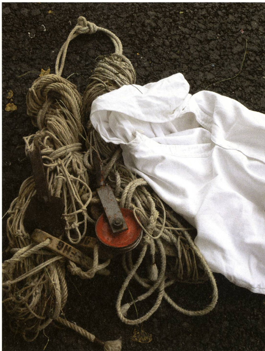
Ausrüstung fürs Planggenheuen.

Wie viele Heubündel er auf der familieneigenen Liegenschaft Bielen schon auf seinem Rücken zum Stall oder einem der Heuseile getragen hat, weiss er nicht. «Gezählt habe ich sie nie. Mit dem Alter aber macht sich im Bereich des Rückens das eine oder andere Ziehen bemerkbar.» Er habe sich gerade in jungen Jahren nicht immer geschont, meint er mit einem Achselzucken.