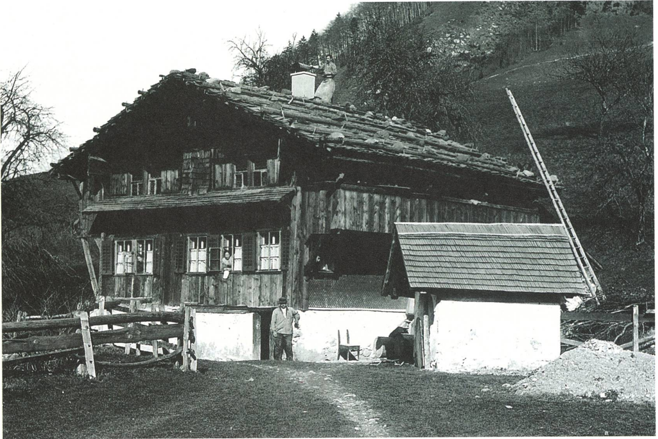
Wolfenschiessen, Altzellen, Wilersdörfli; Foto um 1910, abgebrochen.