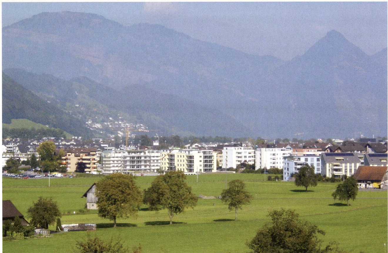
Talboden von Stans mit städtisch geprägten Wohnbauten, Stand 2007.