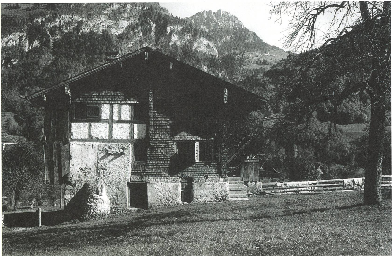
Dallenwil, Haus Landammann Andreas Z'Rotz; Foto um 1910, abgebrochen.