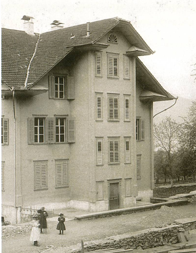
Buochs, Schulhaus, erbaut 1851, abgebrochen 2006.

übernahmen die Schwestern die nahe gelegene Mädchenschule. Zuvor schon, 1601, hatten ihnen die Kirchgenossen ein kleines Häuslein und das Pfrundhaus der «Amsteinpründe» oberhalb des Rathausplatzes überlassen, da sie sich durch das Halten einer Mädchenschule nützlich gemacht hatten. Zur Klostergründung kam es jedoch erst 1618 und zum Bau eines Frauenklosters 1620 bis 1625. Die Führung einer Mädchenschule war die wesentlichste Aufgabe des Klosters. Nachdem die Oberleitung über das Kloster vom Abt von Muri an die Kapuziner übergegangen war, wurde 1674 eine strenge Klausur eingeführt. Die nachreformatorische Blütezeit ermöglichte 1728 bis 1730 eine Vergrösserung des Klosters um den dorfabwärts gerichteten, parallel zum St. Klara-Rain verlaufenden Annexbau. 1798 wurde in diesem Annexbau eine Waisenanstalt für Mädchen und Knaben eingerichtet, der Pestalozzi vorstand. 1799 wurde die Anstalt aufgehoben und den französischen Truppen als Unterkunft zur Verfügung gestellt – dieser Bau wird heut fremdgenutzt. Erst 1867 wurde den Schwestern die Bewilligung zur Gründung eines Internats und 1889 eines Lehrerinnenseminars (1889–1953) erteilt. 1970 zogen sich die Schwestern aus der Dorfschule zurück.