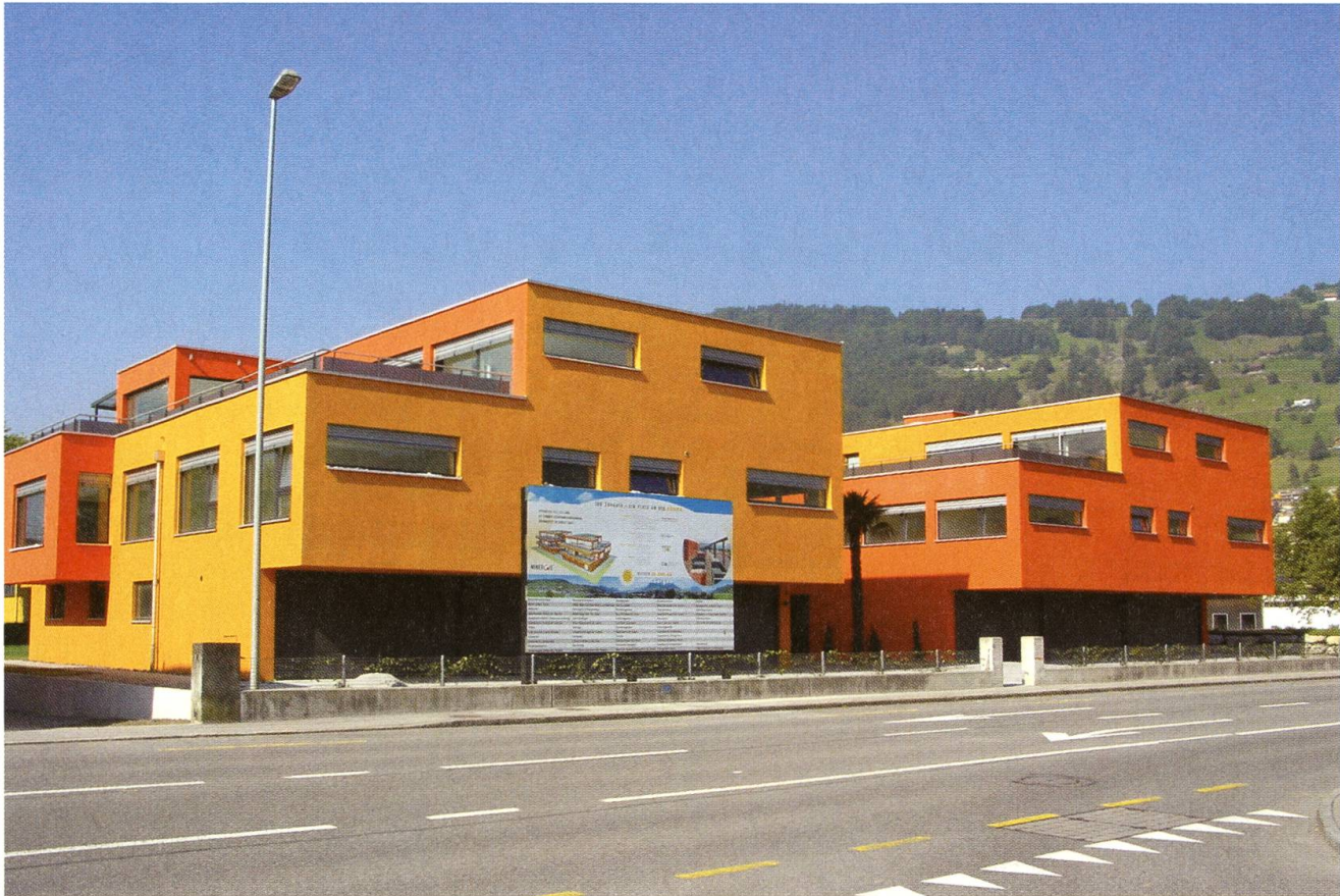
Ennetbürgen, Wohnhaus, Ennetbürgerstrasse 53; Neubau nach Abbruch der sogenannten Direktorenvilla (2007).

des Regierungsrates liegt. Als Fachstelle ist die Denkmalpflege für die Bestimmung der Schutzwürdigkeit und die Denkmalkommission antragstellend für die Aufnahme ins kantonale Denkmalschutzverzeichnis zuständig. Unterschutzstellungen bedürfen der sorgfältigen Abwägung zwischen den öffentlichen und den privaten Interessen. Es ist dies der politische Entscheid par excellence.