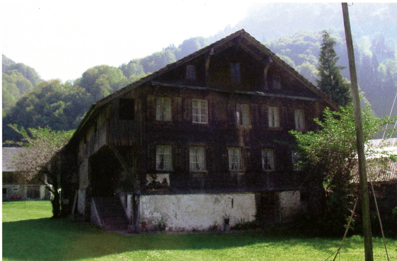
Wolfenschiessen, Bauernhaus Obchapelen vor der Restaurierung, Stand 2007.

Mit RRB Nr. 390 vom 7. Juni 2005 wurde der um 1800 erbaute Sonnwendhof wegen seiner grosszügigen Raumdisposition, seiner beherrschenden Lage am Ortsbildrand von Stans und seiner Empire-Ausstattung als schutzwürdiges Haus unter Denkmalschutz gestellt. Von besonderer Bedeutung für die Unterschutzstellung war die Innenausstattung, die für die Empire-Zeit von besonderem Interesse ist. Der historisch relevante Bestand wurde 2007 inventarisiert und fotografisch dokumentiert. Von besonderem Interesse sind die kunstvollen Parkettböden, die originalen Hartholztüren, das Brust- und Wandtäfer, die Kachelöfen sowie die Deckenspiegel mit Stuckrahmungen.