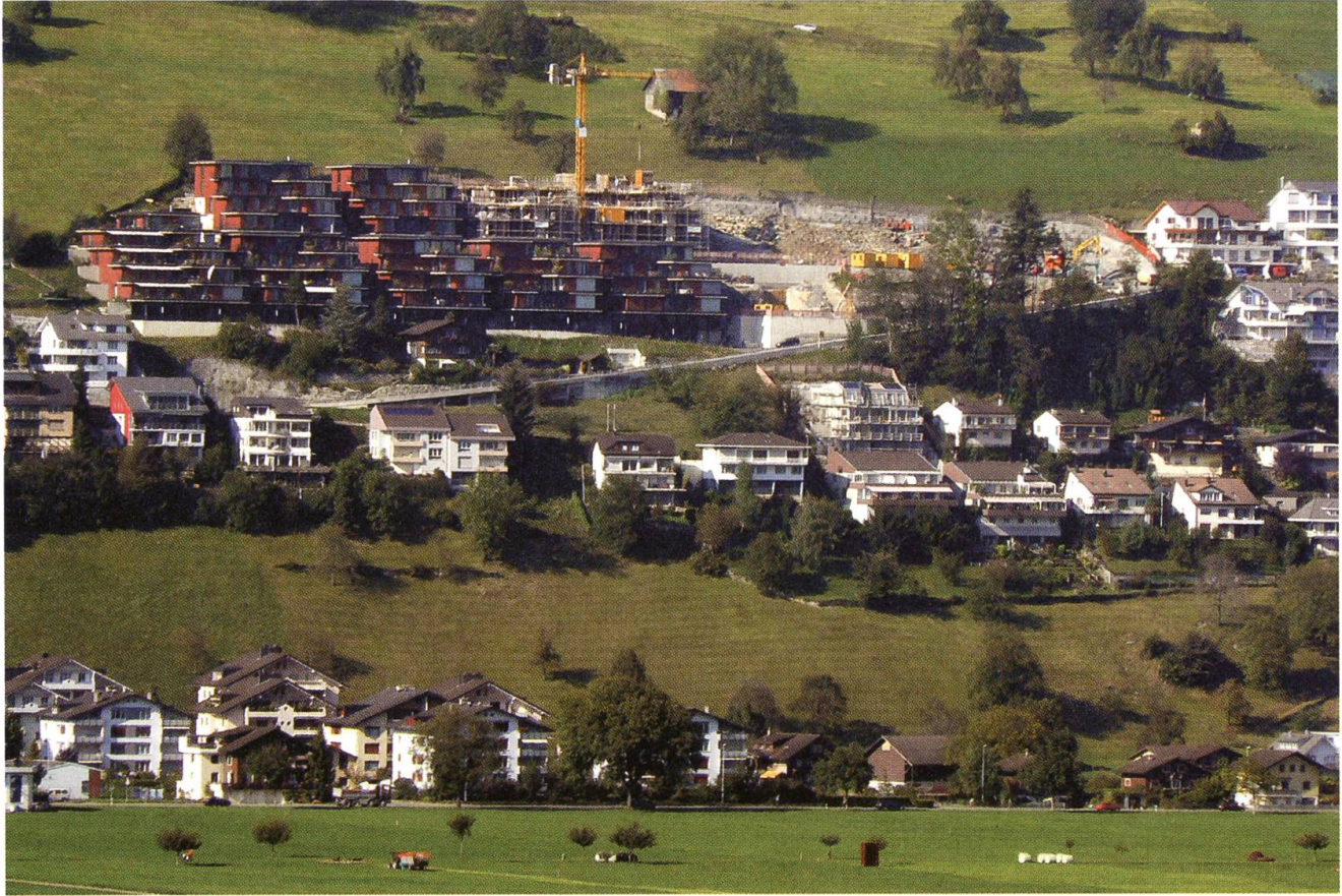
Ennetbürgen, städtisch geprägte Wohnbauten, Stand 2007.