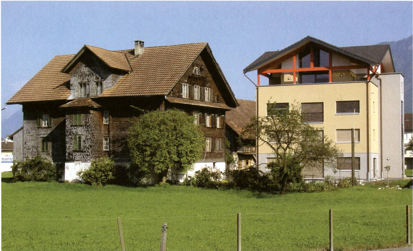
Stans, links: Wohnhaus Hostatt (erbaut um 1820), vor dem Abbruch; rechts: erstellter Ersatzbau, Stand 2007.

handelte sich um eine konservierende, zurückhaltende Restaurierung, welche die Substanz des 19. Jahrhunderts weitestgehend respektiert.