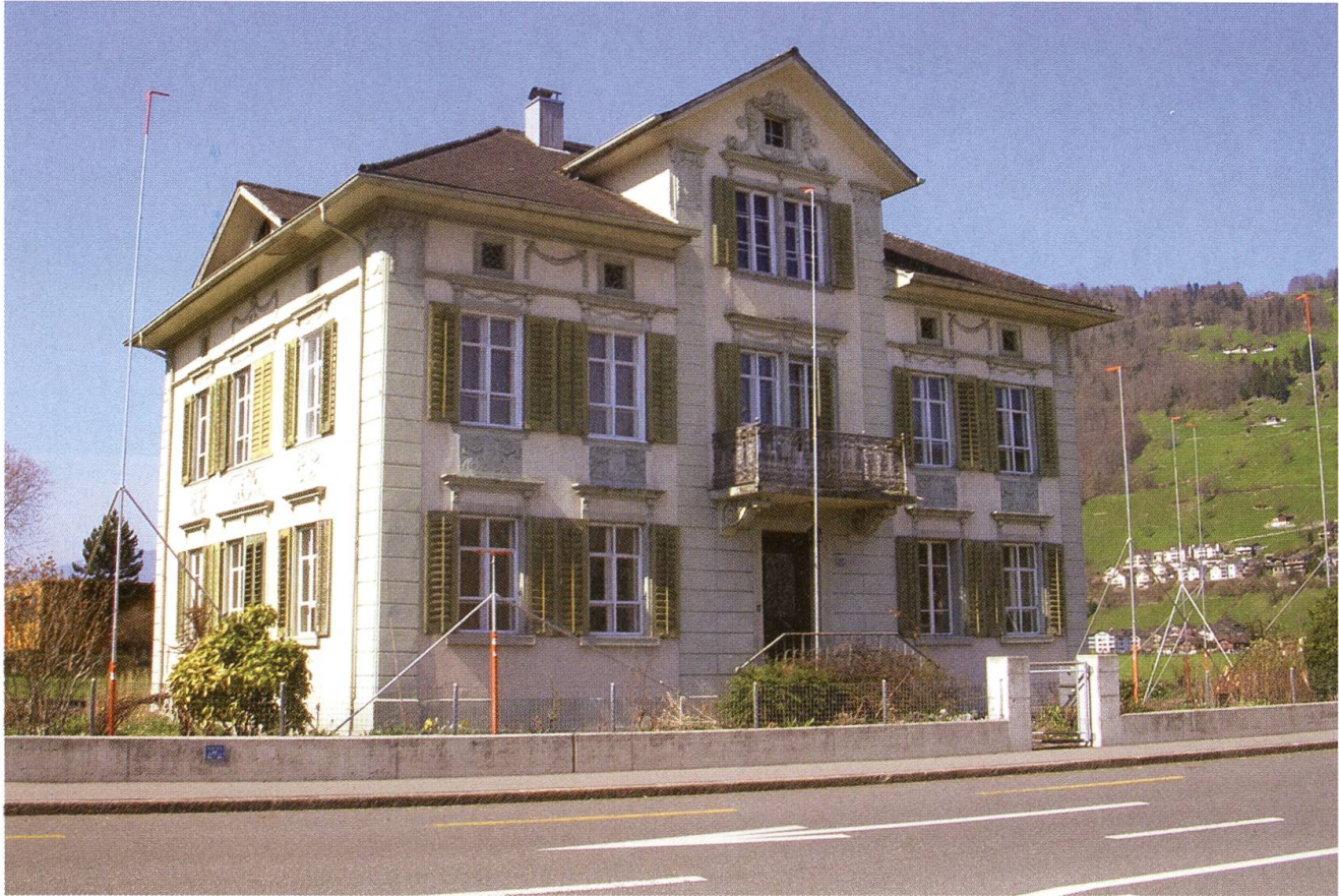
Ennetbürgen, Wohnhaus Ennetbürgerstrasse 53 (sogenannte Direktorenvilla), abgebrochen 2006.

Denkmäler, so definiert es das Denkmalschutzgesetz, sind Gegenstände aus vergangener Zeit, an deren Erhaltung wegen der in ihnen erkenn- und erlebbaren historischen Bedeutung ein öffentliches Interesse besteht. Artikel 9 der Charta von Venedig aus dem Jahr 1964 spricht von der Doppelnatur des Denkmals, das aus historischen und ästhetischen Werten besteht: Ziel der Restaurierung ist es, so die Charta, «die ästhetischen und historischen Werte des Denkmals zu bewahren und zu erschliessen».