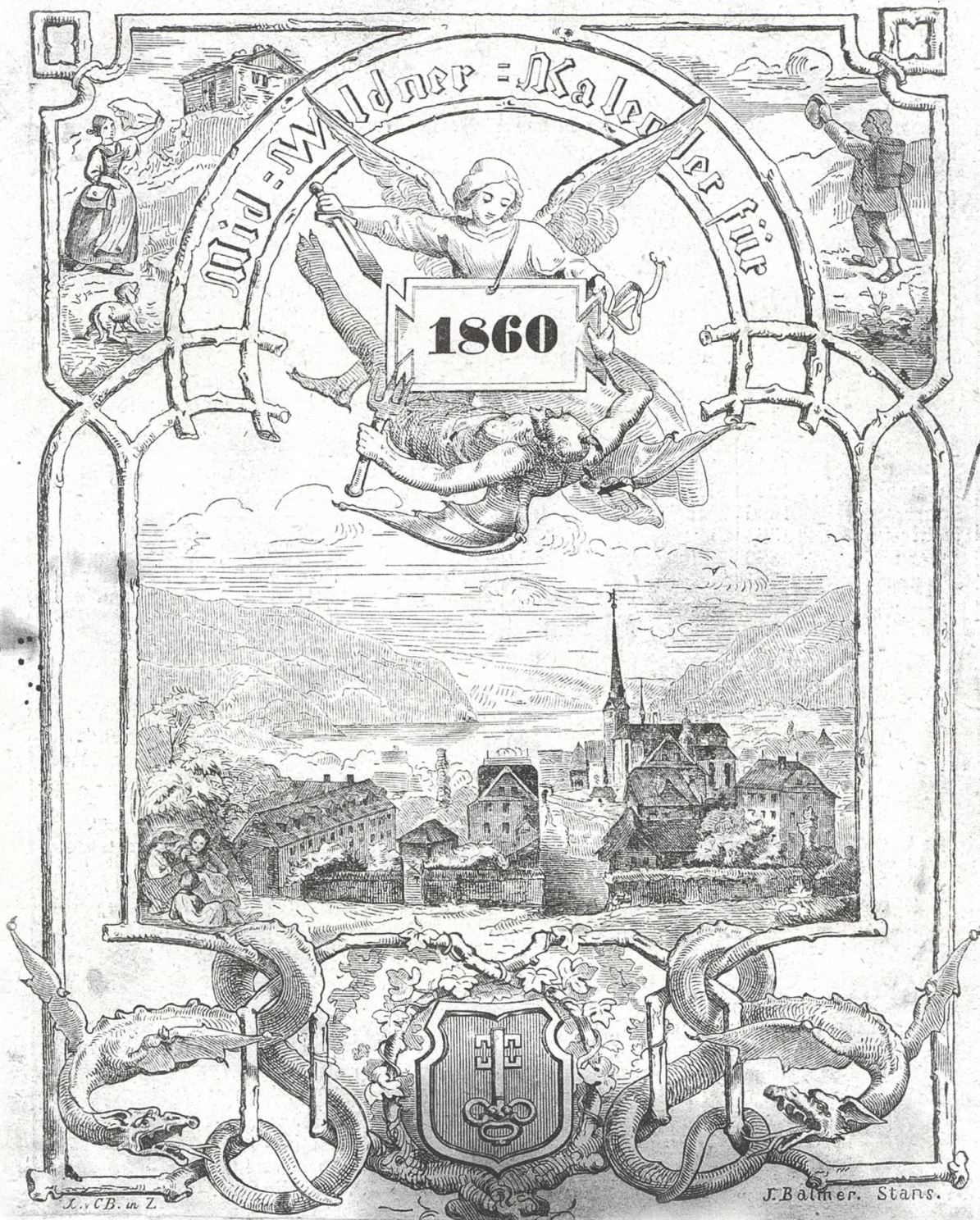
Titelbild des ersten «Nidwaldner Kalenders». Vierzig Seiten dick mit Kalendarium und Artikeln über Gottesfurcht und Sittenstrenge.