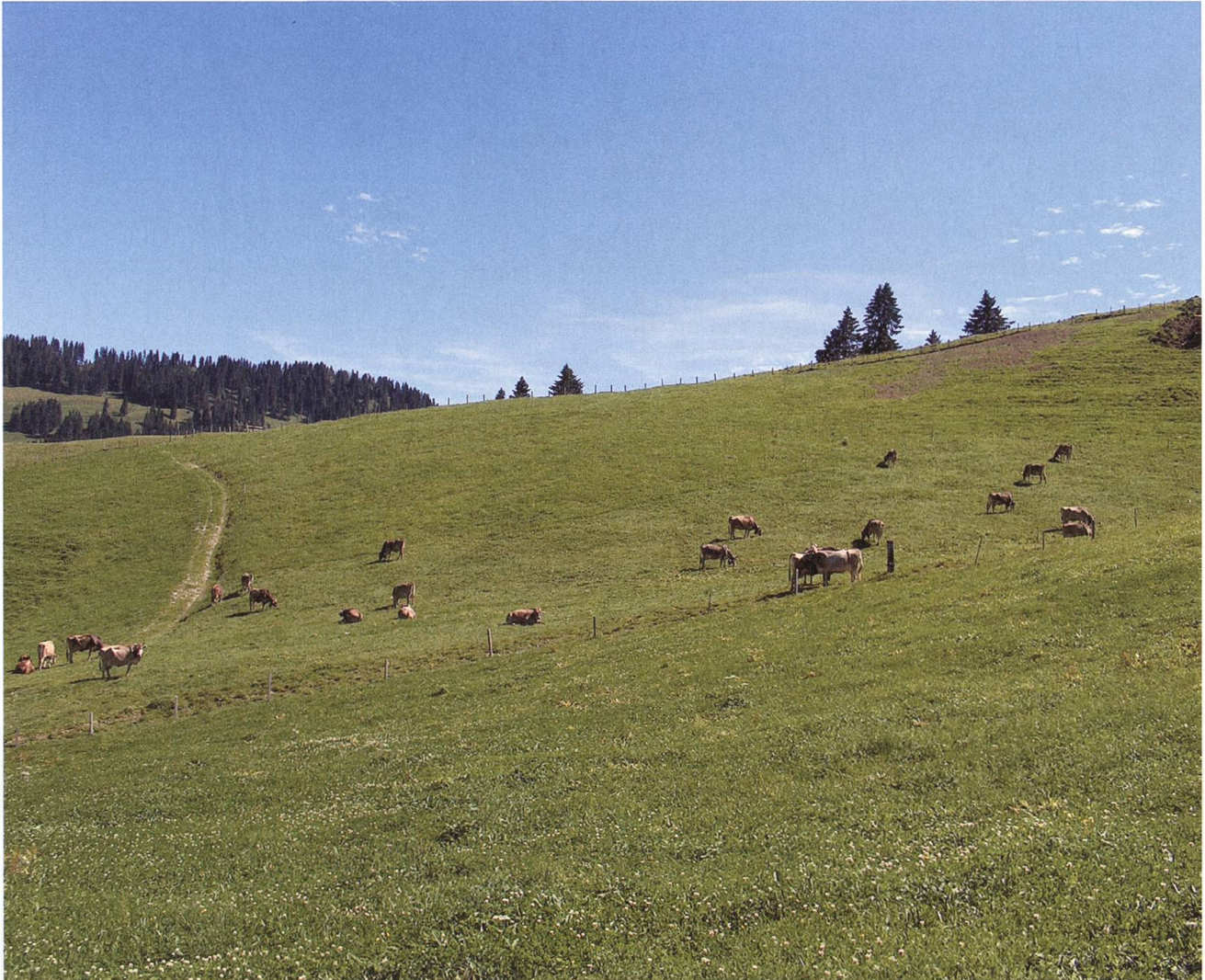
Die Alp Chieneren, Dürrenboden, Wiesenberg. Gutes Alpweideland ist Voraussetzung für hervorragende Alpprodukte.

Das himmlische Paradies ist dort, wo Milch und Honig fließen. So steht es jedenfalls in der Bibel. Ob demnach irdische Flurnamen wie Milchbrunnen das Paradies auf Erden bezeichnen? In diesem Fall wäre das ein Bauerngut in Stans... Und führt die Milchstrasse auf direktem Weg in den Himmel? Fest steht: Milchwirtschaft prägt unsere Kultur seit jeher, sie war und ist noch immer die Hauptertragsquelle der Nidwaldner Landwirtschaft. Dies liegt in den klimatischen und topografischen Gegebenheiten in unserem ausgedehnten Berg- und Alpengebiet begründet. Deshalb spielen Milch, Rahm, Butter und Käse im Menüplan der Nidwaldnerinnen und Nidwaldner eine grössere Rolle als anderswo, und entsprechend wird die Landwirtschaft auch von Behörden und Organisationen gepflegt, gefördert und kontrolliert – ebenfalls seit jeher.