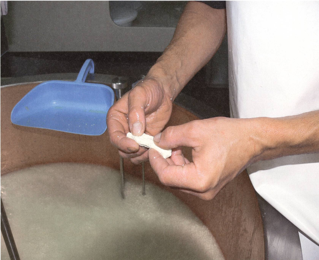
Trotz Modernisierung: Käsen ist immer noch vor allem Handwerk und erfordert viel «Gspüri».

alterliche Ziger erfüllten diese Anforderungen. Wenn aus dem 17. und 18. Jahrhundert viele Urkunden über den blühenden Käse- und Viehhandel mit Italien berichten, so musste die Käse-reitechnik seit dem Mittelalter doch grosse Fortschritte gemacht haben.»