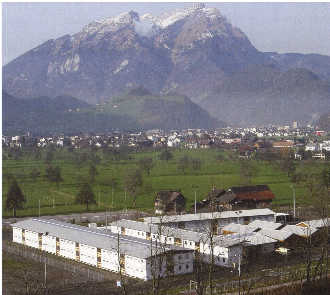
Das Ausbildungs-Camp von Swissint in Oberdorf gleicht dem Camp Casablanca im Kosovo fast aufs Haar.

Wie jüngst die Schweizer UN-Militärbeobachter in Georgien: Wo am Vortag noch Zehntausende einen normalen Alltag erlebten, herrschte anderntags Krieg, und die Einwohner ganzer Landstriche waren auf der Flucht. Zwei Schweizer