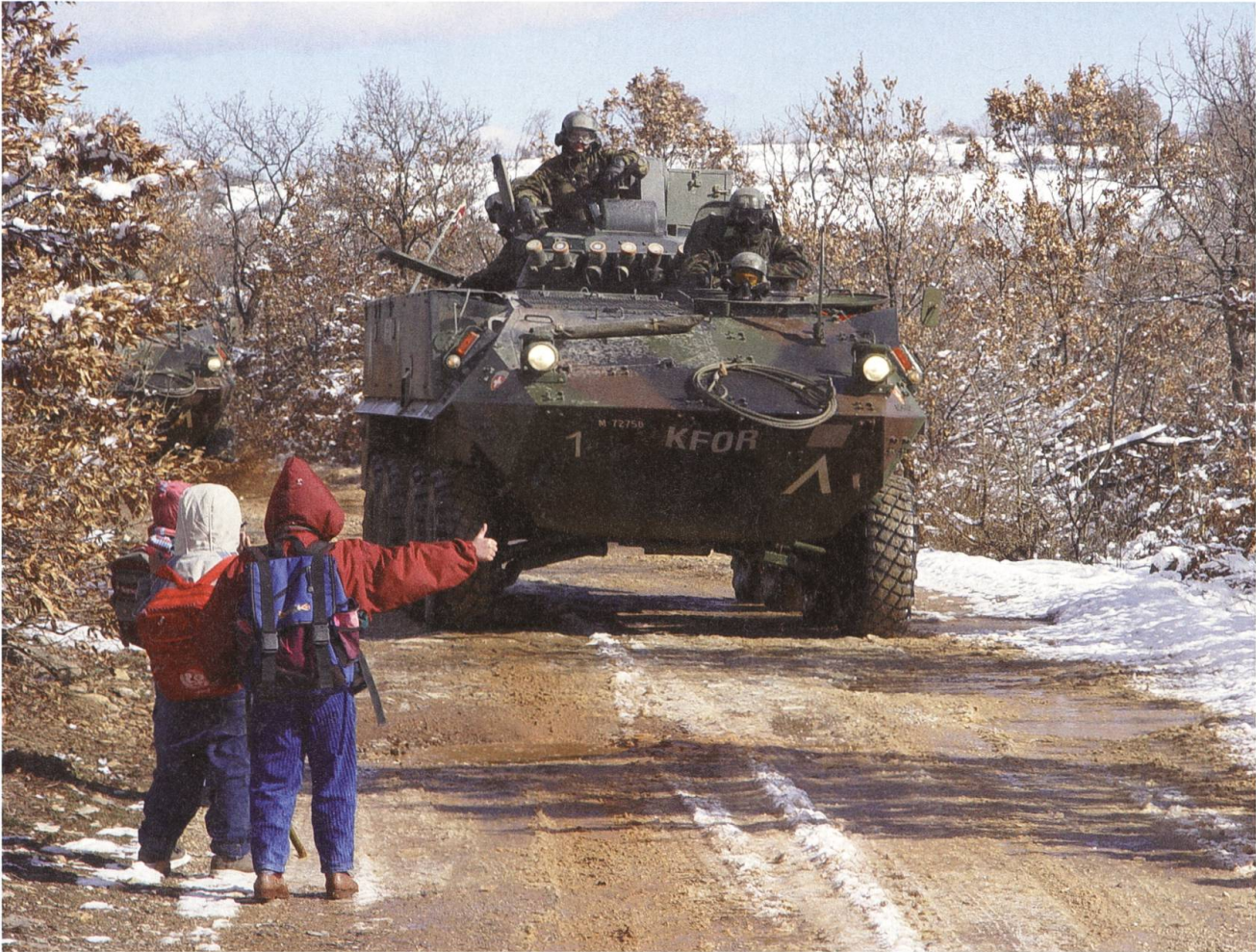
Drei Kindergärtner beim «Autostöple» im Kosovo. Zusammen mit der Swisscoy gehen sie einer friedlicheren Zukunft entgegen.

Kunde ist König – rumkommandieren lassen wir uns aber nicht», sagt die Zeughausangestellte selbstbewusst.