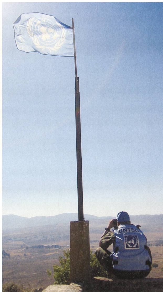
Schweizer UN-Militärbeobachter sind weltweit im Einsatz. Das Rapportieren und Beobachten in Krisenregionen gehört zu ihren wichtigsten Aufgaben.

ausrüstung für die Ausland-Missionen aushändigt. Das Material ist exakt auf den jeweiligen Einsatzbereich und die klimatischen Bedingungen vor Ort abgestimmt. Wasserfilter und Strahlungsdosimeter gehören genauso zur modernen Ausrüstung eines Peace Keepers wie das altbewährte Sackmesser oder die Gamelle. So modern die Ausrüstung ist, so fortschrittlich präsentiert sich auch die Einrichtung im Zeughaus Stans. Kein Wunder also, entspricht Monica Mathis ganz und gar nicht dem Klischee einer typischen Zeughäuslerin. Nichts ist's mit grauem Hosenanzug oder staubigem Haar vom in alten Kisten nach Hosen und Mützen rumwühlen. Monica Mathis trägt ein modisches T-Shirt, hat rot gefärbte Strähnen im Haar und ein kleines Tattoo auf dem linken Oberarm. «Ich arbeite in einem fortschrittlichen Dienstleistungsbetrieb. Der