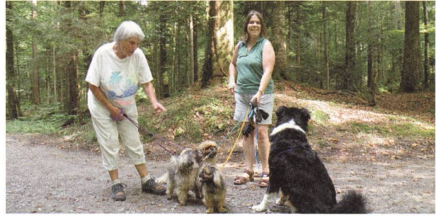
Der Kernwald ist heute ein beliebtes Freizeit- und Naherholungsgebiet.

verboten ist. Seit 1983 ist der Kernwald ausserdem als Naturobjekt und als «Landschaft von nationaler Bedeutung» ausgeschieden.