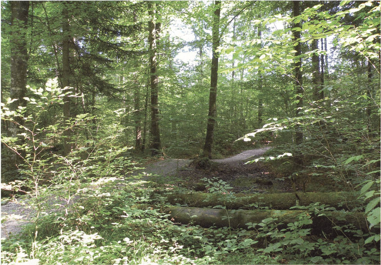
Der wellenförmige Weg zum Erlebnisparkours «Räuber und andere Gestalten» zeigt: Er ist auf dem Abbruch-Kegel gebaut.

mehr sichtbar. Das eigentliche Ablagerungsgebiet des Bergsturzes bildet der Kernwald, der heute mit einem dichten Blockschutt-Laubmischwald aus Rotbuche, Esche, Weisstanne und Bergahorn überwachsen ist.