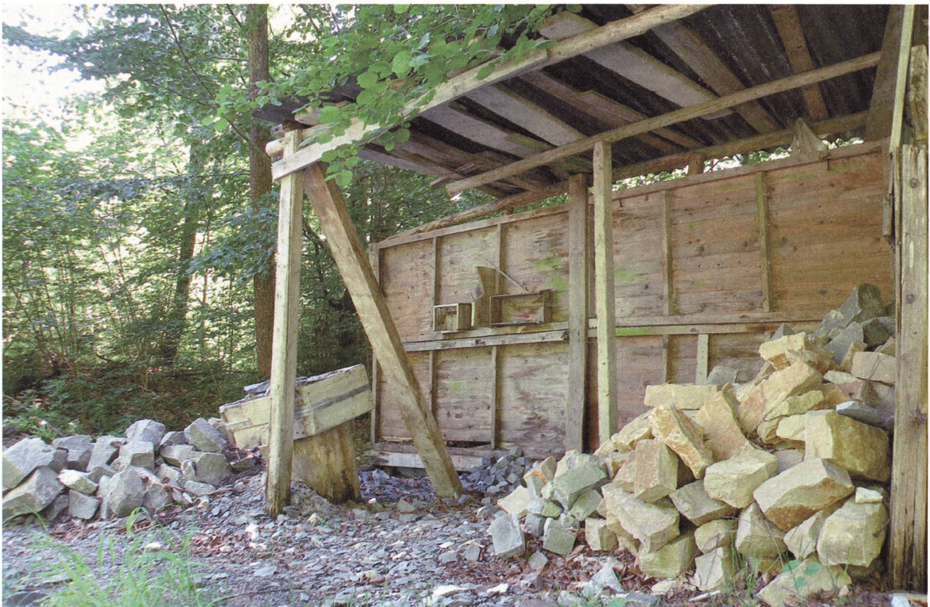
Bergsturz-Blöcke wurden zu Quadern geklopft: alte Steingrube auf der Höhe Rossmatt.

Ist es der zunehmenden Nutzung des Kernwalds zuzuschreiben, der Nüchternheit der Wissenschaft? Der Schrecken rund um den Kernwald ist einer Wertschätzung gewichen. Der Kernwald wird zunehmend als Besonderheit der Natur erkannt – und anerkannt. Am 23. Dezember 1966, in den frühen Anfängen des Natur- und Landschaftschutzes, stellte der Nidwaldner Regierungsrat fünf Tomahügel unter Schutz. Der Kanton Obwalden seinerseits legte zur selben Zeit als Schutzziel fest: «Die Erhaltung des Landschaftsbildes durch Baufreihaltung mit Ausnahme der land- und forstwirtschaftlichen Gebäude, sowie die Absperrung gegen Autoverkehr». 12 Seither sind die meisten Fahrwege für den Verkehr gesperrt. Rund um den Gerzensee wurde eine Naturschutzzone eingerichtet, wo das Betreten einzelner Gebiete zum Schutz der Lebensräume von seltenen Pflanzen