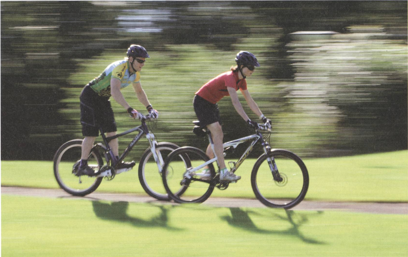
Rasante Fahrt: Einige der Bike-Arena-Strecken bieten Tempo und Fahrtwind.

und den Service für die Mietbikes. Es stehen 30 moderne und topaktuelle Mietbikes sowie Helme für Einzelpersonen, Gruppen und Familien zur Verfügung. Im Mietcenter kann diverses Zubehör wie zum Beispiel Helme, Schoner und Rucksäcke gekauft werden.