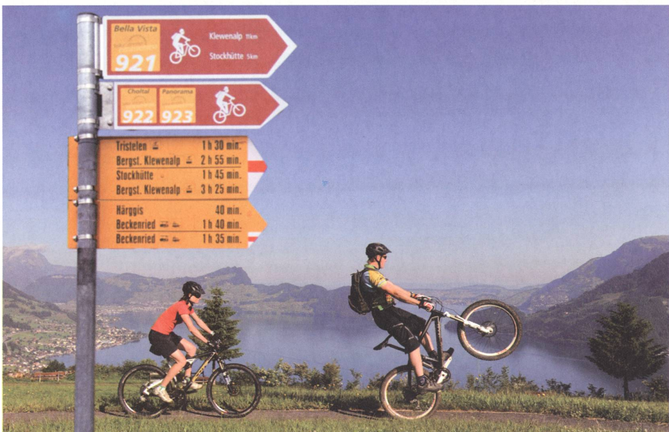
Frohgemut voran: Die «Region Emmetten» ist zur Bike-Arena geworden.

Bei der Talstation der Gondelbahn Emmetten-Stockhütte befindet sich das Mietcenter sowie ein Bike Service point für kleinere Reparaturen