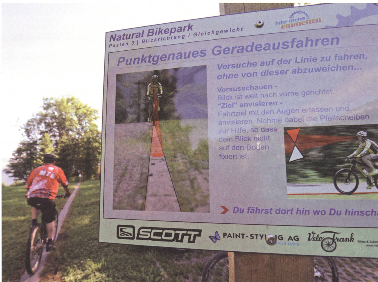
Lehrpfad: An den Posten mit Anleitungen können Anfänger lernen, richtig zu biken.

Diverse offiziell ausgeschilderte Routen in der Region machen Bikeferien zu einem Erlebnis. Eine für die ganze Region gültige Bikekarte ist in den Tourist-Informationen Beckenried, Emmetten