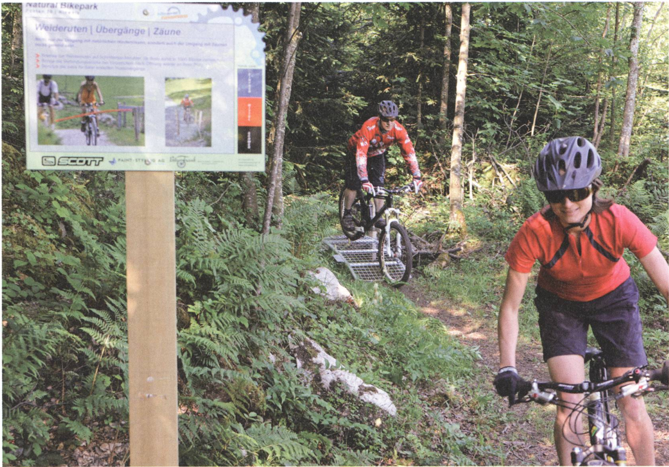
Blau, rot, schwarz: Die Pisten sind mit Kennfarben in drei verschiedenen Schwierigkeitsgrade eingeteilt.

und Seelisberg und bei allen Partnern der Bike-Arena erhältlich.