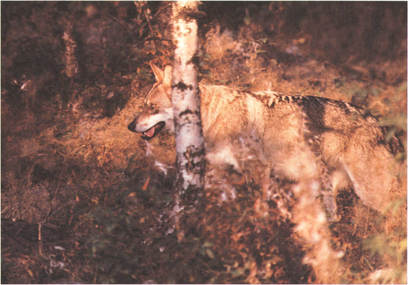
Freilebende Wölfe wie hier in Osteuropa sind in der Natur gut getarnt und gegenüber den Menschen sehr scheu.

Wölfen gelebt und ihr Verhalten studiert. Er ist von ihnen akzeptiert und als eine Art Oberwolf behandelt worden. Die gleichen Wölfe blieben aber andern Menschen gegenüber misstrauisch. Also mussten sie mindestens ihn, den Wolfsforscher, persönlich erkannt haben.