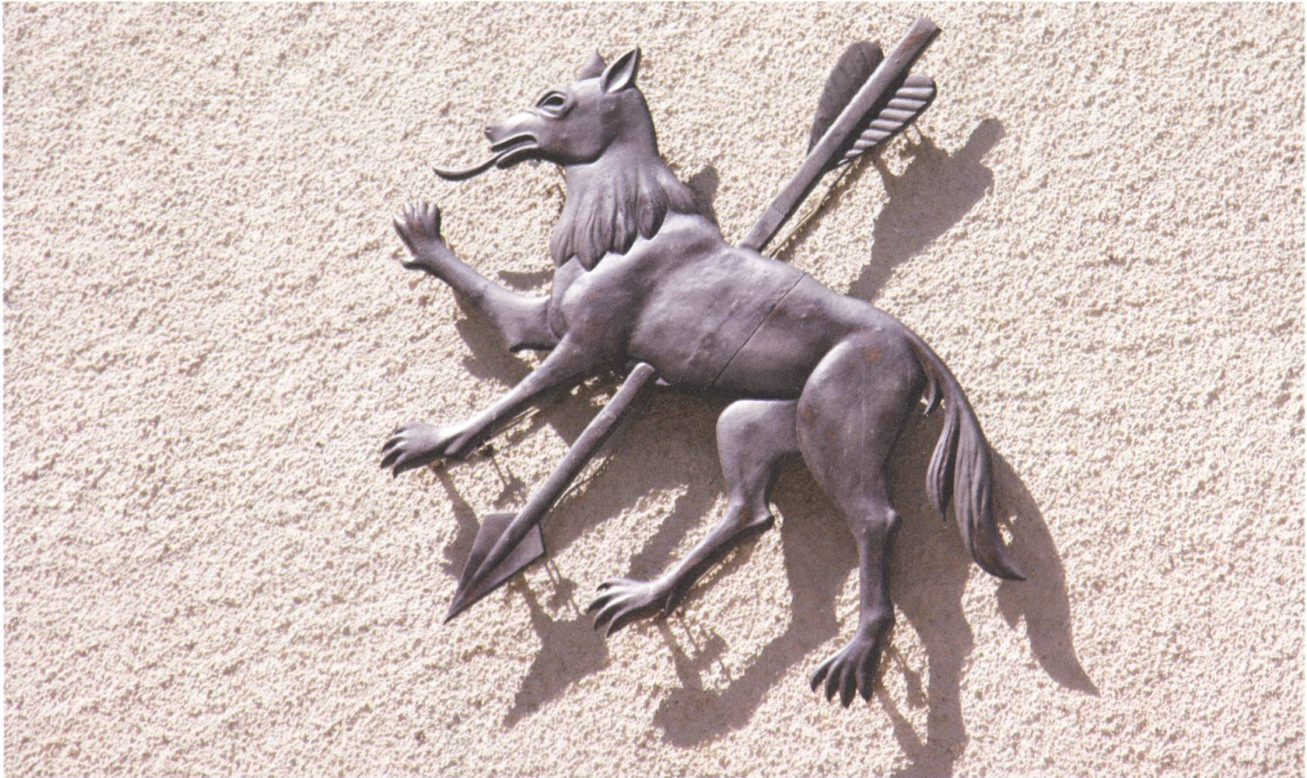
Das Gemeindewappen von Wolfenschiessen basiert auf einem Missverständnis.

vor allem die Besitzer von Klein- und Grossvieh gefordert sind. Sie sollen Schäden abwehren. Allerdings werden die Massnahmen, die sie treffen, vom Bund kräftig unterstützt. Das Wolfskonzept legt für die finanziellen Abgeltungen sogenannte Präventionsperimeter fest.