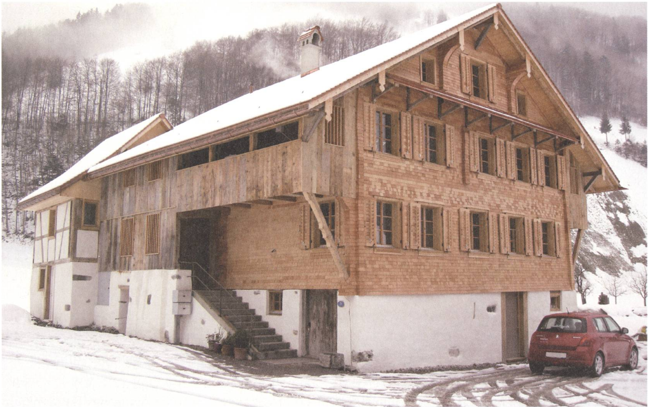
Das Haus Obchappelen in Wolfenschiessen zeigt sich nach der Restauration in neuem Kleid.

und zeigt deutlich, dass auch in Nidwalden noch immer unerforschte Spuren zu entdecken sind.