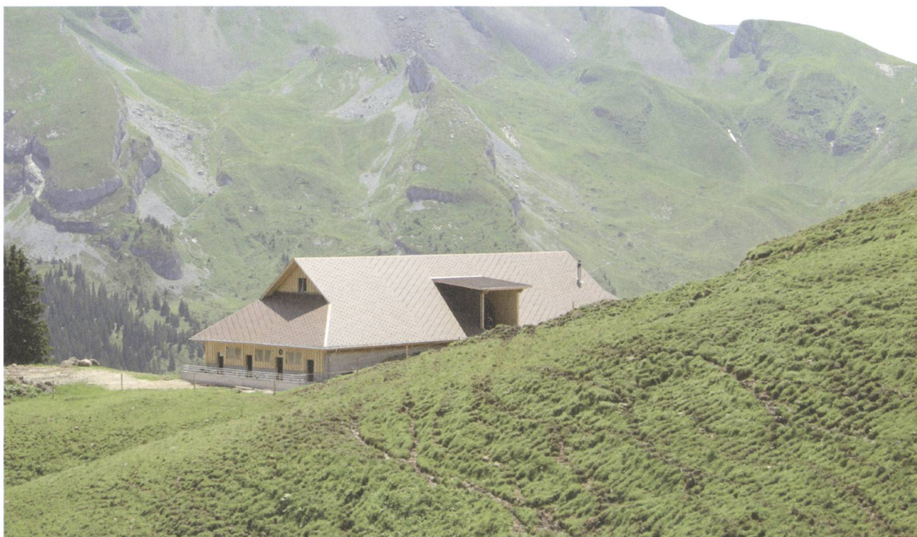
Der neue Stall auf der Musenalp erfüllt die geforderten Ansprüche an ein Bauen im Alpenraum.

wurde hingegen abgetragen, und der störende Bau entfernt. Heute ist der Blick auf das Haus Obchappelen von allen Seiten wieder frei.