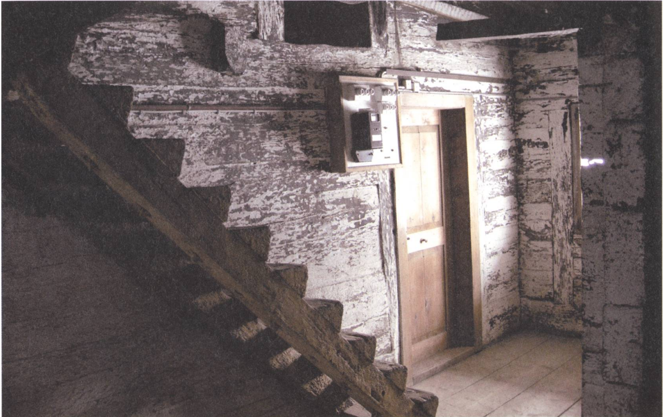
Das Haus Vorder Breiten in Ennetbürgen wurde abgebrochen. Die historischen Innenräume sind verloren.

Umgang mit ihnen muss bewusst geschehen und ihre Geschichte und Qualitäten respektieren. Die Icomos-Liste ist dazu ein hilfreiches Arbeitsinstrument.