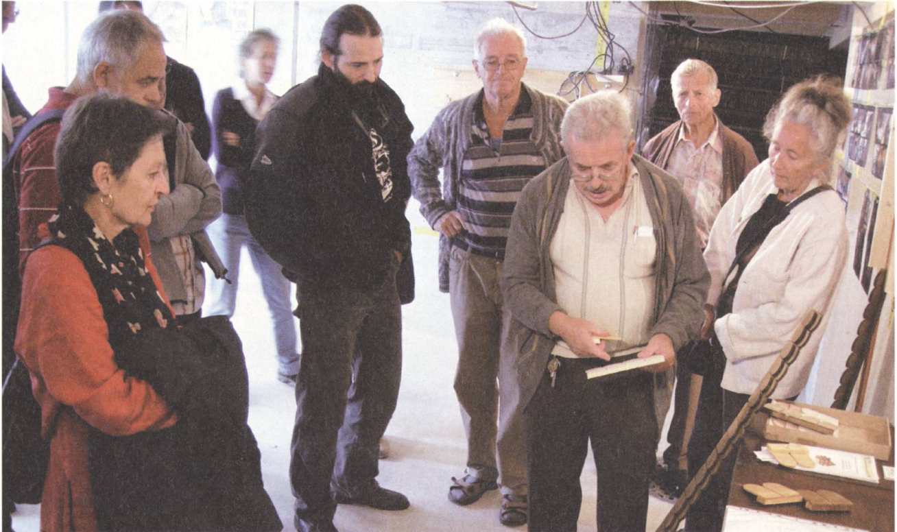
Am Tag des Denkmals stehen der interessierten Bevölkerung die Türen zu verschlossenen Baudenkmalern offen.

Flüeler einen gutbesuchten Jubiläumsanlass durchgeführt. Neben Weggefährten Stöcklis war auch sein gebautes Erbe Bestandteil der Ehrung. Für Stans hat die Denkmalpflege einen Rundgang konzipiert, der den noch vorhandenen Spuren von Arnold Stöckli folgt. Dabei zeigt sich deutlich, dass der Architekt Stöckli ein breites Repertoire an Gebäudetypen beherrschte und er seine theoretischen Studien und seine Bauten auf einer soliden kulturellen Grundlage entwickelte.