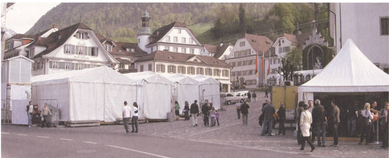
Während den Stanser Musiktagen verwandelt sich der historische Dorfplatz zum stimmungsvollen Festplatz.