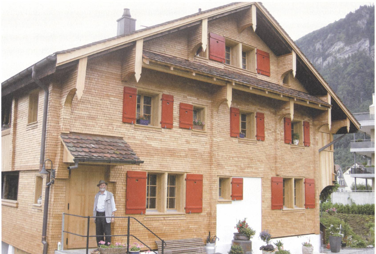
Emil Gschwend hat die Bauarbeiten am Haus Benzenhalten in Hergiswil betreut. Das Haus wurde isoliert.

Mit dem Abschluss der Restaurierungsarbeiten des Hauses Obchappelen in Wolfenschiessen konnte ein wichtiger Bauzeuge vor dem allmählichen Verfall gerettet werden. Er ergänzt eine Gruppe von Häusern im Sichtbereich des Hechhuis, die der Gemeinde Wolfenschiessen ein einzigartiges Gepräge verleihen. Dank der Restaurierung können im Gebäude zwei Wohnungen angeboten werden, die über traditionelle Wohn- und Schlafräume und über moderne Küchen und Bäder verfügen. Auch der Anbau in Riegelbauweise blieb erhalten und wurde fachgerecht restauriert, so dass heute das Baudenkmal wie aus einem Guss erscheint. Die sehr nahe am Gebäude platzierte Station der Wellenbergbahn