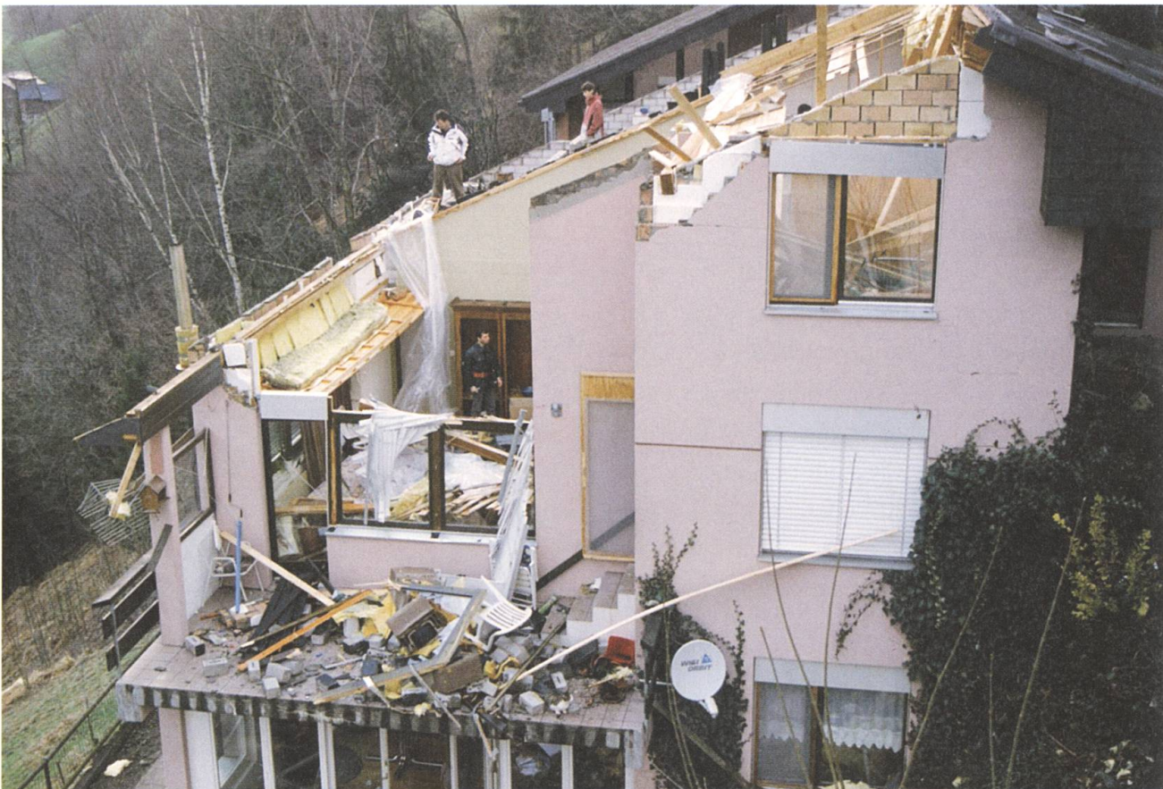
Dach weg: Der Sturm Lothar richtete 1999 grosse Schäden an.