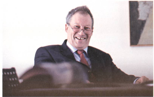
...bei meinem Amtsantritt...

Man darf nicht vergessen, dass Gefahrenkarten eine junge Errungenschaft sind und viele Überbauungen in der ganzen Schweiz ohne Berücksichtigung der Naturgefahren erstellt wurden. Von 1984 bis 2009 ist die Summe aller Schäden durch Naturereignisse bei Gebäuden um 180 Prozent