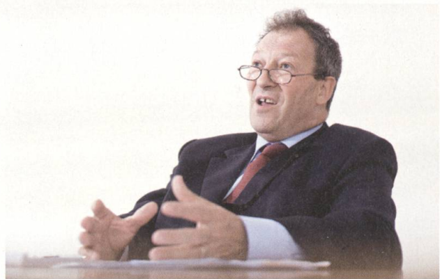
...muss man Naturereignisse...

Und wir haben mit System angefangen, uns als Versicherung selber zu versichern. Anfangs haben wir diese Rückversicherungen eingeführt bei