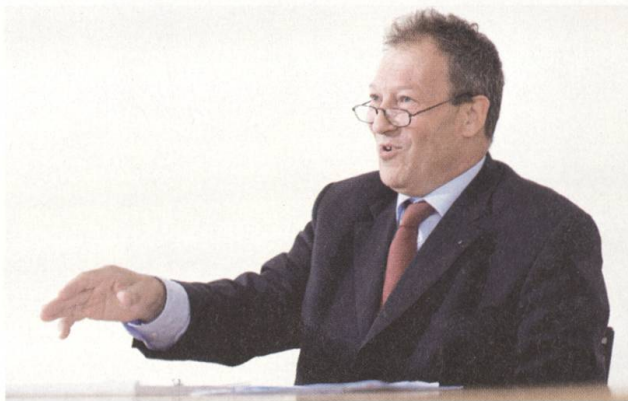
«Wenn man als Versicherung kalkulieren will...