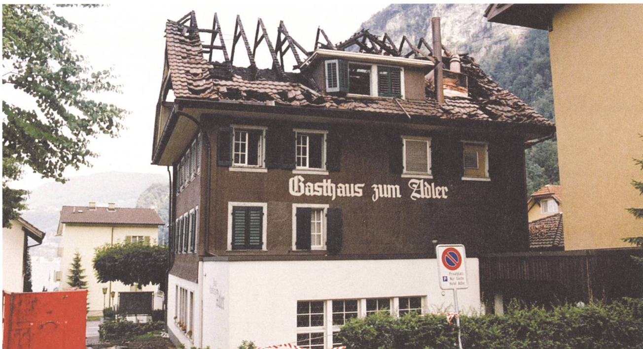
1.-August-Nachwehen: 1992 brannte das Dach des Hotels Adler in Hergiswil.

Es gibt keinen: Alles gehört zum Geschäft. Es gibt nur Ereignisse, die mich mehr oder weniger betroffen machten.