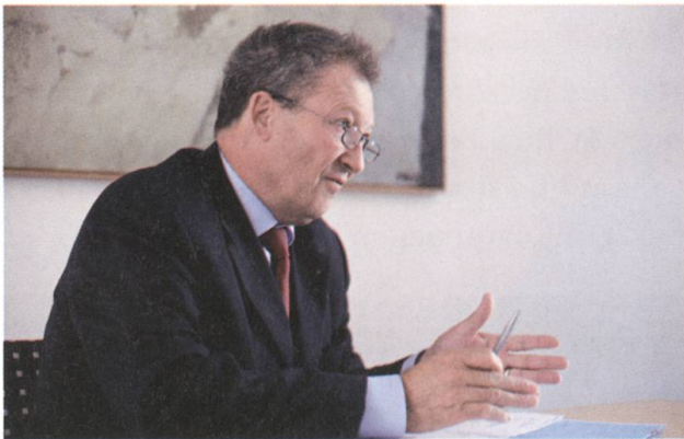
«Ich konnte mit meinem Fachwissen...

Wir haben beim Kunden zuviel Wissen vorausgesetzt darüber, wie Schaden entsteht und wie er verhindert werden kann. Zweitens: Wir haben früher den Kunden zu wenig qualifizierte Berater zur Verfügung gestellt. Drittens: Lange Zeit gab es keine Gefahrenkarten, aufgrund derer konkrete Schutzmassnahmen erarbeitet werden konnten. Kommt hinzu: Manchmal haben die Kunden schlicht das Gefühl: Die Versicherungen, die zahlen schon.