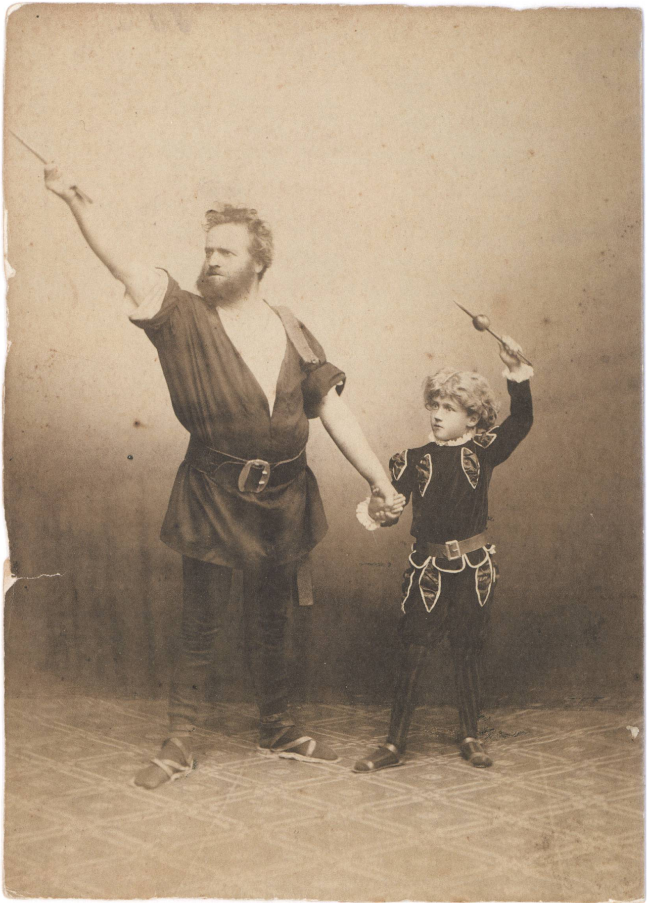
Heroisch und mit viel Pathos: Bereits 1892 schaffte das Theater Buochs mit «Wilhelm Tell» den Durchbruch.