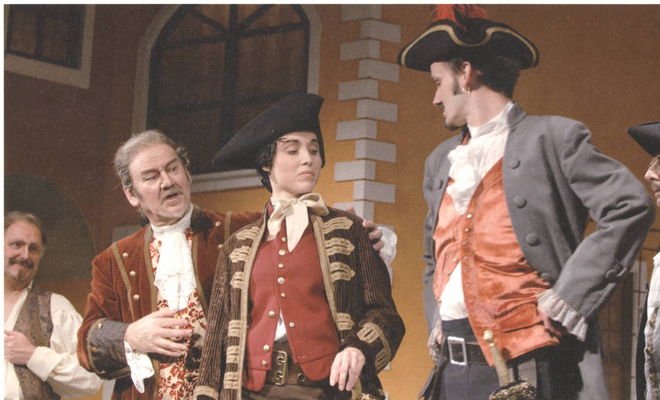
In Szene: Himmlisch/teuflich in «Ä Diener vo zwee Herre» 2007...

Zweimal dasselbe Stück – das sollte nie mehr passieren. Doch auch in der Stück-Auswahl blieb Buochs gegenüber Stans in den folgenden Jahren in Führung. Jedenfalls aus der Sicht des Kernser Pfarrers von Ah: Dieser schrieb nämlich 1875 in seiner Rubrik «Der Weltüberblicker», die Aufführungen der lieben Stanser seien zwar meisterhaft, die Stückwahl aber halte sich nicht auf gleicher