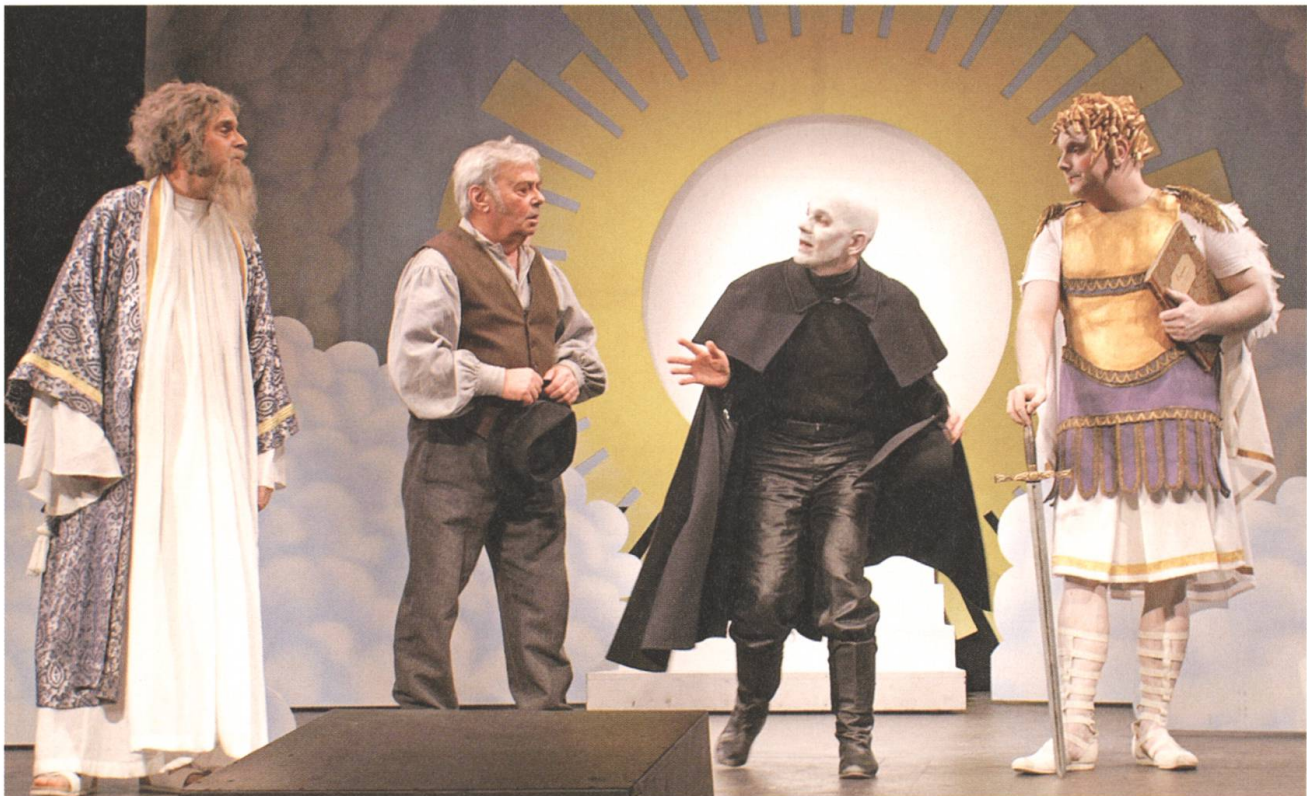
...und romantisch/dramatisch in «Dr Brander Chasp und s ewig Läbä» 2006.

Der Engelberger Architekt Cattani lieferte unentgeltlich die Pläne für den Neubau mit einem Kostenvoranschlag von 15'000 Franken. Vereinfachungen am Gebäude reduzierten diesen Betrag zwar auf 12'000 Franken, aber die Beschaffung dieser Summe verursachte den Theaterleuten