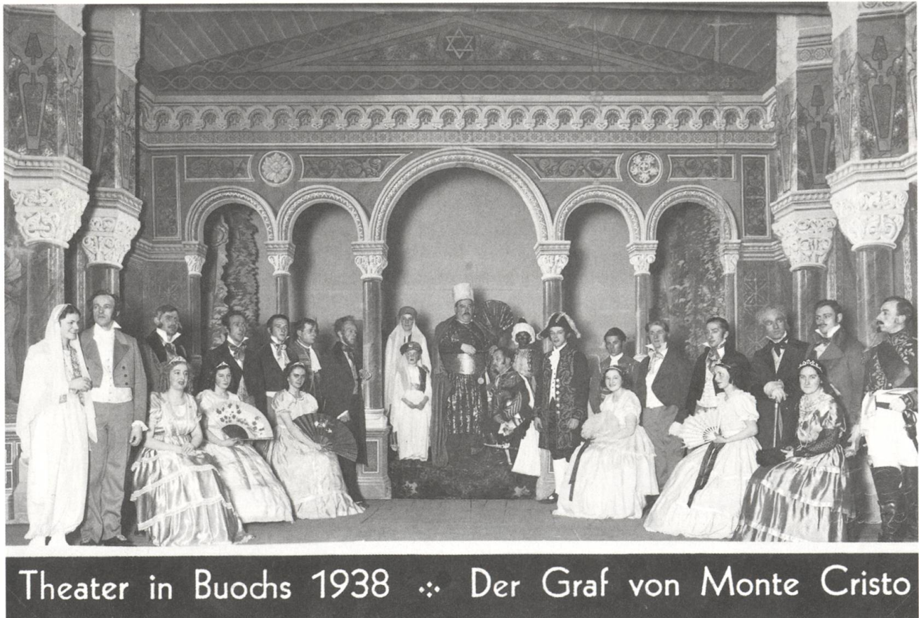
...und im Jahr darauf zu einem komplett anderen Thema in «Der Graf von Monte Cristo».