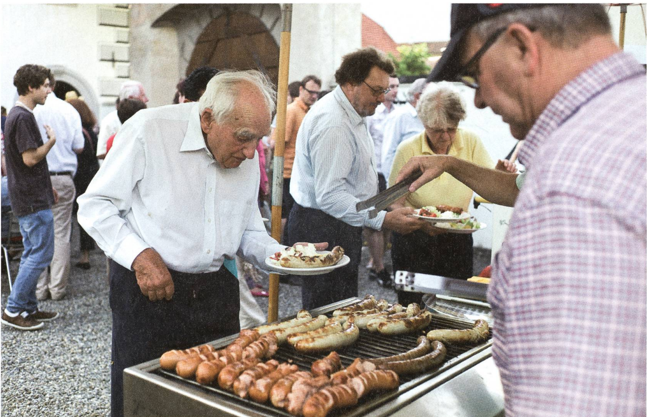
Kunst macht hungrig: Besucher an der Vernissage der Ausstellung «Kleine, grosse Welten».

Weitere interessante Aspekte dieser Schenkung sind die männlichen Aktzeichnungen aus der Studienzeit in München, welche bis anhin in der Forschung über Deschwanden noch keine grosse Aufmerksamkeit genossen haben. Zudem beinhaltet die Schenkung noch über 1000 kleine