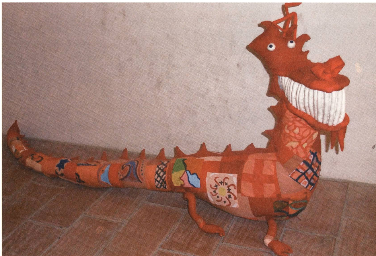
Kunstfigur: Der Kinderclub hat «Dragor Winkracho Helvetio vom Ried» erschaffen.