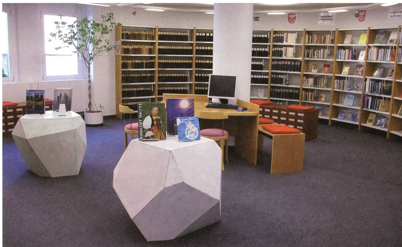
Die Nidwaldner Sammlung in der Kantonsbibliothek: Eine Einladung zum Lesen.

Soweit die Analyse. In einer nächsten Phase