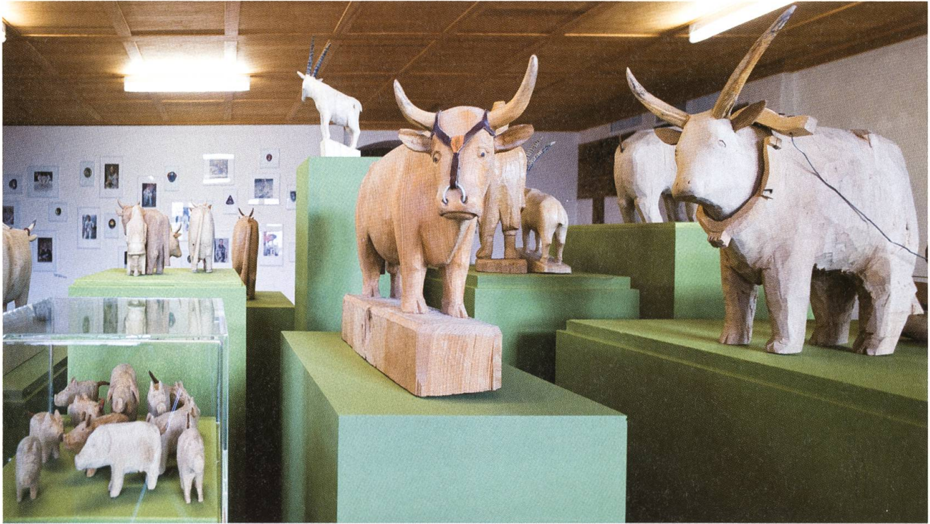
Kleine Welt, grosse Wirkung: Die Tierfiguren von Walter Murer in der Ausstellung «Kleine, grosse Welten».

besuchern, mit der Zeit erhielt die Hörsehbar regelrecht Stammgäste, die die Fortsetzung der transparenten Poesie miterleben wollten. Das Finale schliesslich endete mit einer gewaltigen Eruption: Gläser, Glasplatten, Flaschen wurden zerschlagen.