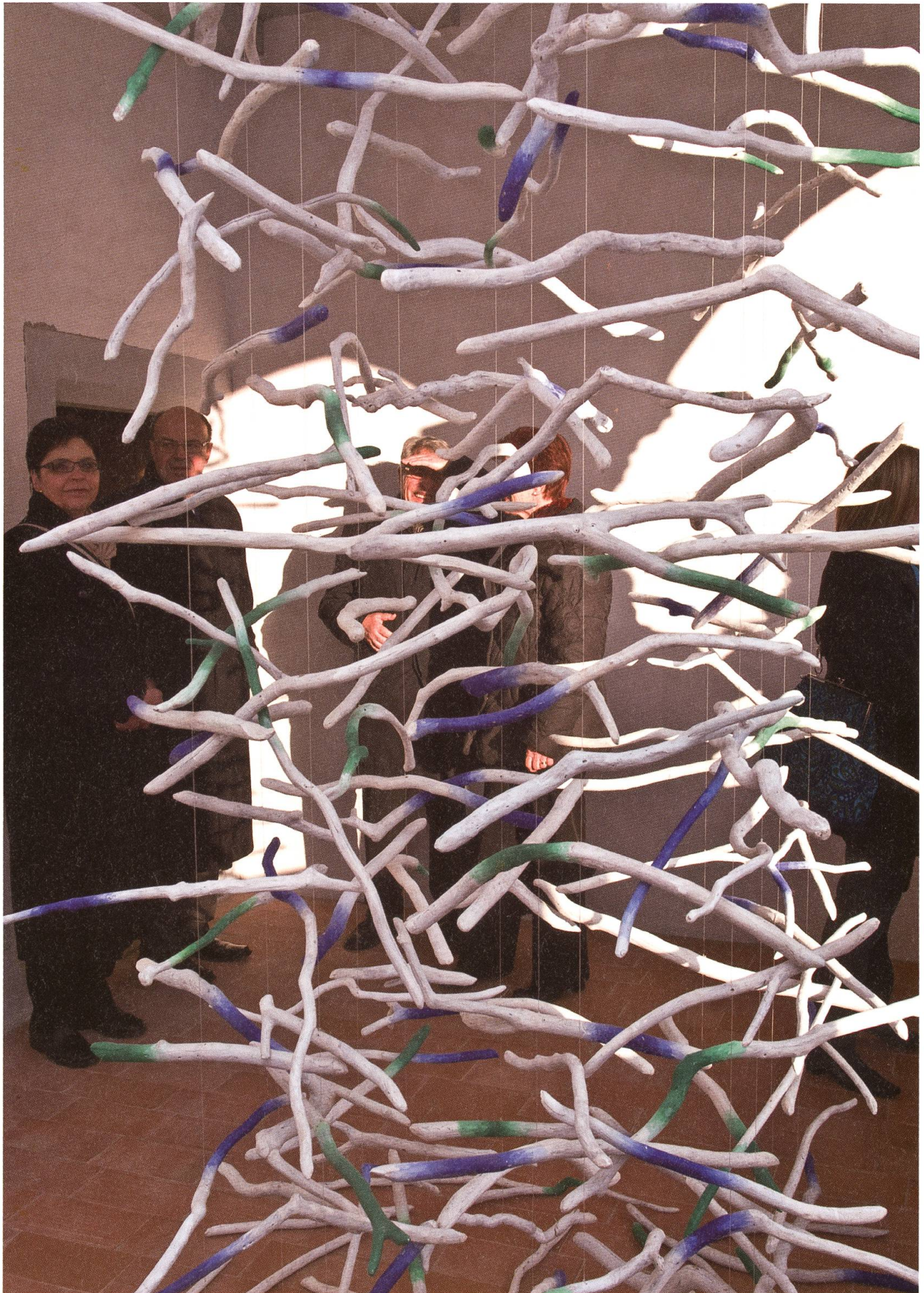
Kunst im Spiel: Mit Licht und Schatten, Material und Menschen. Werk von Gertrud Guyer Wyrsch.