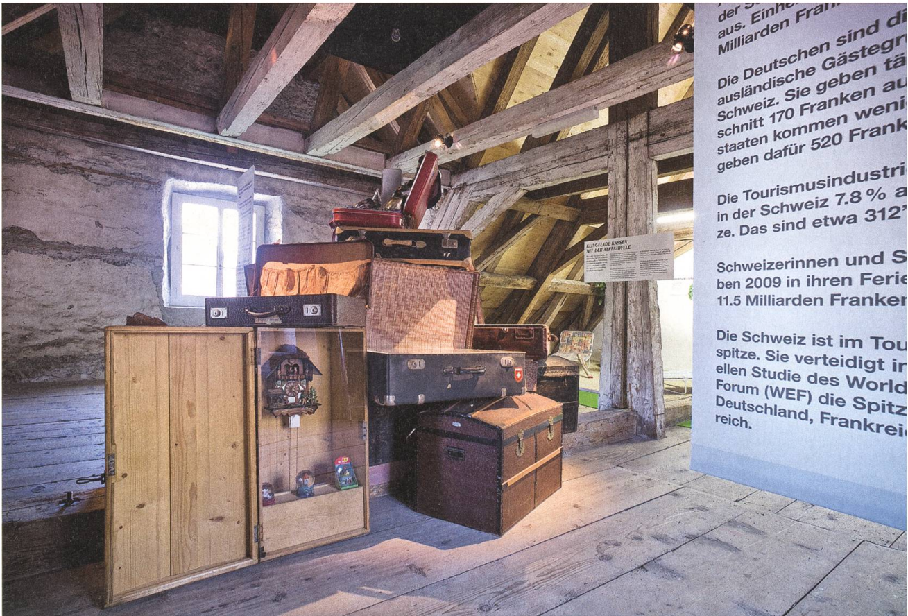
«Von Gipfelstürmern und Kofferträgern»: Spannende Ausstellung über den Tourismus in Nidwalden.