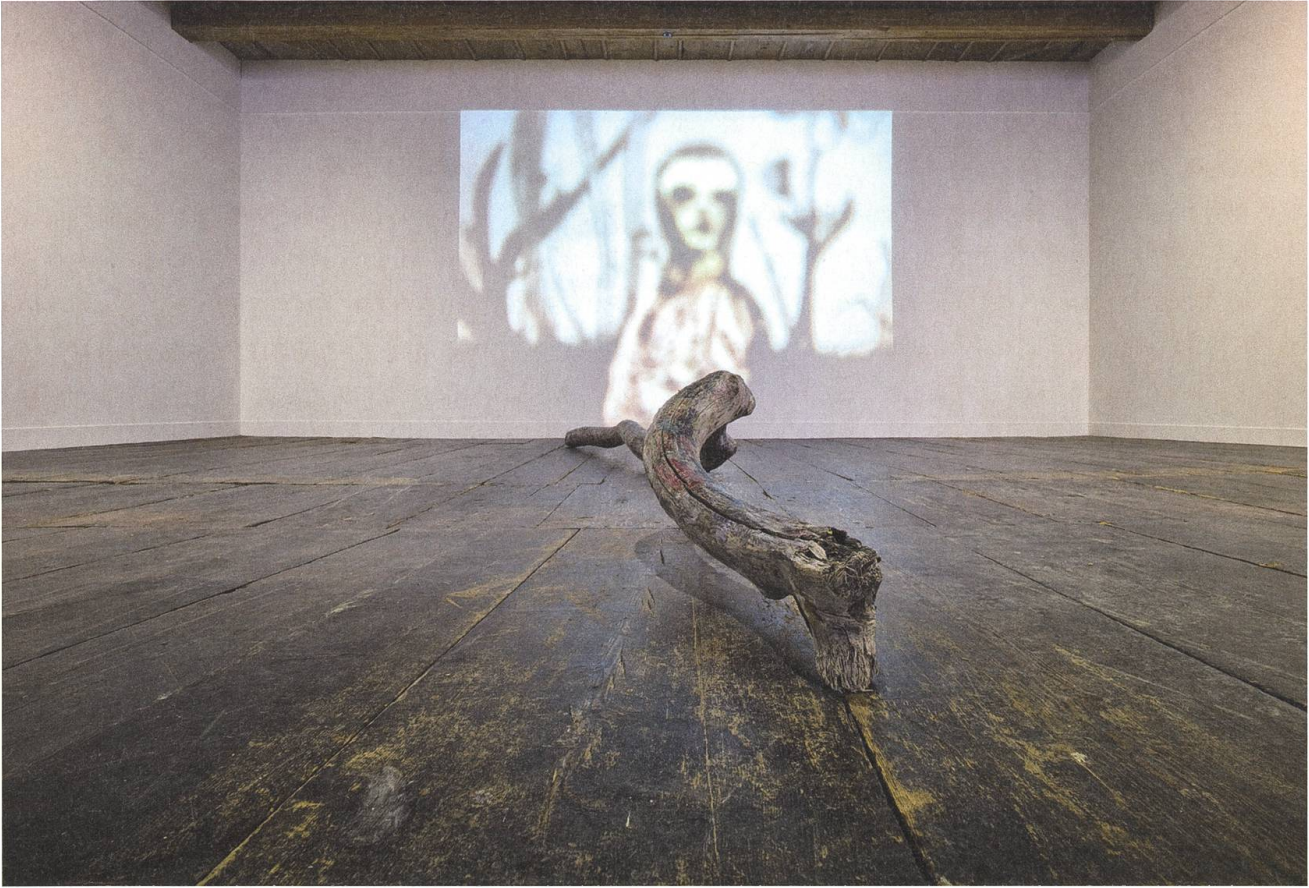
Paul Lussi: Angeschwemmtes Holz, zugeflogene Bildideen; eine Installation im Raum.