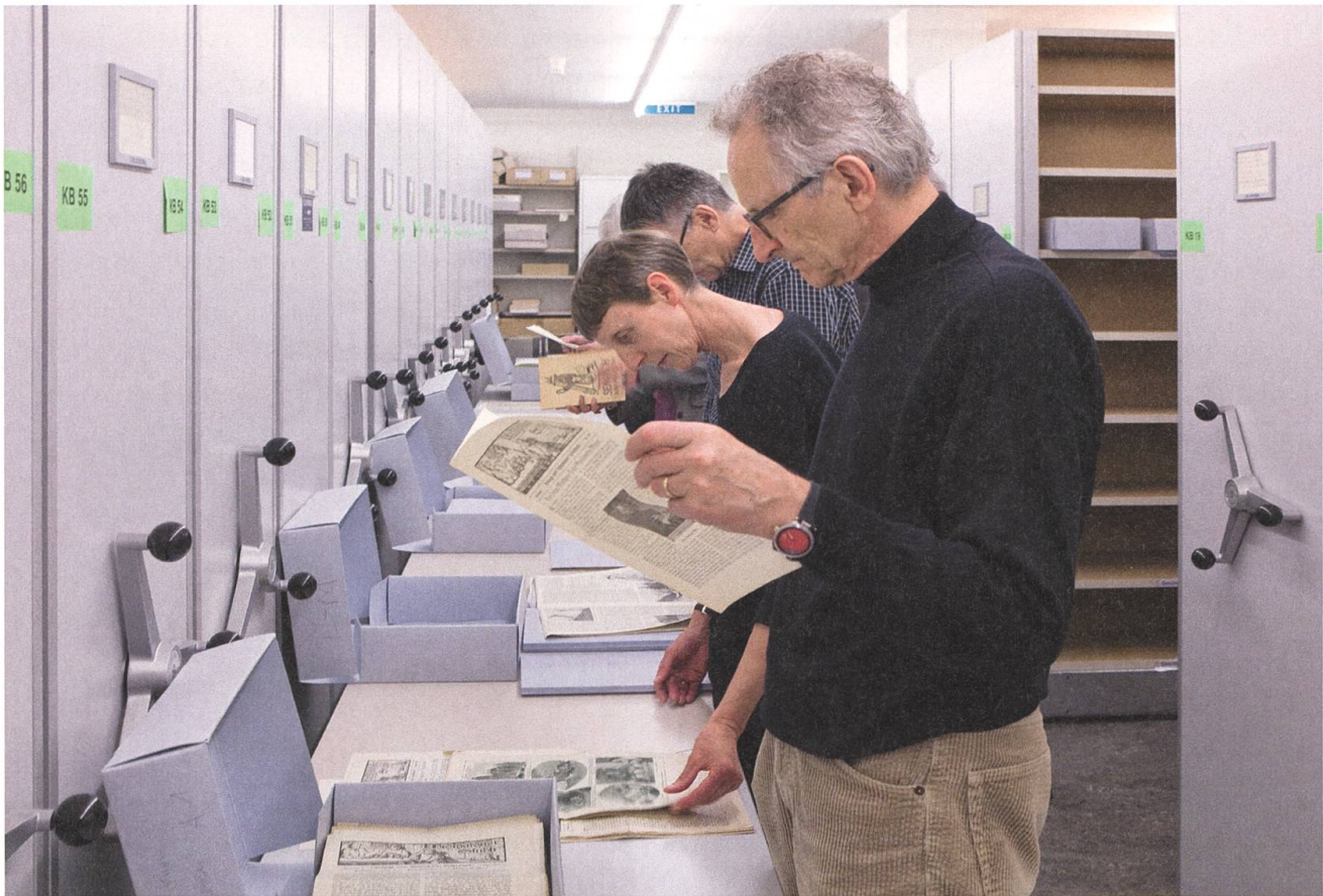
Die Kantonsbibliothek weitet ihr Dienstleistungs-Angebot permanent aus: Zugang zum Archiv.

diese Figuren schon erlebt hatten. Nach dem feinen Znacht und dem Abendprogramm schlüpfen alle in ihre Schlafsäcke. Die Taschenlampen wurden gelöscht, doch was trampelte, fauchte und polterte im Treppenhaus? Hoffentlich nicht der von allen gefürchtete Museumsgeist? Nein, es war der Cousin des Clubmaskottchens «Dragor Winkdracho Helvetio vom Ried». Ganz zahm und sehr unterhaltsam erzählte der Drache die Gutenachtgeschichte.