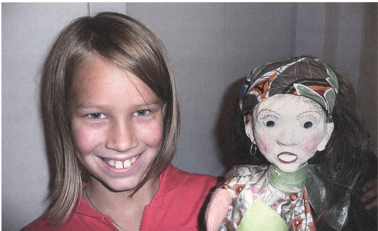
Kinderclub des Nidwaldner Museums: Kinder gestalten Handpuppen.

Der Höhepunkt des Clubjahres stand im September auf dem Programm. Alle waren gespannt auf die erste Museumsnacht: Nach einem feinen Apéro im Garten des Winkelriedhauses folgte schon die erste Überraschung: Im Dachstock wartete «DChronä-Liina» und erzählte von ihrem feudalen Leben als Königin. Im Anschluss an das Puppentheater stellten die Kinder ihre selber gestalteten Handpuppen vor. Erstaunlich, welche Abenteuer